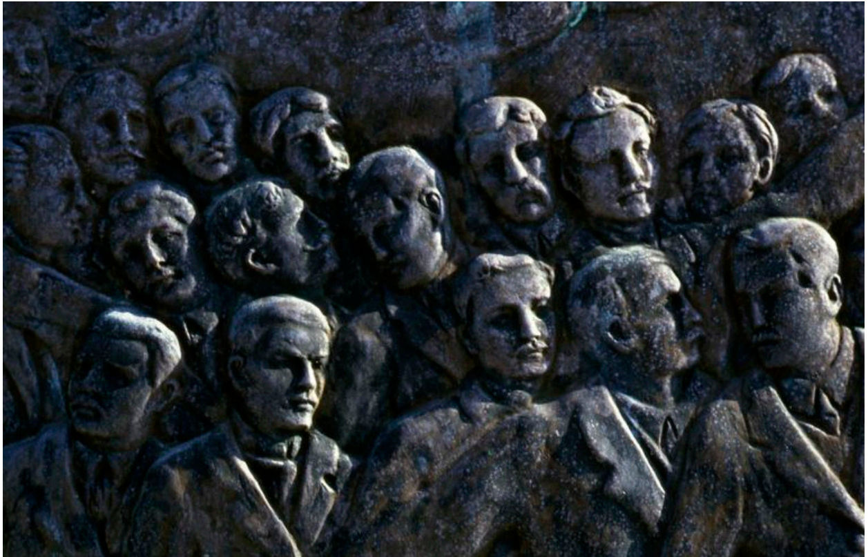
Vue de détail.