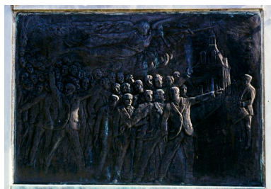
Vue générale. IVR22_19948000413ZA