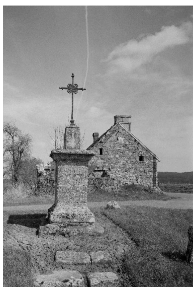
Vue générale de la croix et de son environnement.