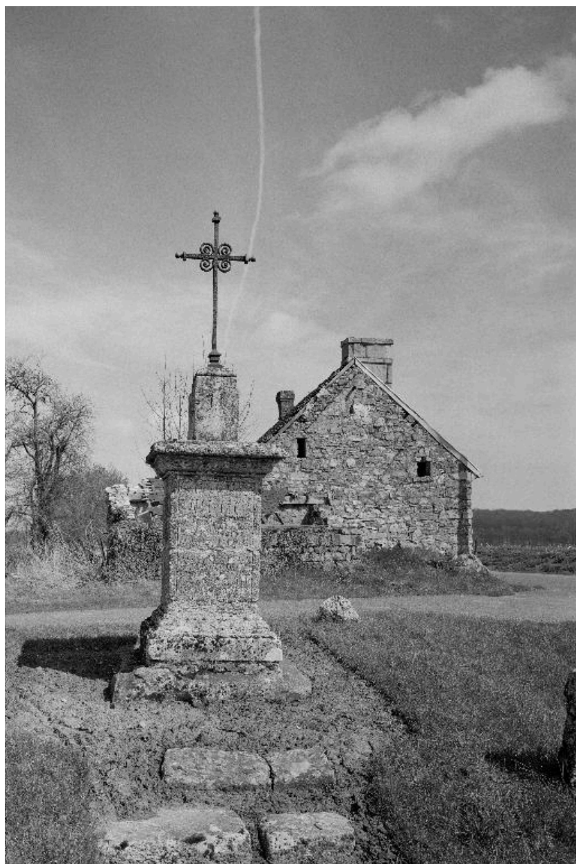
Vue générale de la croix et de son environnement.