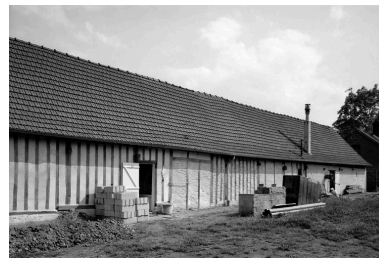
Elévation postérieure. IVR22_19856000878X