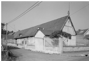
Elévation antérieure. IVR22_19856000881X