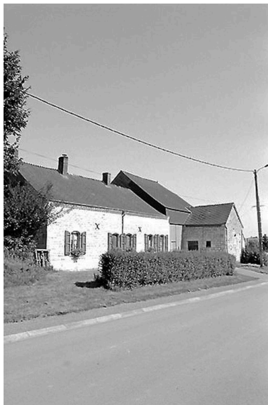
Vue générale. IVR22_19980202741Z