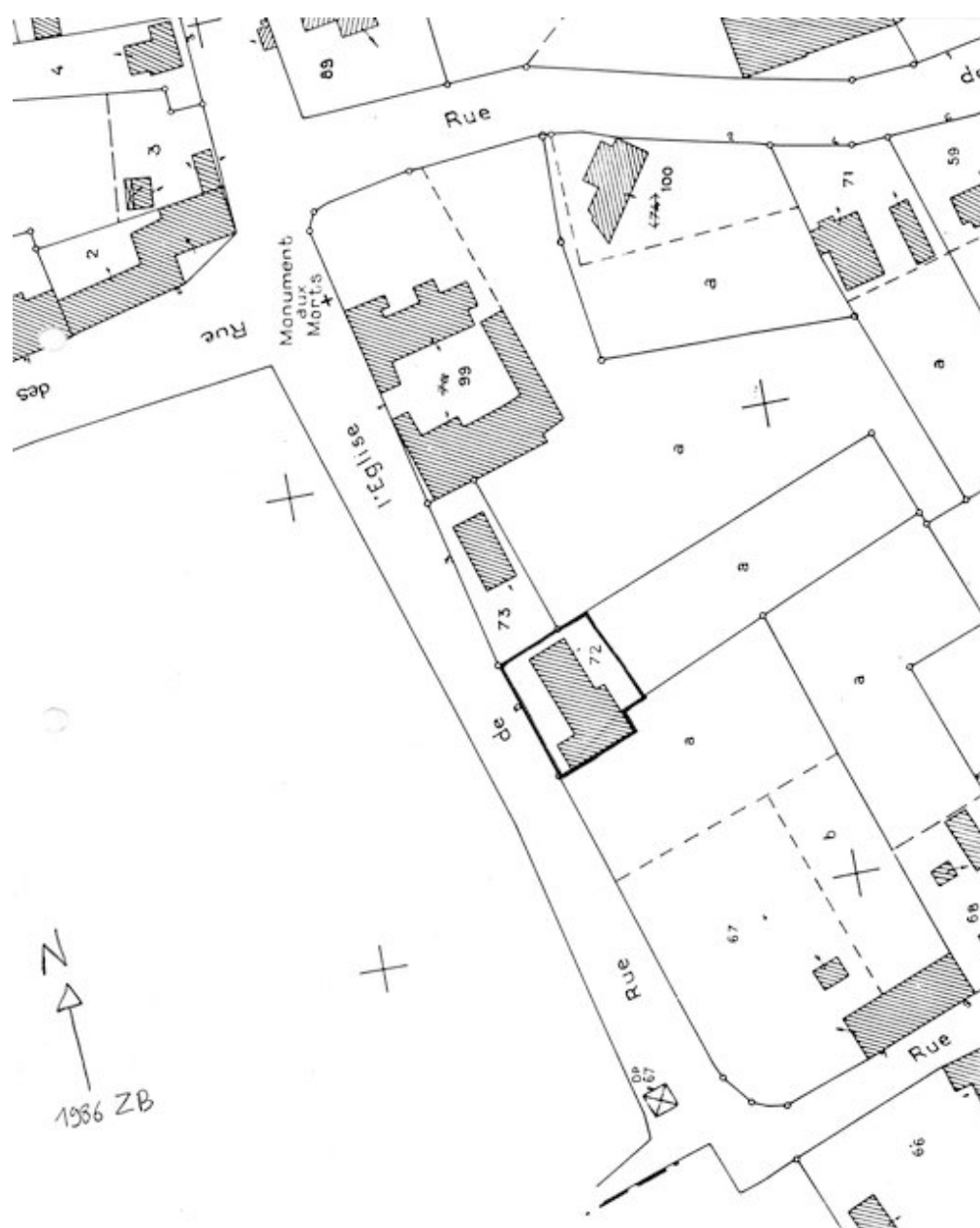
Plan de situation. Extrait du plan cadastral de 1986, section ZB.