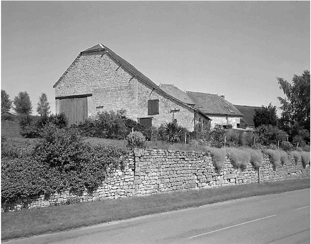
Vue générale depuis la route.