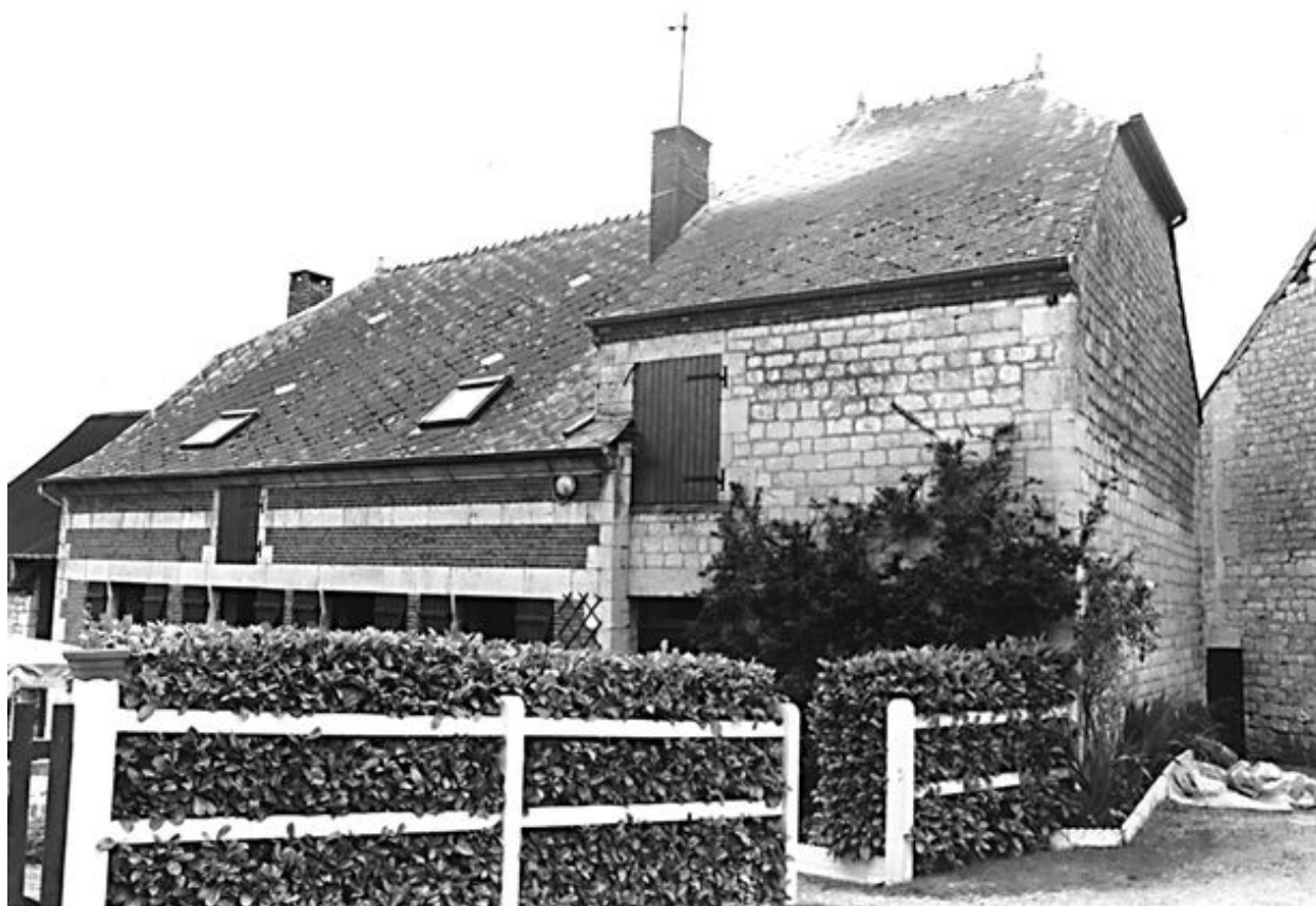
Logis et étable attenante.