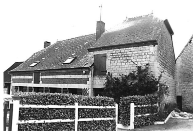
Logis et étable attenante.

IVR22_19980202913Z