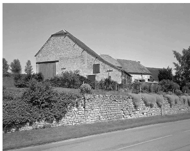
Vue générale depuis la route. IVR22_20010201799V

IVR22_20080290217NUCA