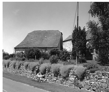
Vue générale depuis la route. IVR22_20010201800V