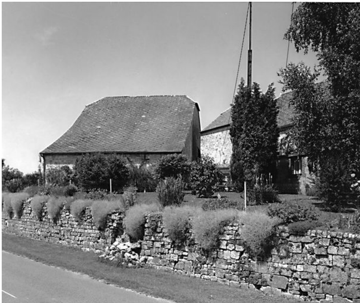
Vue générale depuis la route.