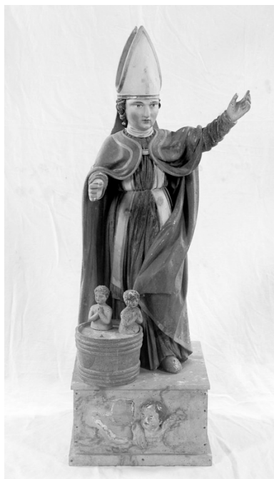
Vue générale. IVR22_19998000944X