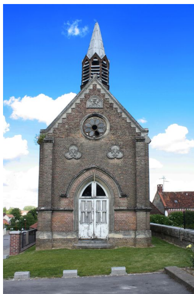
Façade principale.