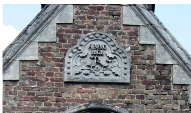
Vue de détail sur la date portée (1868) et sur le monogramme JR. IVR22_20088015437NUCA

IVR22_20088015435NUCA