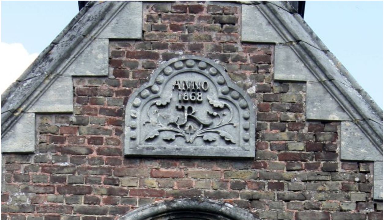
Vue de détail sur la date portée (1868) et sur le monogramme JR.