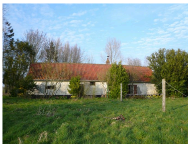
Vue postérieure.