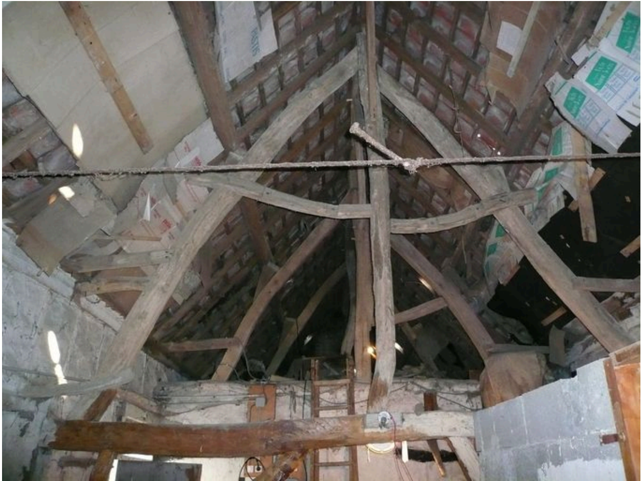
Vue de la charpente.