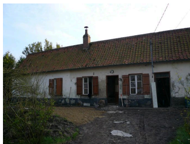
Vue générale. IVR22_20078005486NUCA