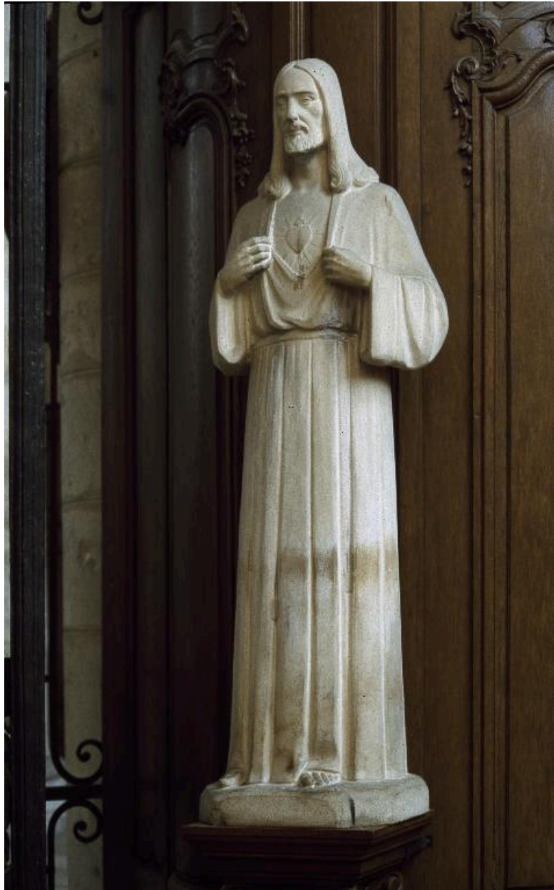
Vue générale, de trois-quarts.