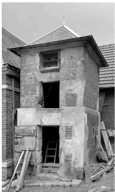
Colombier.