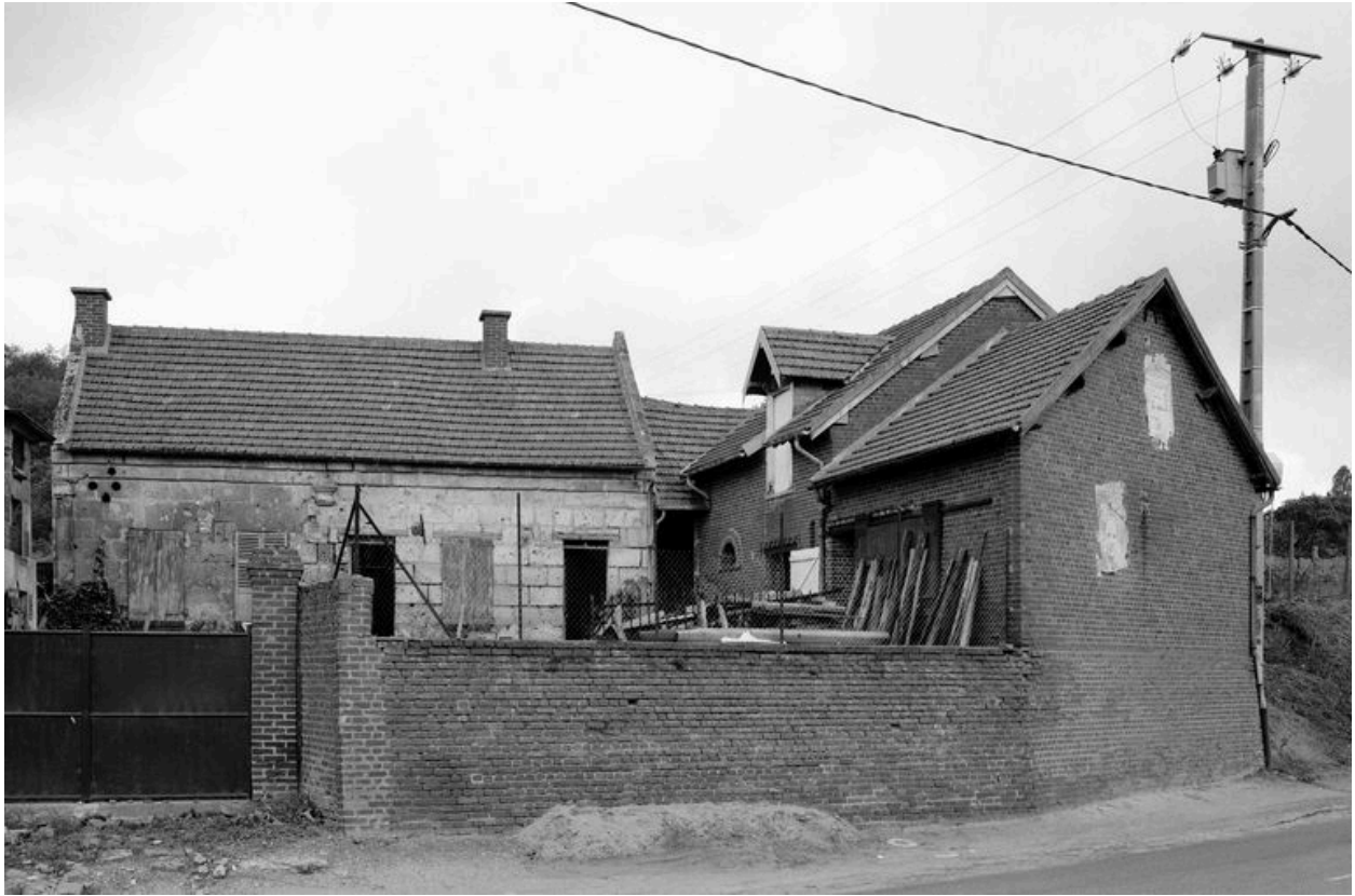
Vue générale sur rue.