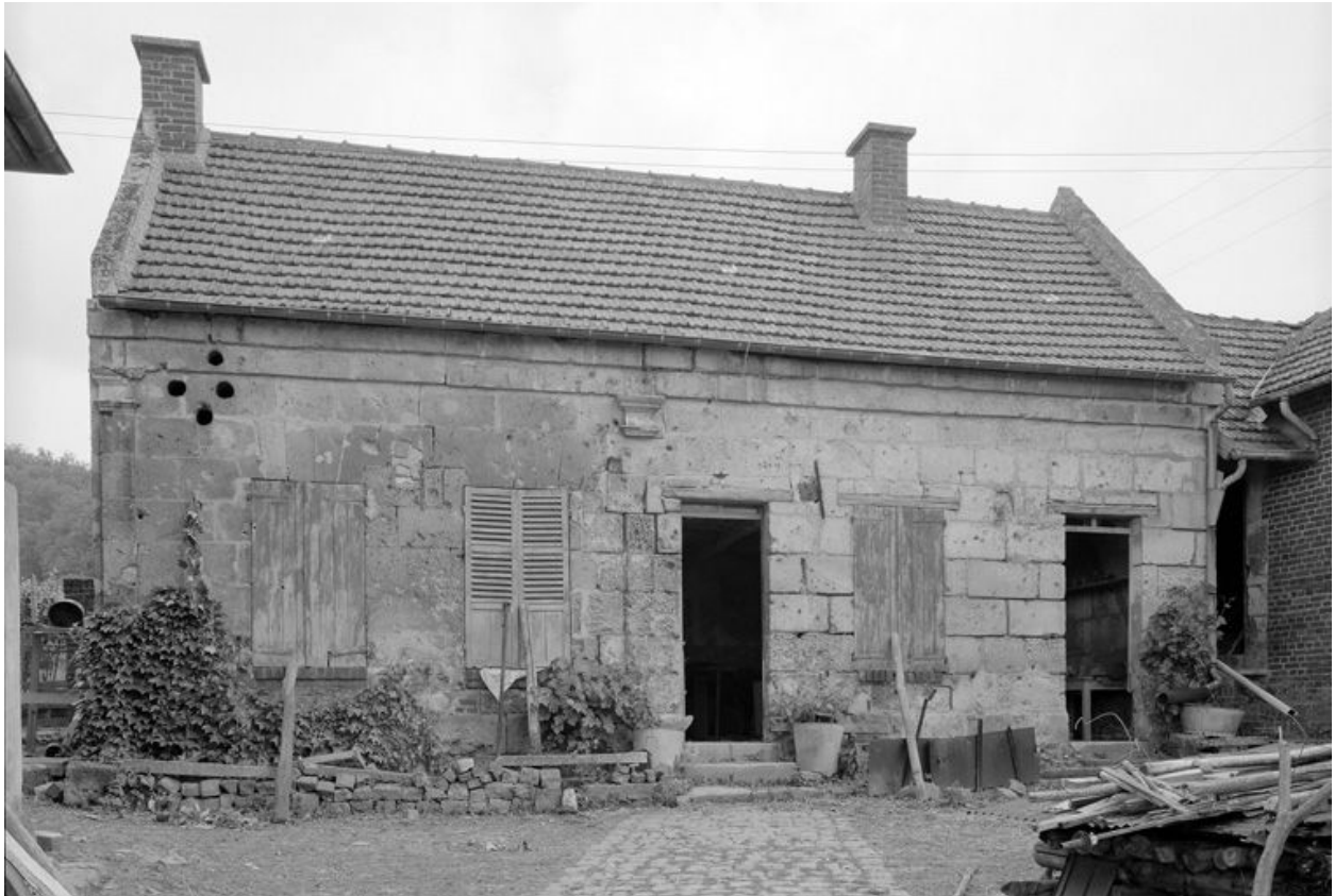
Logis. Elévation antérieure.