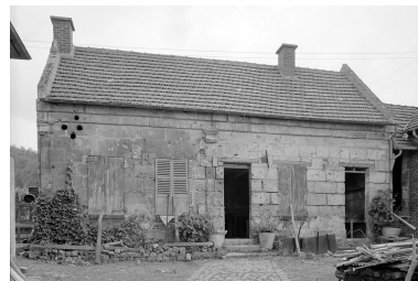
Logis. Elévation antérieure. IVR22_19856000973X