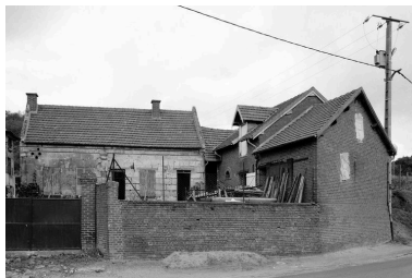
Vue générale sur rue. IVR22_19856000971X