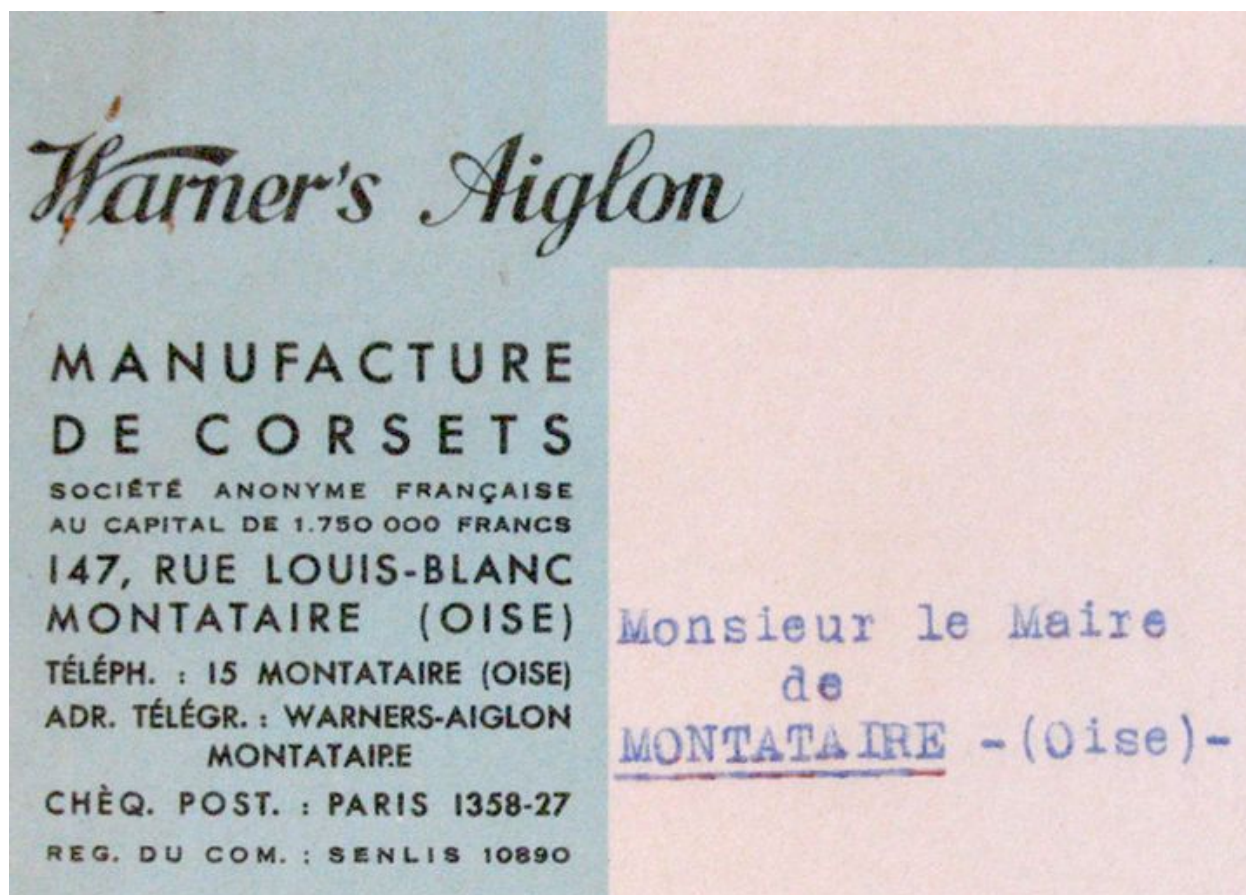
Papier à lettre à en-tête de l'usine, 1939 (AC Montataire ; 4H4).