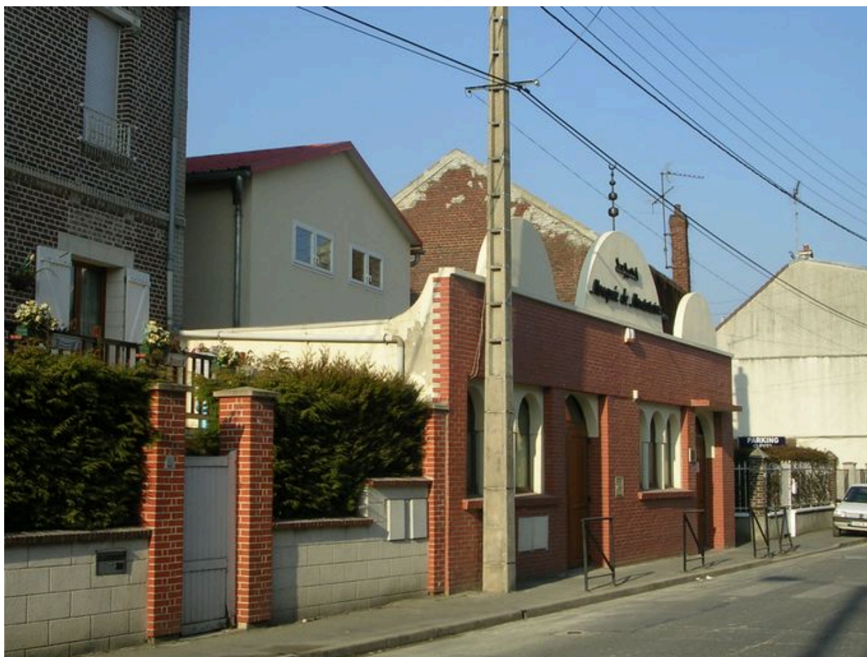
L'ancienne usine de confection transformée en mosquée.