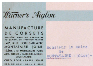
Papier à lettre à en-tête de l'usine, 1939 (AC Montataire ; 4H4).

IVR22_20076005616NUCAB