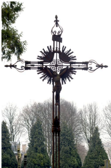
Vue de détail sur la croix en fonte. IVR22_20058000303NUCA