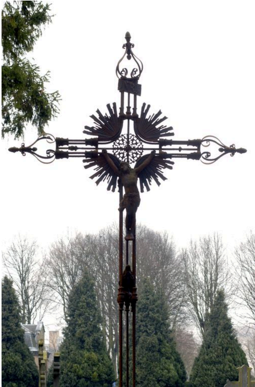
Vue de détail sur la croix en fonte.