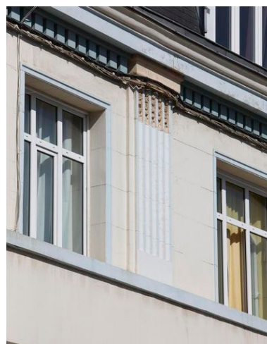
Détail d'un pilastre témoignant d'une réinterprétation moderne du style classique. IVR31_20096200221NUCA