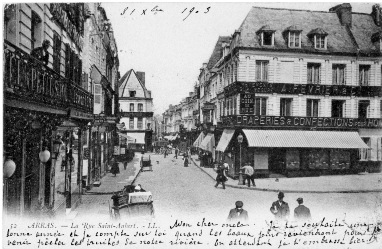
Arras. La rue Saint-Aubert. Carte postale, 1903 (AD Pas-de-Calais ; 5Fi 041/36).