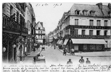
Arras. La rue Saint-Aubert. Carte postale, 1903. IVR31_20096200059XB