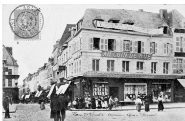
Arras. Place du Théâtre. Ancienne maison Février. Carte postale (AD Pas-de-Calais ; 38 FI 719). IVR31_20096200070XB