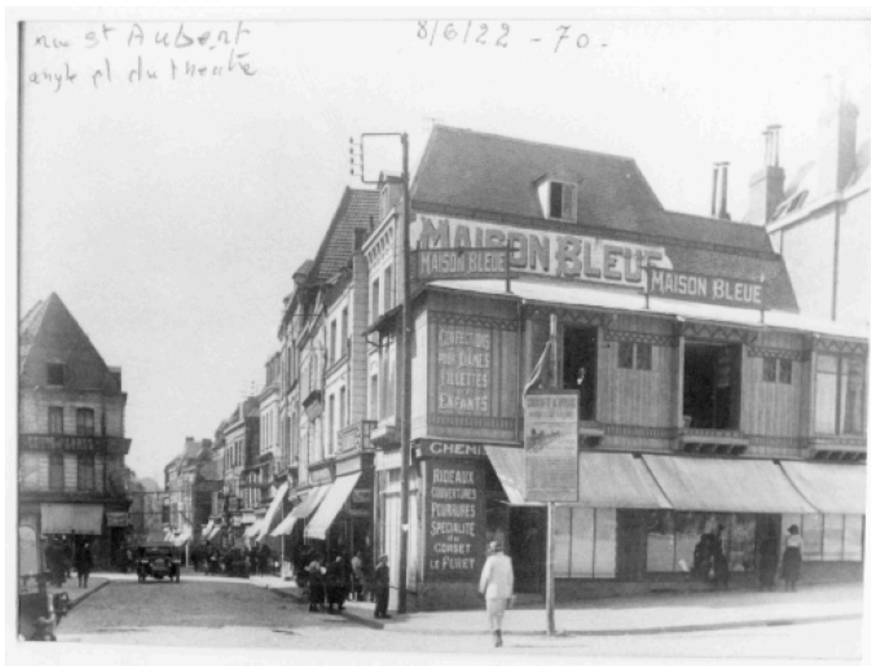
Arras. Place du Théâtre. La Maison Bleue. Baraquement provisoire. Photographie, 1922.