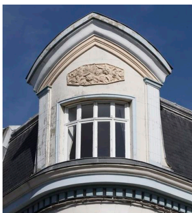
Fronton géométrique et cartouche floral. IVR31_20096200220NUCA