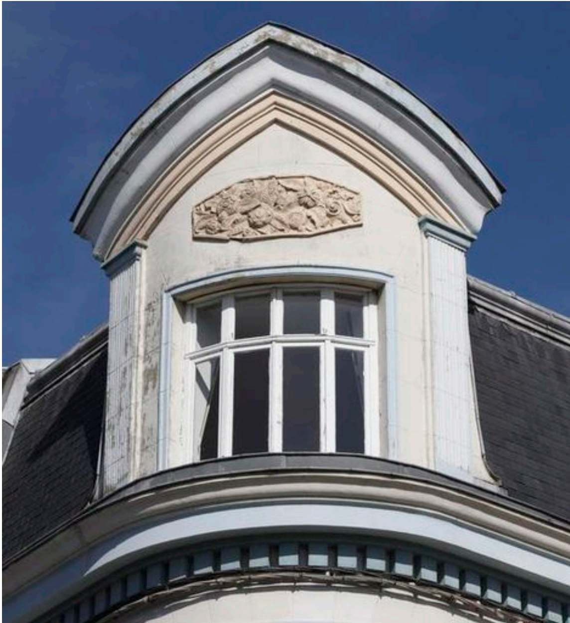
Fronton géométrique et cartouche floral.