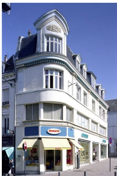
Vue générale. IVR31_20086200168XE