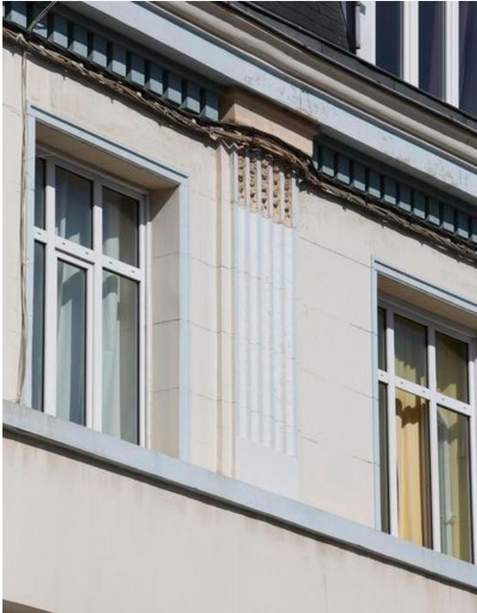
Détail d'un pilastre témoignant d'une réinterprétation moderne du style classique.