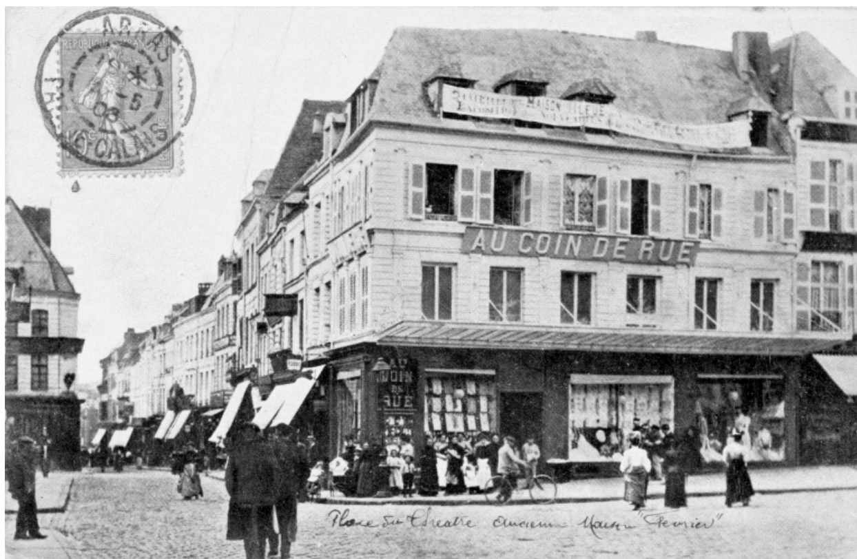
Arras. Place du Théâtre. Ancienne maison Février. Carte postale (AD Pas-de-Calais ; 38 FI 719).