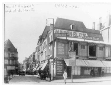
Arras. Place du Théâtre. La Maison Bleue. Baraquement provisoire. Photographie, 1922 (Médiathèque d'Arras ; 165). IVR31_20096200301NUCB