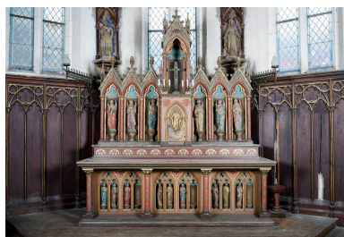
Vue générale depuis la nef. IVR32_20225900326NUCA