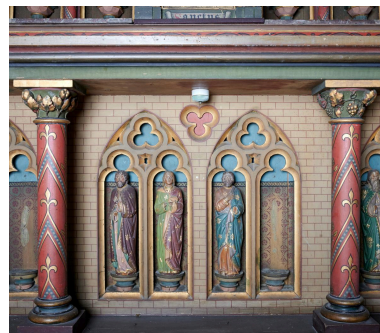
Détail des niches et des prophètes décorant le coffre : groupe central.