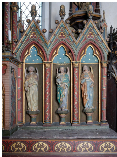
Détail des niches et des anges à droite du tabernacle.