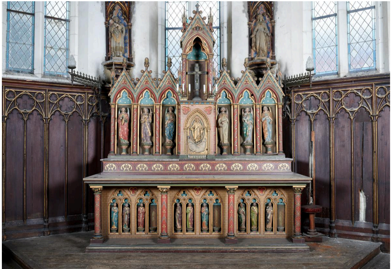
Vue générale depuis la nef.