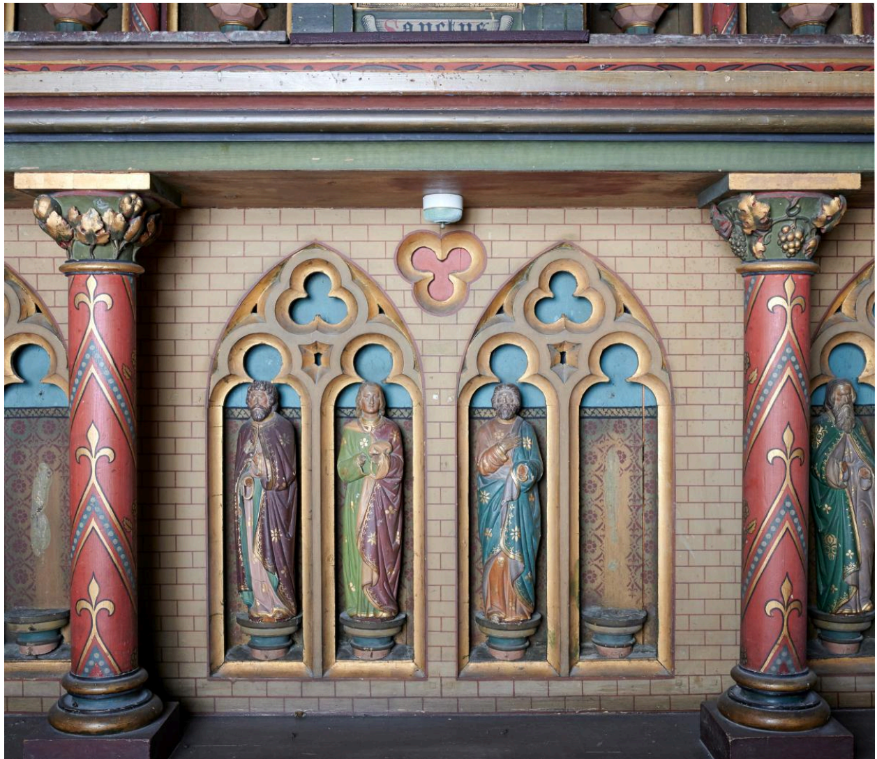
Détail des niches et des prophètes décorant le coffre : groupe central.