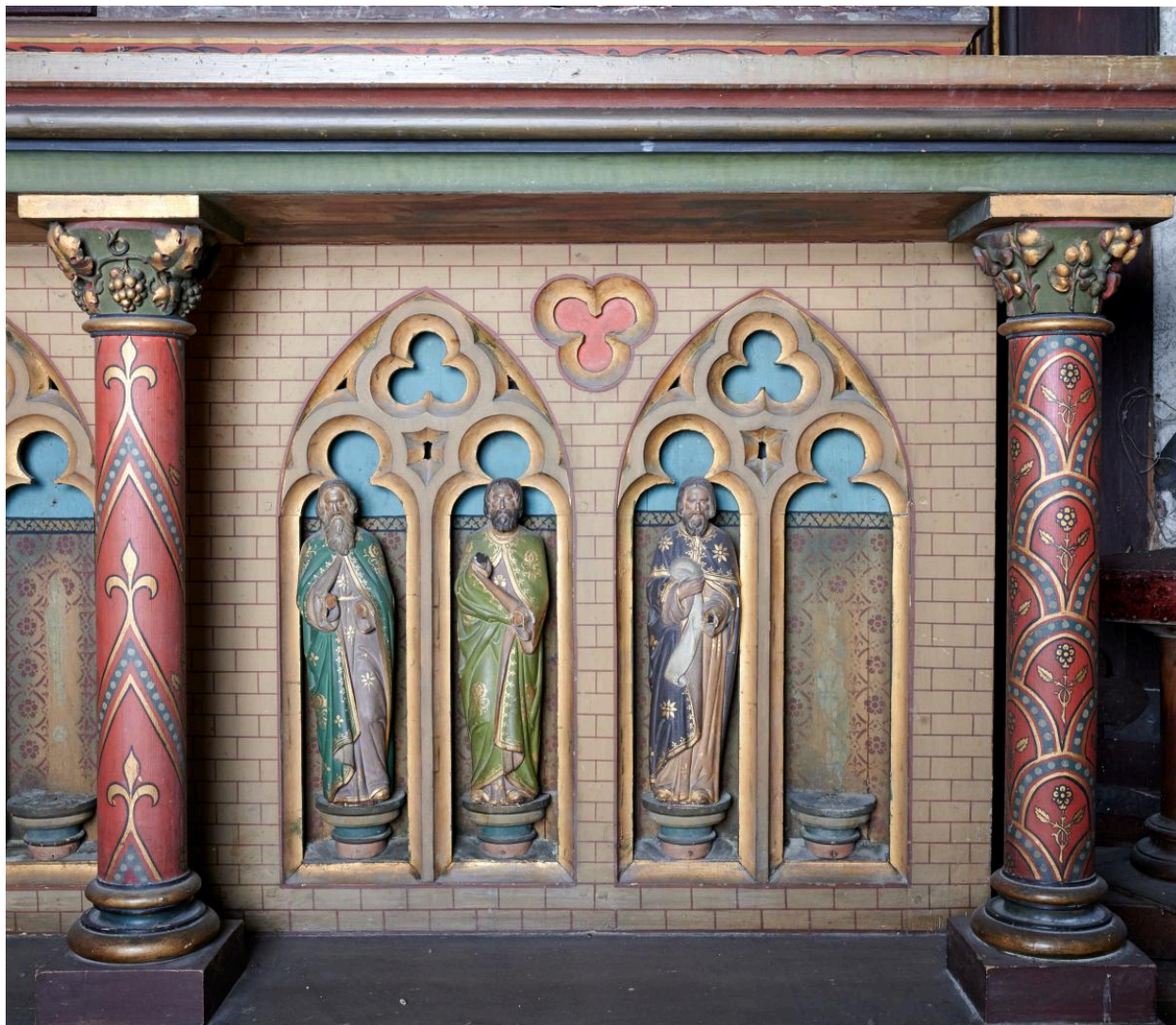
Détail des niches et des prophètes décorant le coffre : groupe de droite.