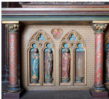
Détail des niches et des prophètes décorant le coffre : groupe de gauche.