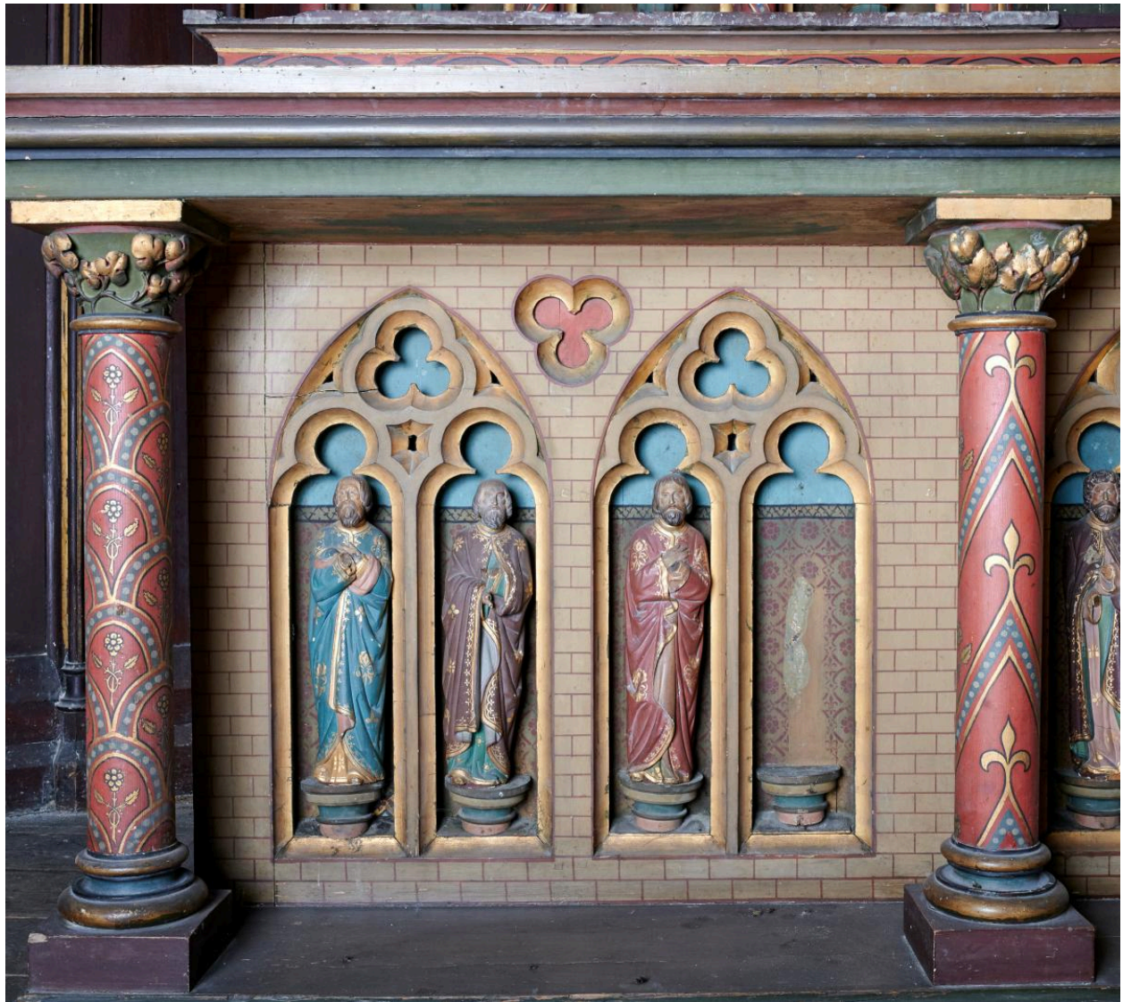
Détail des niches et des prophètes décorant le coffre : groupe de gauche.