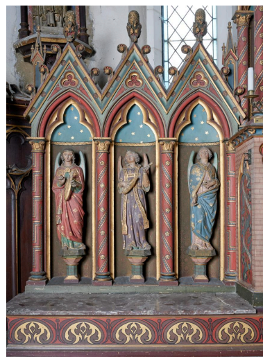
Détail des niches et des anges à gauche du tabernacle. IVR32_20225900324NUCA