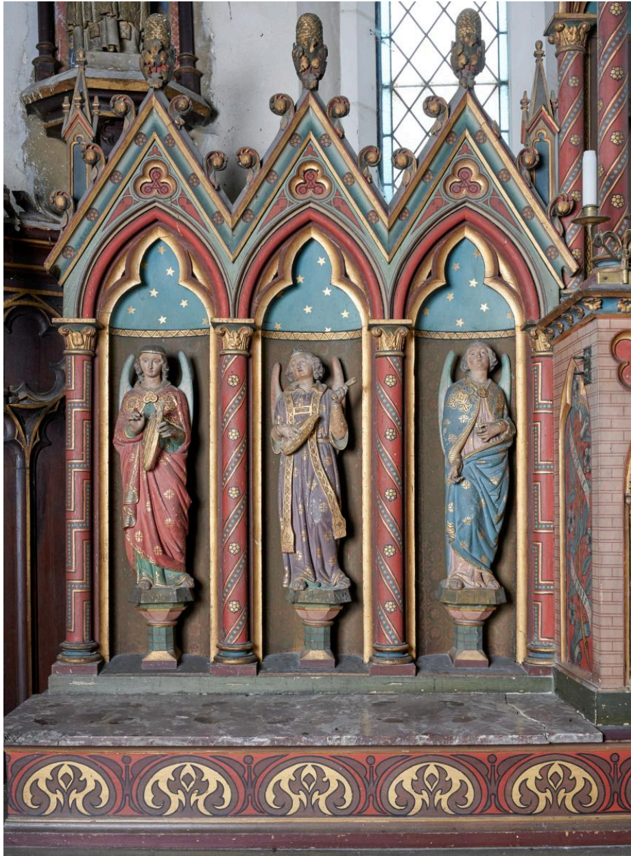
Détail des niches et des anges à gauche du tabernacle.