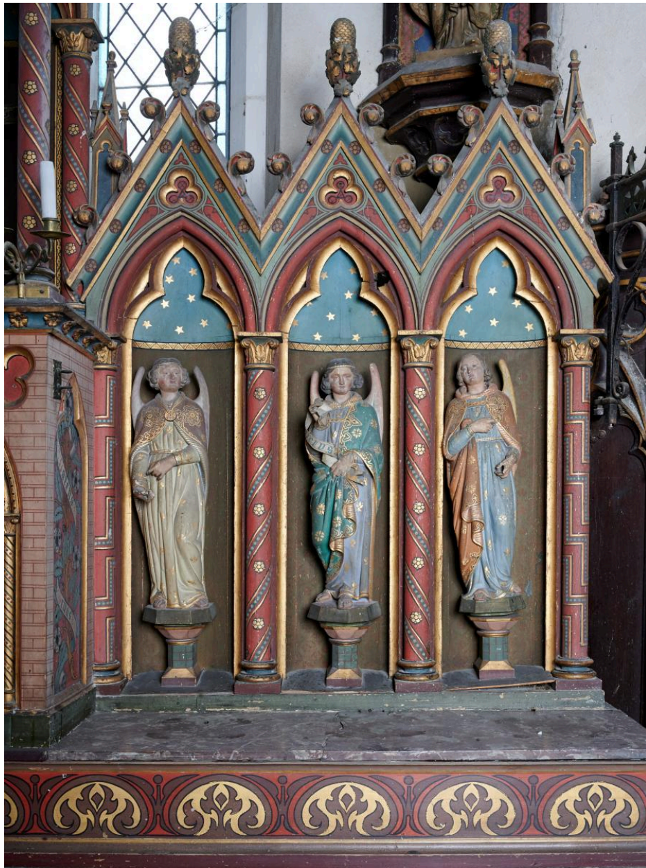
Détail des niches et des anges à droite du tabernacle.