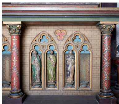
Détail des niches et des prophètes décorant le coffre : groupe de droite. IVR32_20225900322NUCA