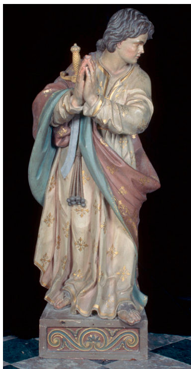
Vue antérieure de l'une des deux statues. IVR22_19988000115ZA