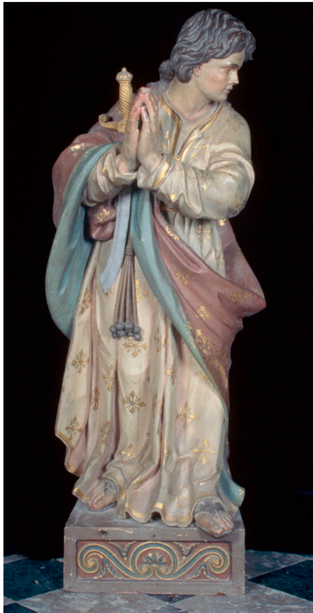
Vue antérieure de l'une des deux statues.