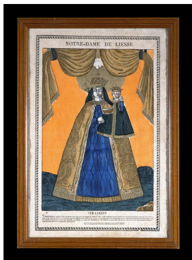
Vue de l'estampe. IVR22_20010201970XA