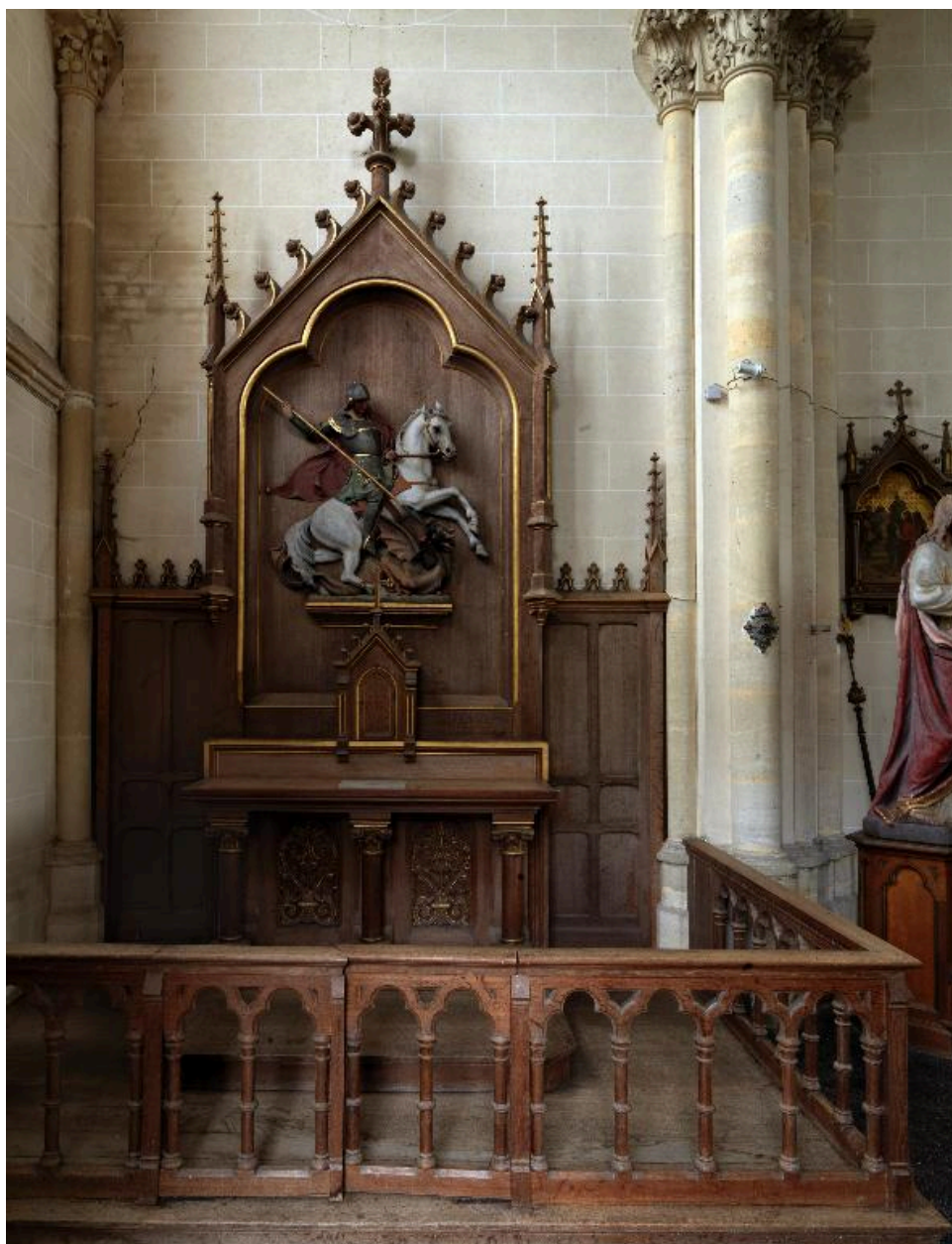
Vue générale de l'autel Saint-Georges.