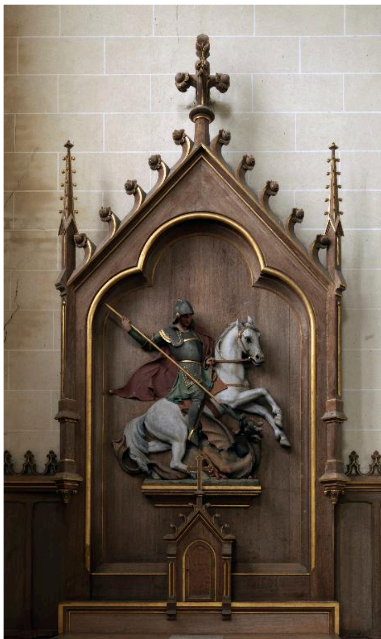
Retable de l'autel Saint-Georges.