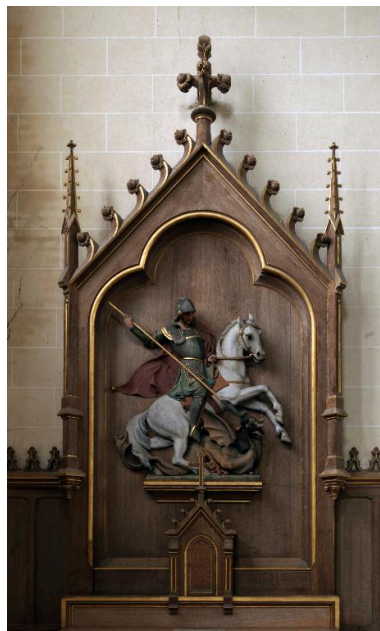
Retable de l'autel Saint-Georges.