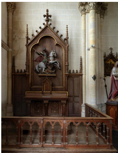
Vue générale de l'autel Saint-Georges.