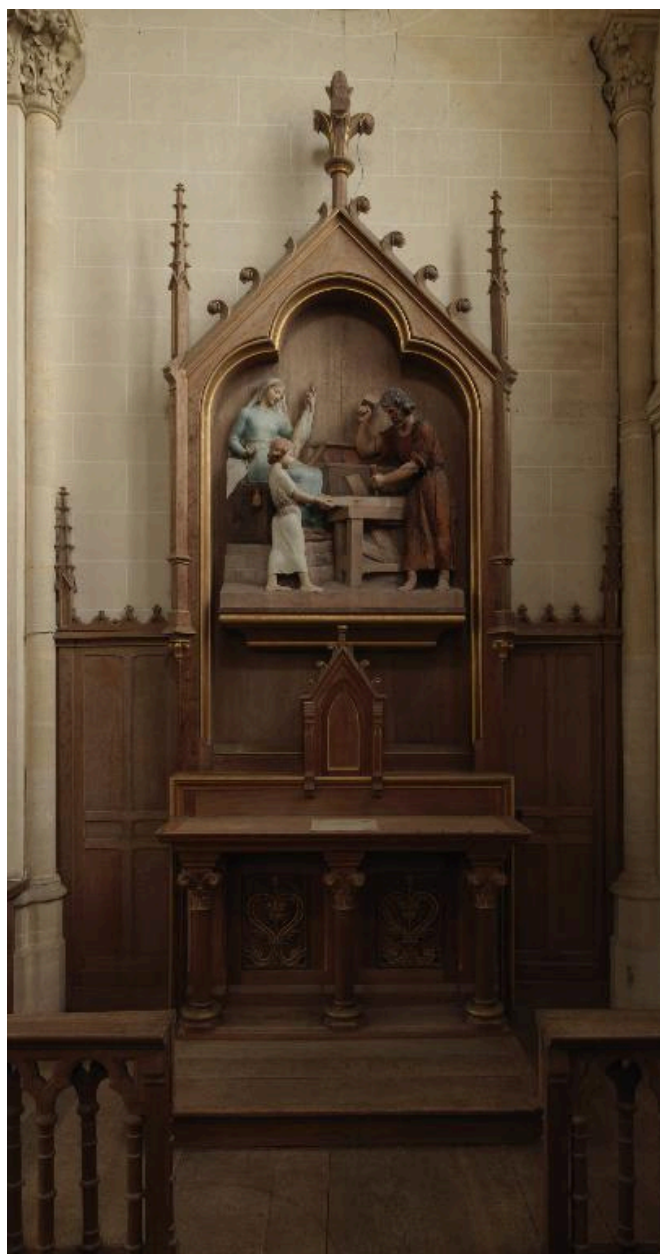
Autel et retable de la Sainte Famille.