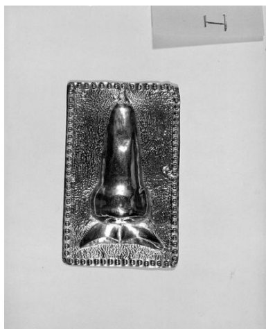
Avers. IVR31_19925902063X