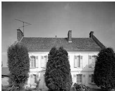
Elévation antérieure. IVR22_19856001404V