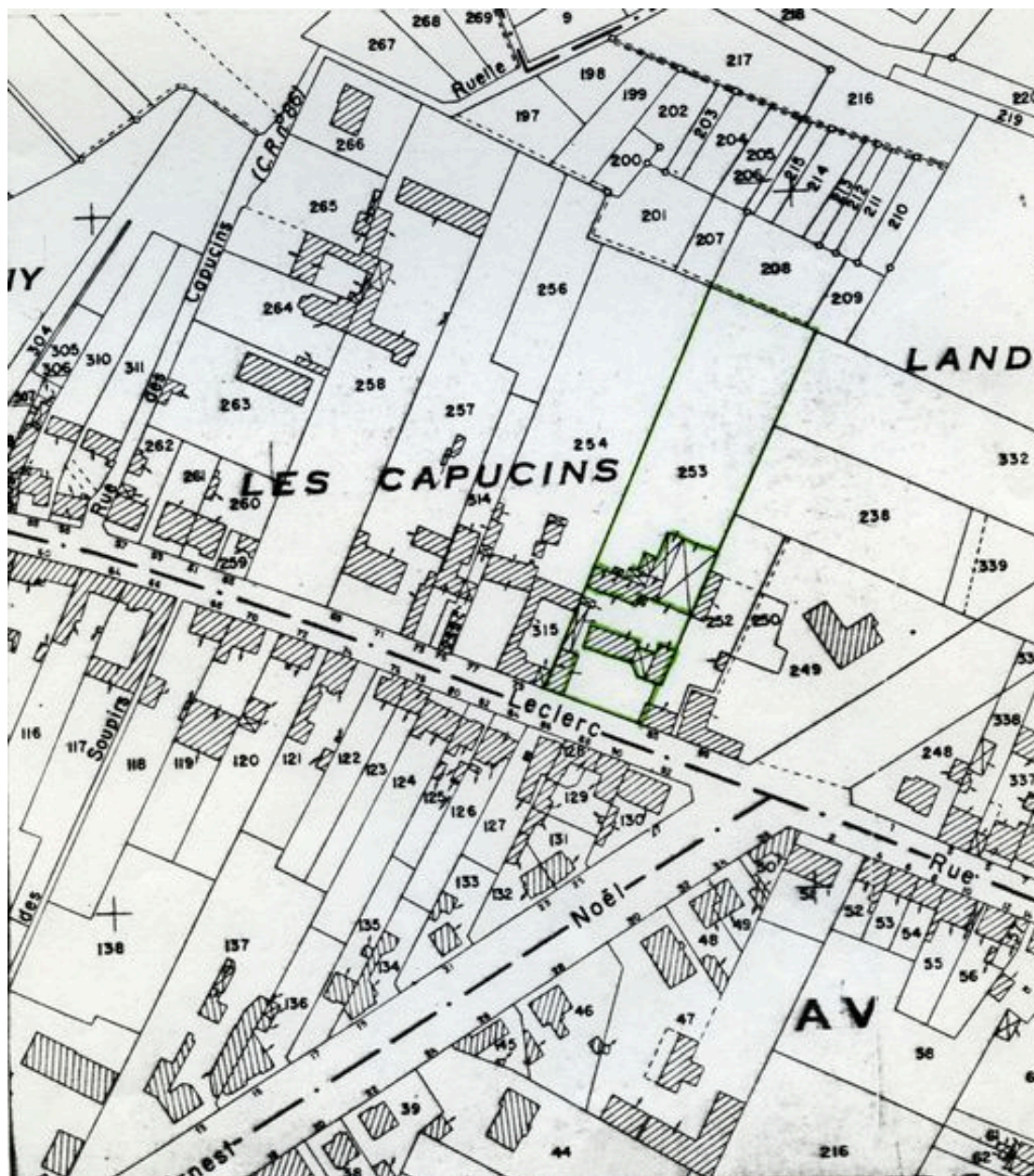
Plan de situation. Extrait du plan cadastral de 1974, section AT 253.