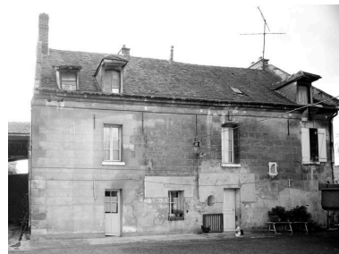
Elévation postérieure. IVR22_19856001403V