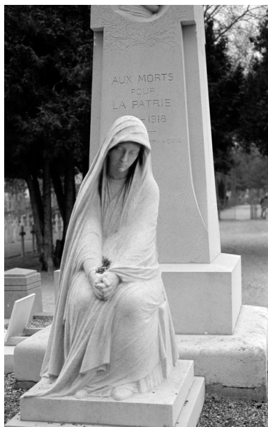
Vue générale. IVR22_19968000100Z