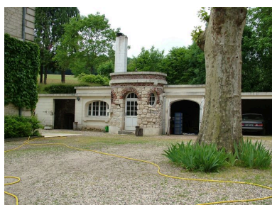
Vue des dépendances. IVR22_20050200784NUCA