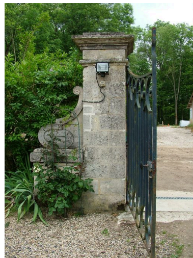
Pilastre du portail d'entrée. IVR22_20050200785NUCA