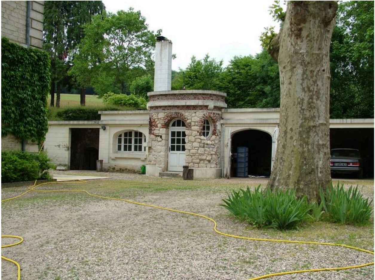
Vue des dépendances.