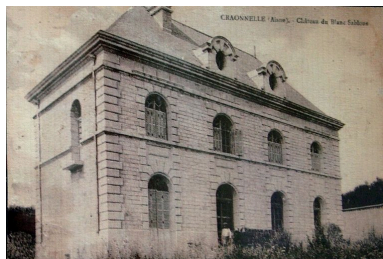
Vue ancienne d'après-guerre (coll. part). IVR22_20050200774NUCAB