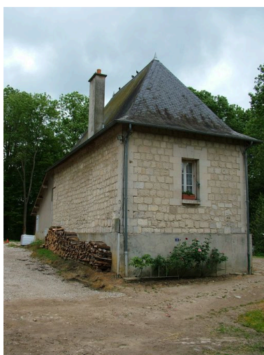
Vue de la maison du gardien.