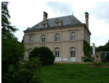
Vue générale. IVR22_20050200787NUCA