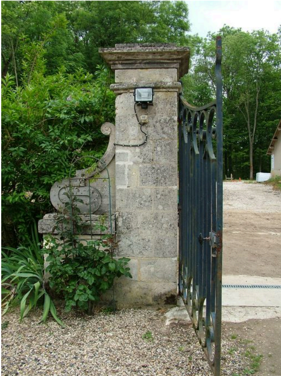
Pilastre du portail d'entrée.