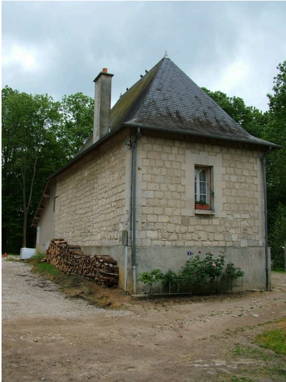
Vue de la maison du gardien.