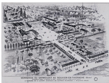
Vue cavalière de la verrerie du Garmouzet, 11 décembre 1891 (Fourmies, fonds de l'Écomusée).