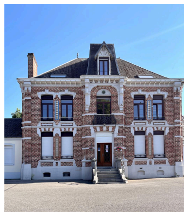
Façade sur cour du logement patrimonial, dit le château.