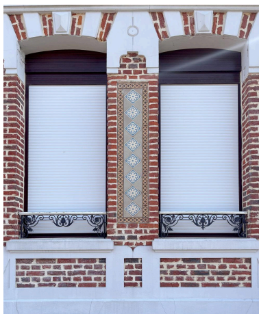
Détail de baies jumelles et du décor de céramique. IVR22_20220205092NUCA

IVR32_20220205089NUCA