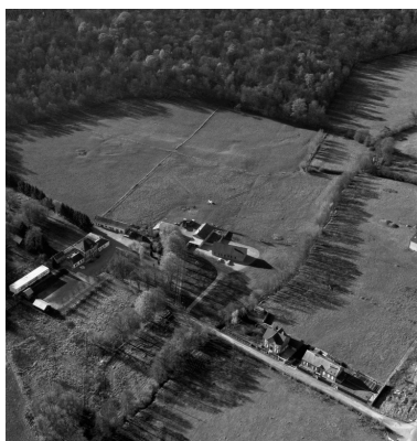
Vue aérienne du site vers le sud-ouest en 1989.