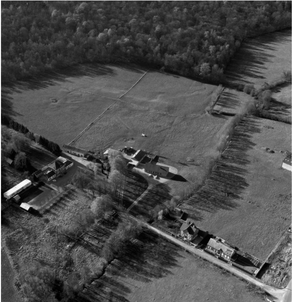
Vue aérienne du site vers le sud-ouest en 1989.