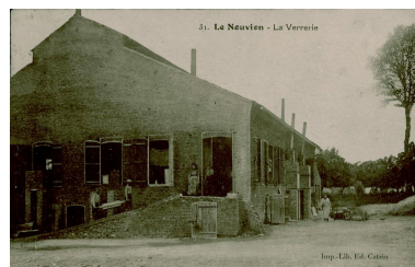
Le Nouvion. La verrerie [du Garmouzet]. Carte postale, S.d. (Fourmies, Écomusée de l'Avesnois ; PH 86.30.9.NR). IVR32_20220205098NUCA