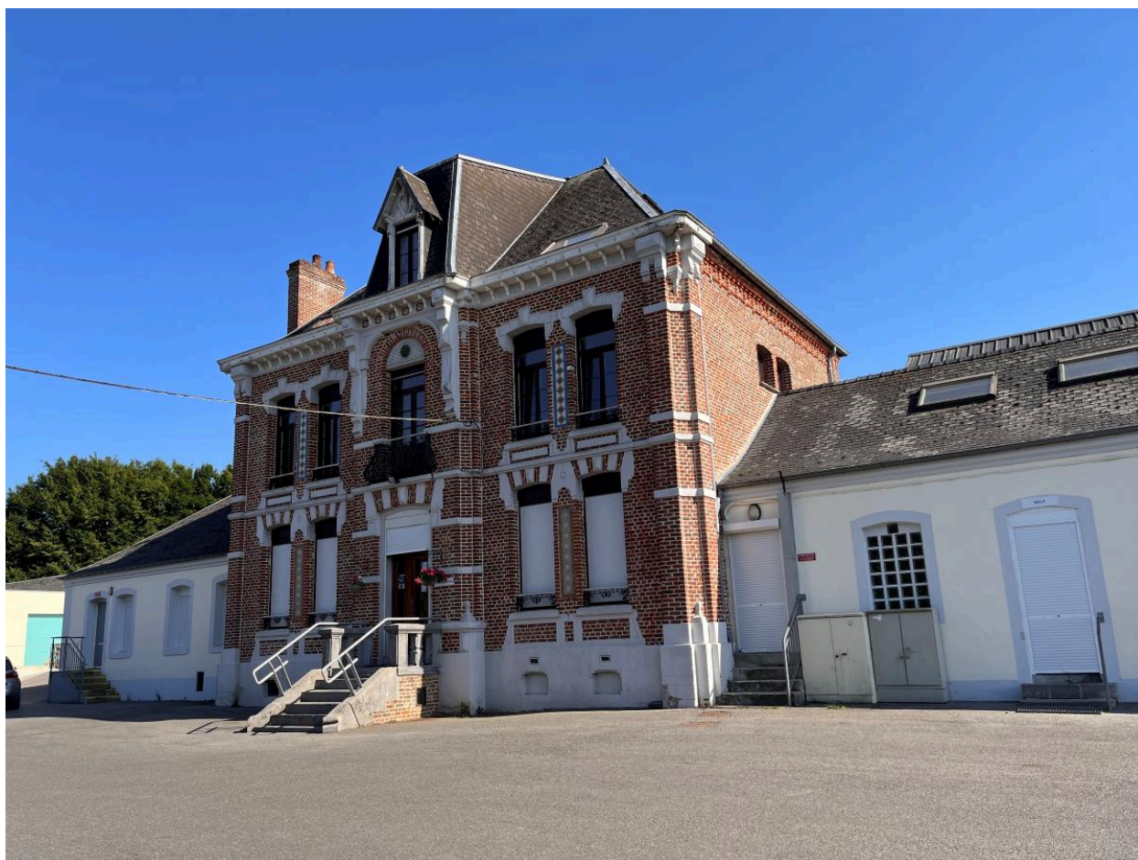
Le logement patronal, vue de trois-quarts.