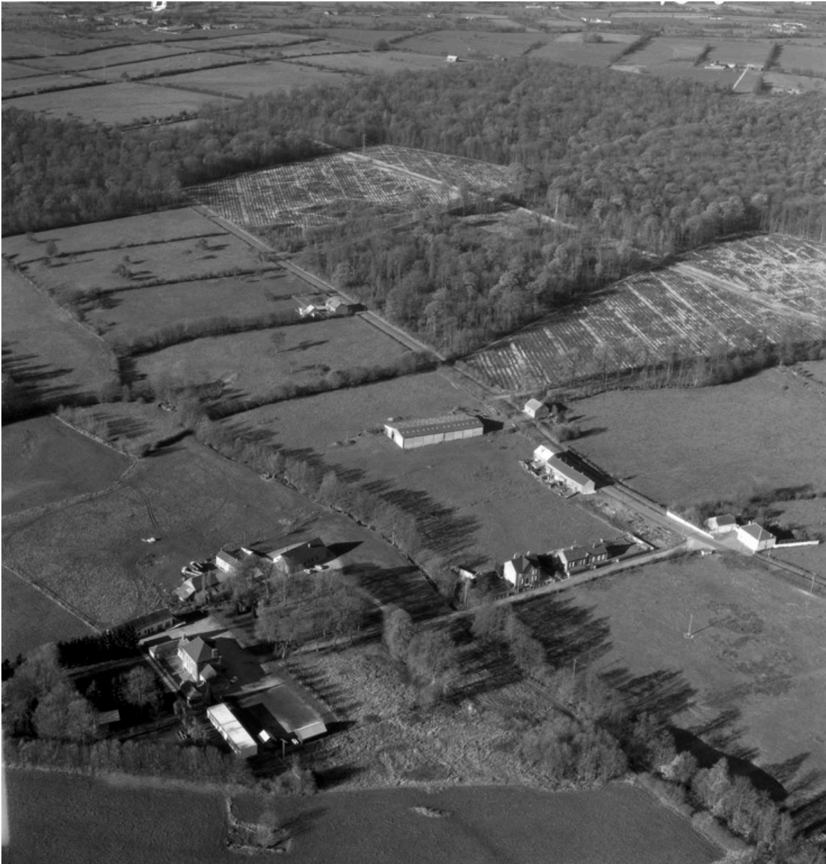
Vue aérienne du site vers le sud est en 1989.