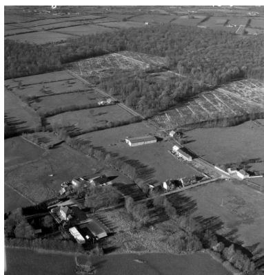
Vue aérienne du site vers le sud est en 1989.