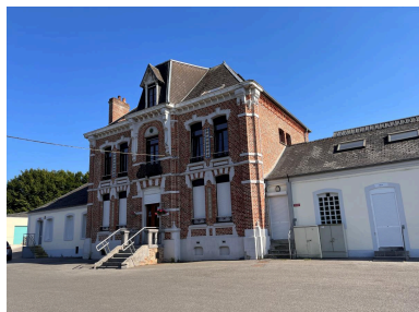
Le logement patronal, vue de trois-quarts.