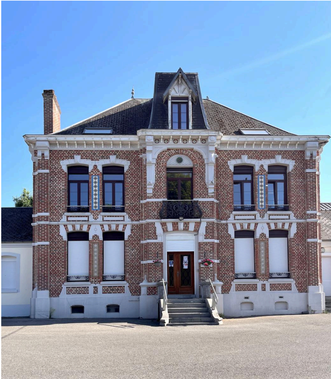
Façade sur cour du logement patronal, dit le château.