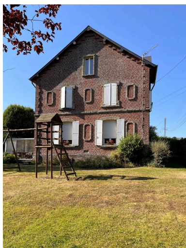
Logement de contremaître, vue du pignon depuis le jardin. IVR32_20220205094NUCA