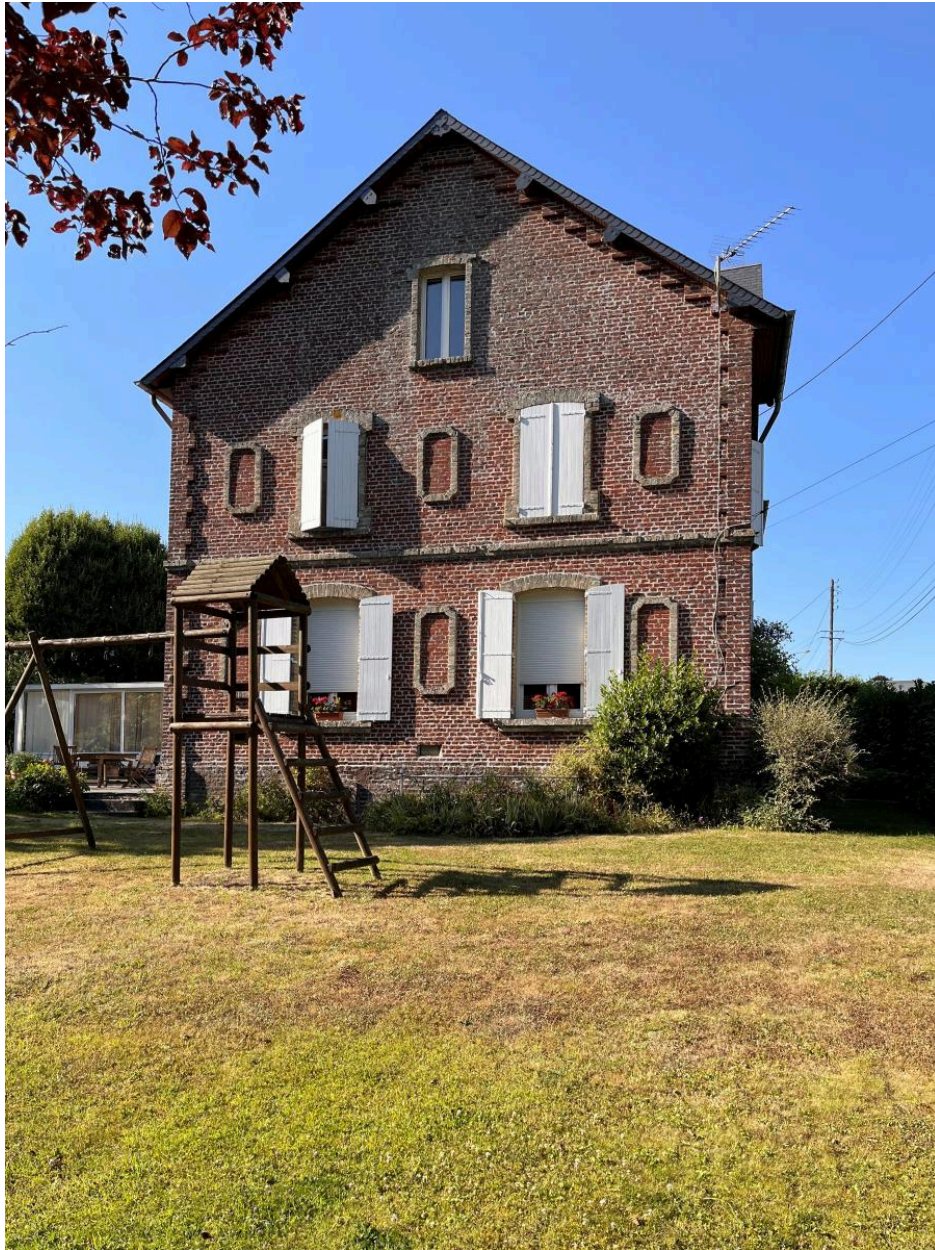
Logement de contremaître, vue du pignon depuis le jardin.