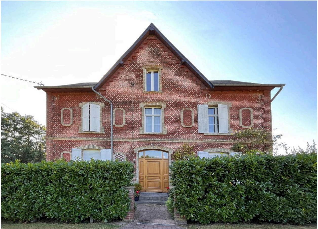
Façade sur rue de la maison de contremaître.