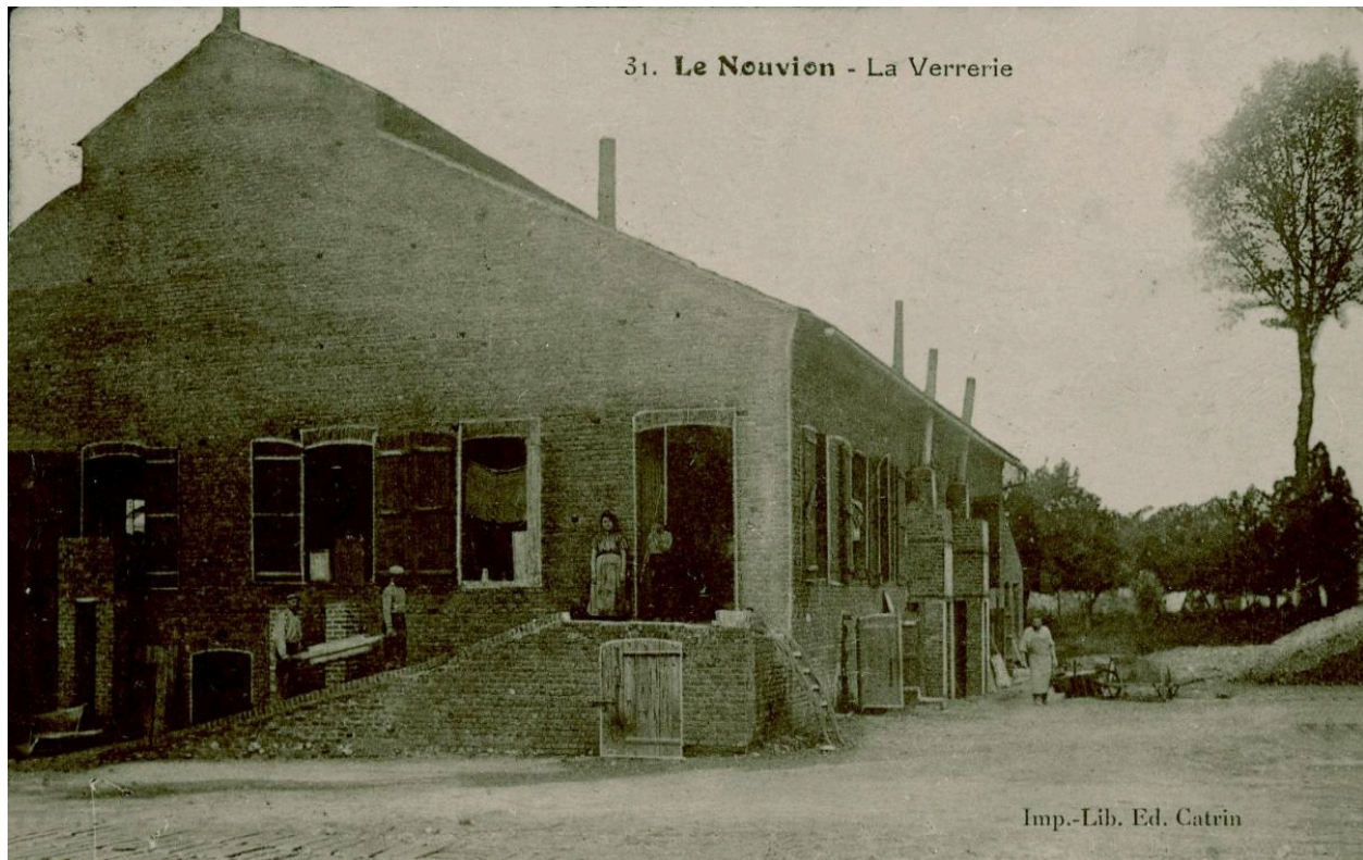
Le Nouvion. La verrerie [du Garmouzet]. Carte postale, S.d. (Fourmies, Écomusée de l'Avesnois ; PH 86.30.9.NR).