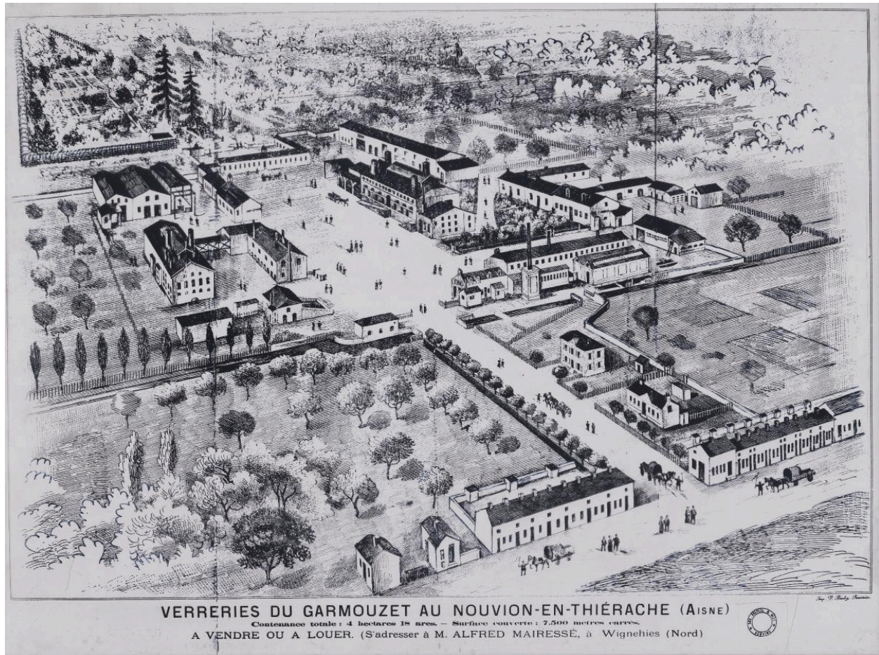
Vue cavalière de la verrerie du Garmouzet, 11 décembre 1891 (Fourmies, fonds de l'Écomusée).