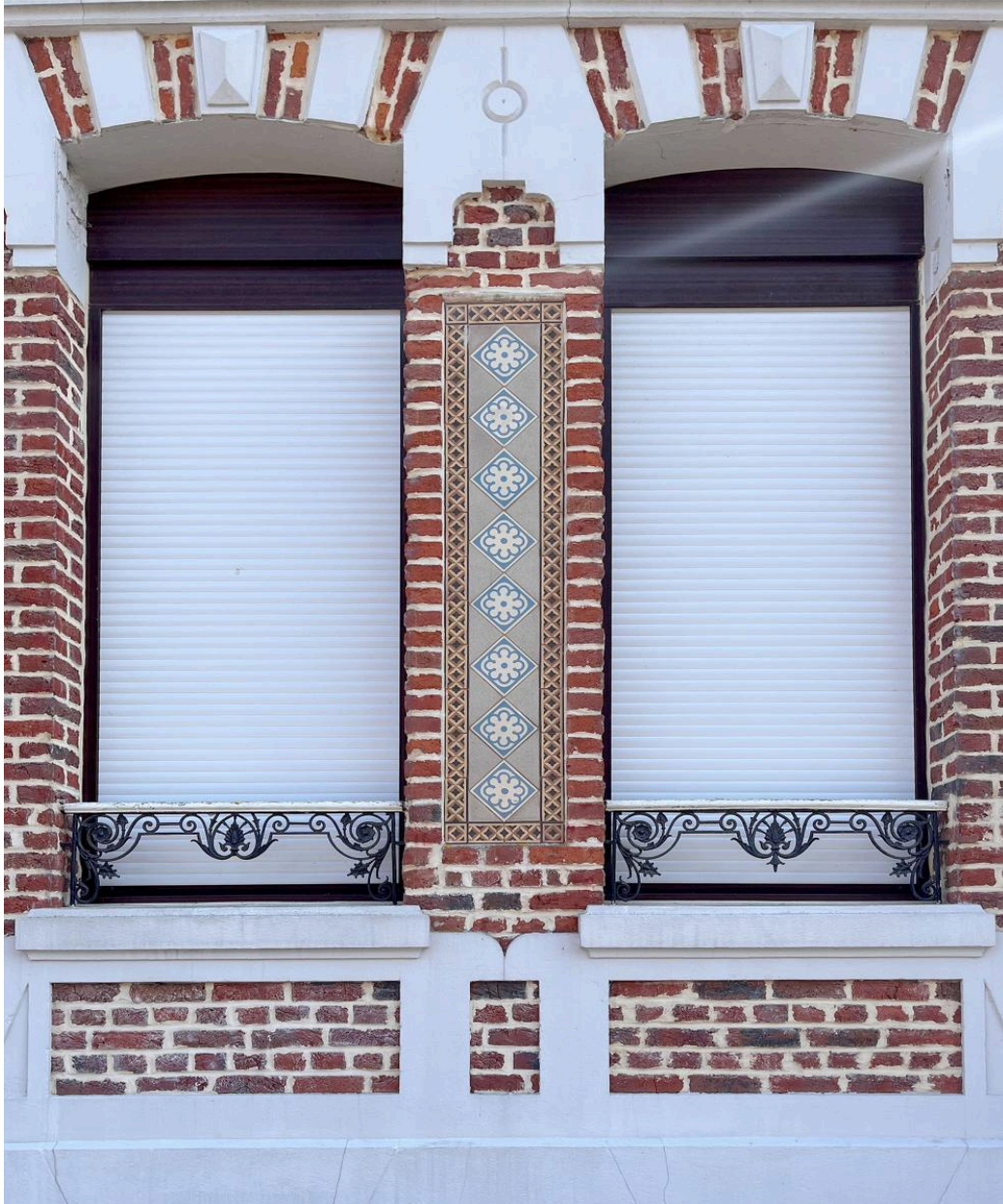
Détail de baies jumelles et du décor de céramique.