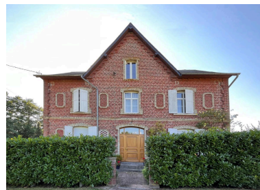
Façade sur rue de la maison de contremaître.

Phot. Bertrand Fournier IVR32_20220205089NUCA