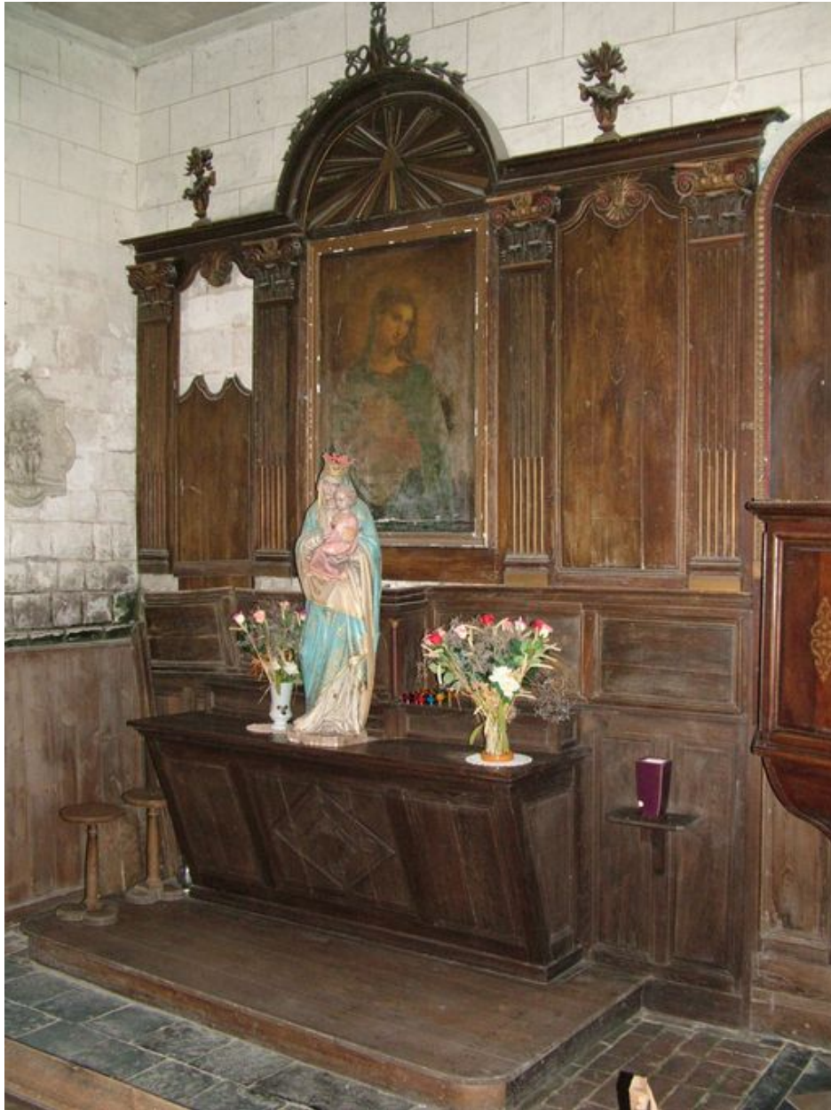
Bras nord du transept.