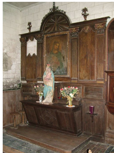
Bras nord du transept. IVR22_20098005355NUCA