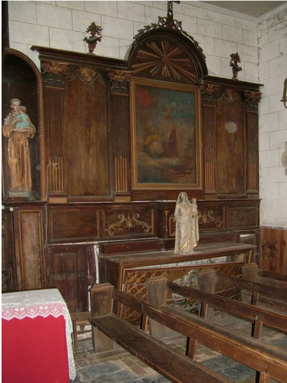
Bras sud du transept.