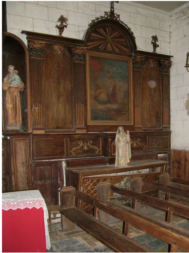
Bras sud du transept.