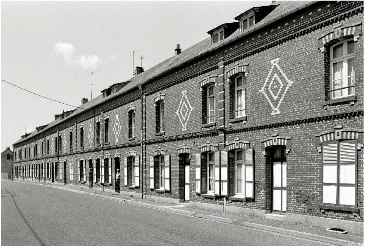
Vue générale de la cité ouvrière depuis la rue Emile-Zola, en 1990.