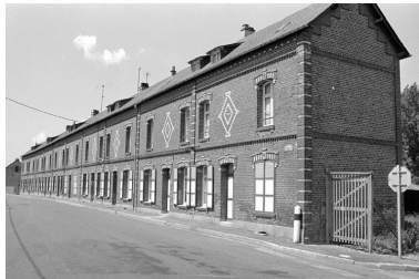
Vue générale de la cité ouvrière depuis la rue Emile-Zola, en 1990.