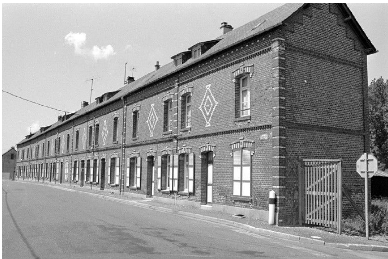
Vue générale de la cité ouvrière depuis la rue Emile-Zola, en 1990.