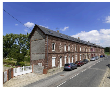
Vue de trois-quarts sud-est. IVR22_20158000584NUC2A