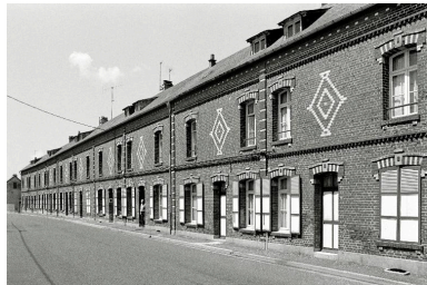
Vue générale de la cité ouvrière depuis la rue Emile-Zola, en 1990.