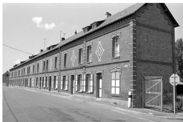
Vue générale de la cité ouvrière depuis la rue Emile-Zola, en 1990. IVR22_19908000378Z