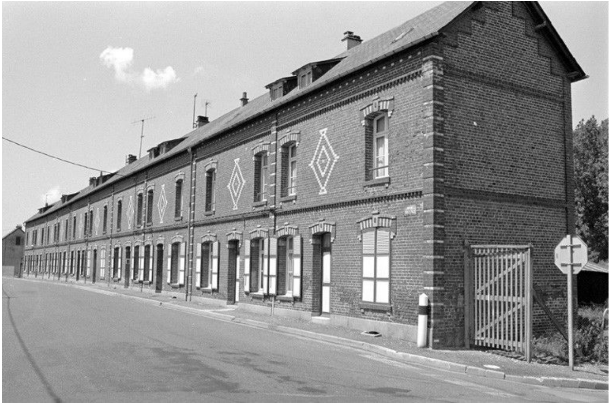
Vue générale de la cité ouvrière depuis la rue Emile-Zola, en 1990.