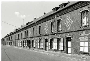
Vue générale de la cité ouvrière depuis la rue Emile-Zola, en 1990.