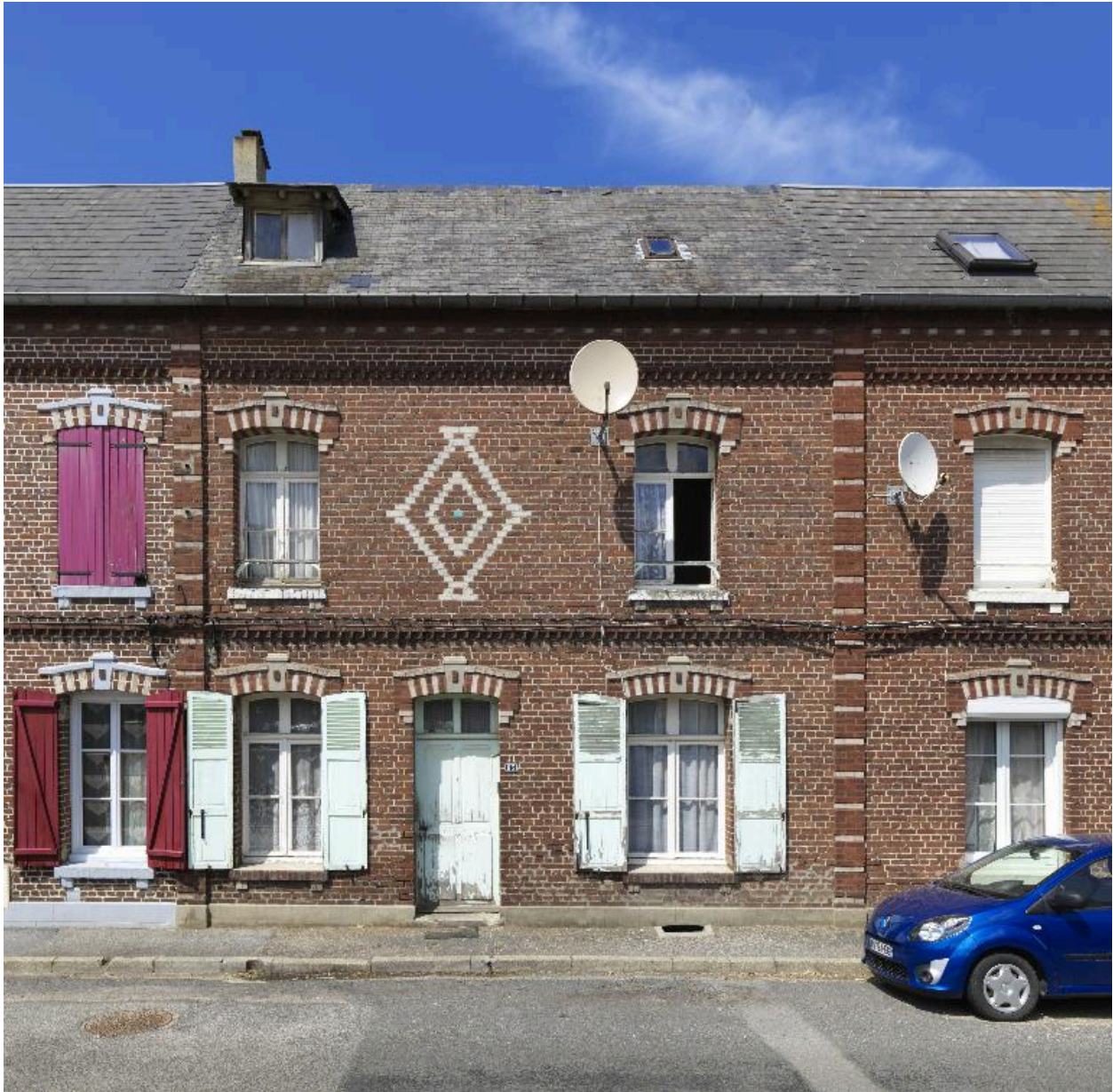
Détail du logement n° 63.