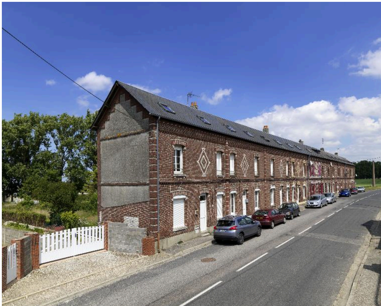
Vue de trois-quarts sud-est.