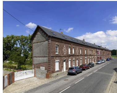
Vue de trois-quarts sud-est. IVR22_20158000584NUC2A