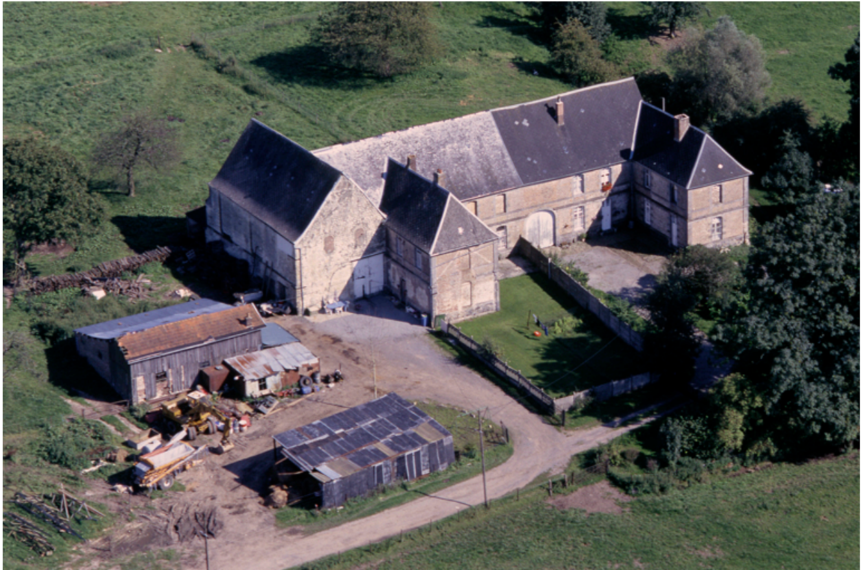
Vue aérienne nord-ouest des bâtiments subsistants de l'abbaye, aujourd'hui transformés en ferme.