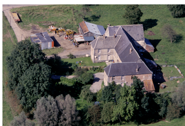
Vue aérienne sud-ouest des bâtiments subsistants de l'abbaye, aujourd'hui transformés en ferme.