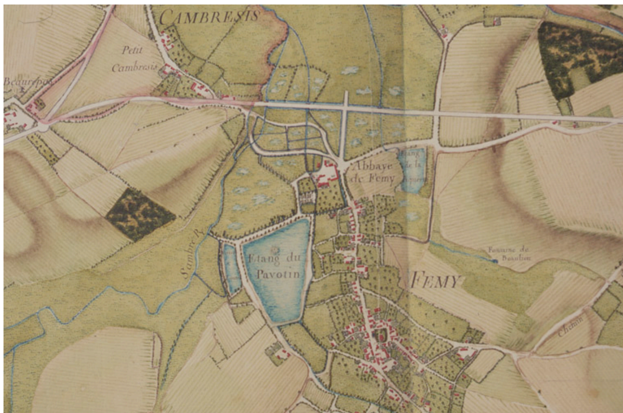
Plan de l'abbaye de Fémy et de ses alentours, Atlas Trudaine, [3e quart 18e siècle] (AN ; F14 8503).