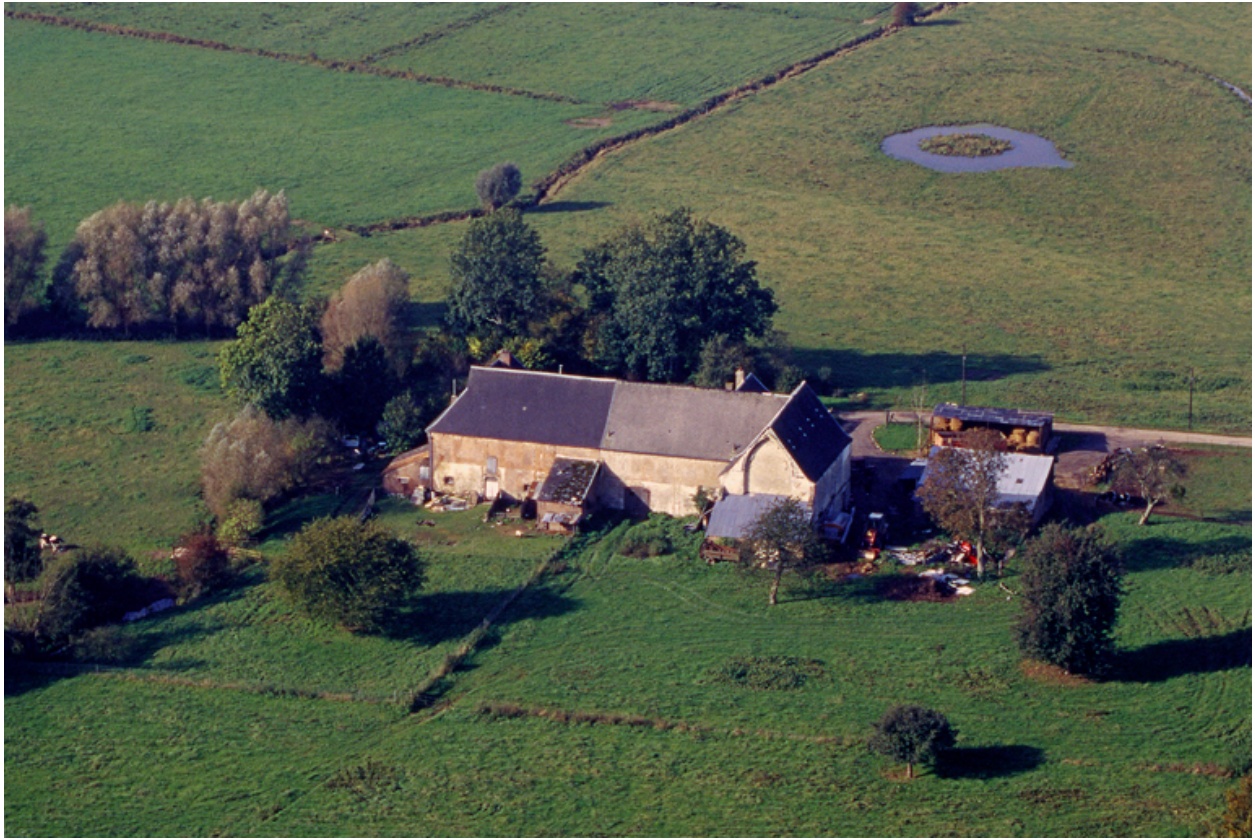
Vue aérienne nord-est des bâtiments subsistants de l'abbaye et du site.