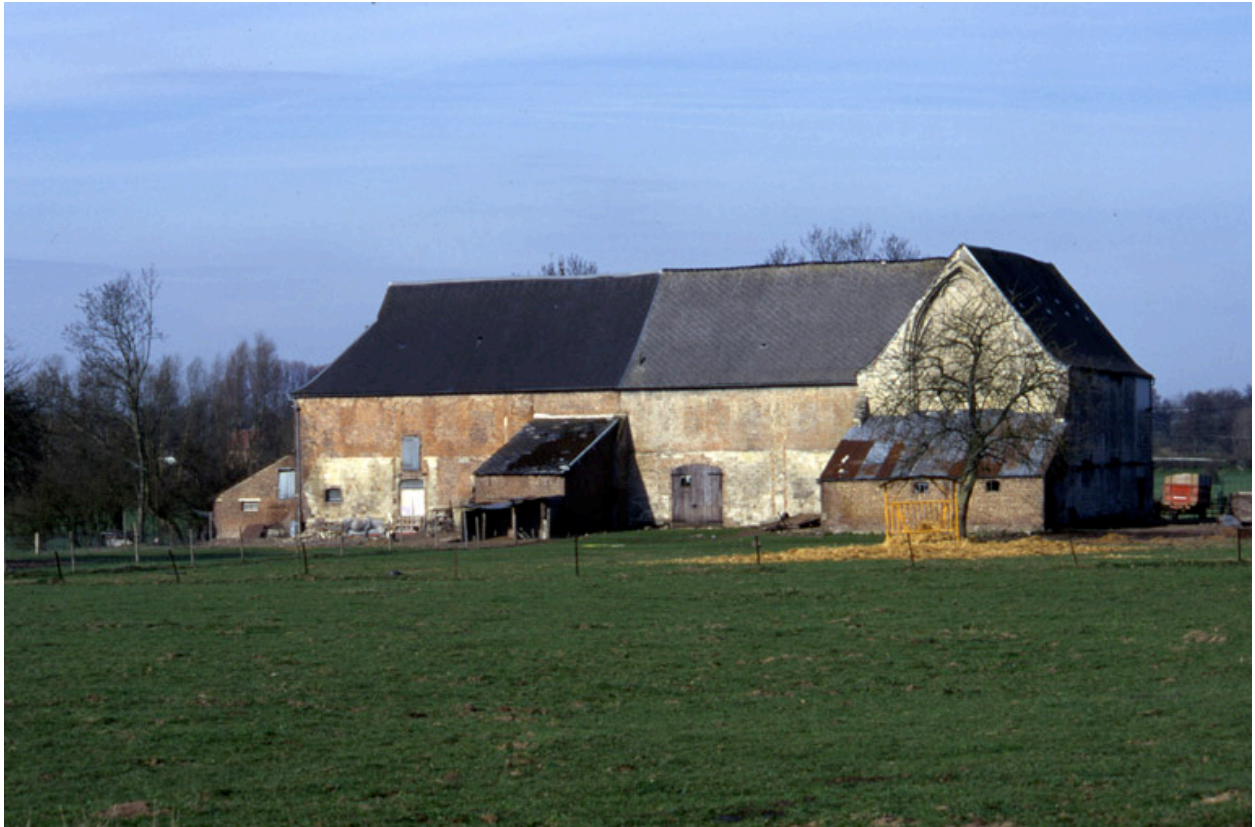
Vue générale, depuis l'est.