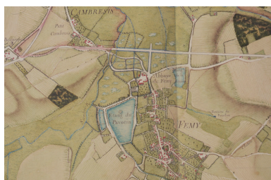
Plan de l'abbaye de Fémy et de ses alentours, Atlas Trudaine, [3e quart 18e siècle] (AN ; F14 8503).