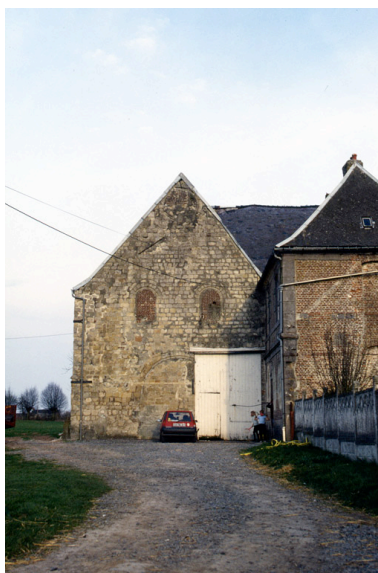
Vue de la façade de l'église abbatiale.