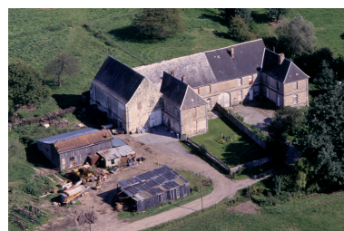
Vue aérienne nord-ouest des bâtiments subsistants de l'abbaye, aujourd'hui transformés en ferme. IVR22_20010200317XA