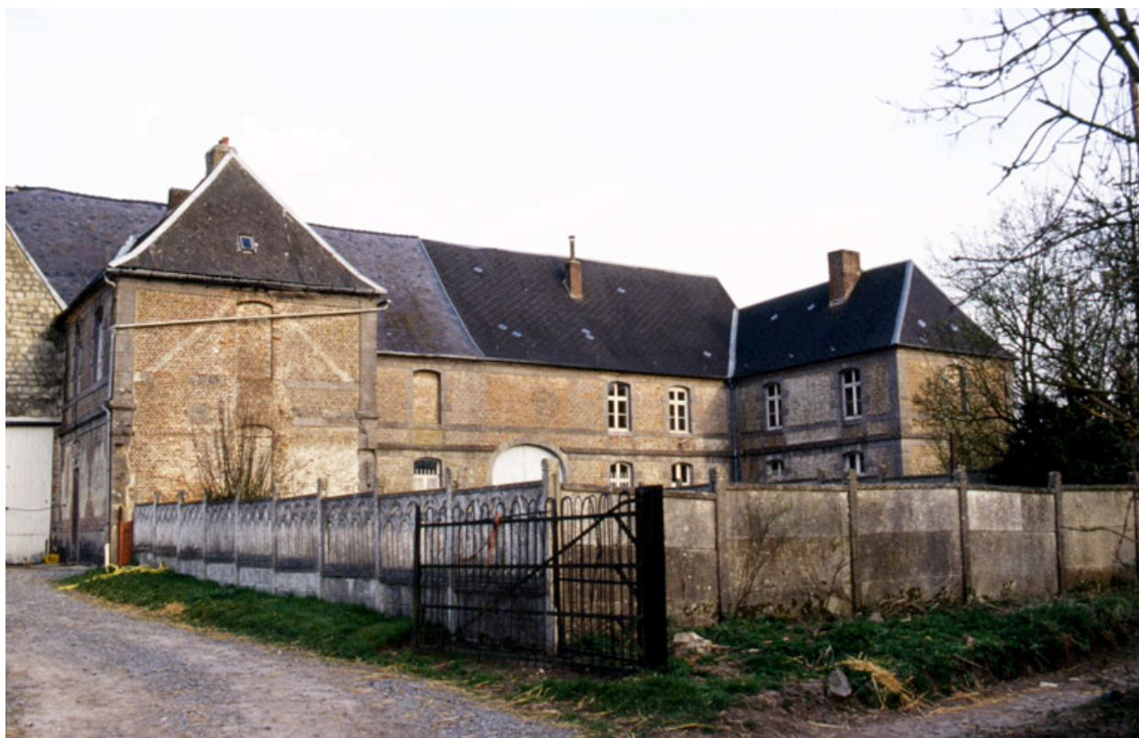
Vue de l'élévation ouest des bâtiments subsistants.