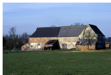
Vue générale, depuis l'est.