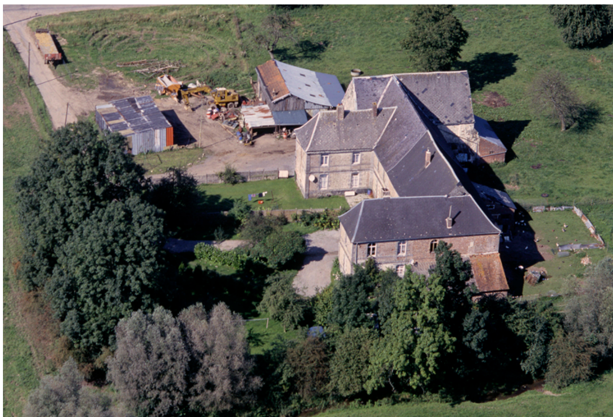
Vue aérienne sud-ouest des bâtiments subsistant de l'abbaye, aujourd'hui transformés en ferme.