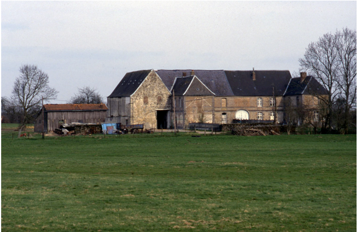
Vue générale, depuis l'ouest.