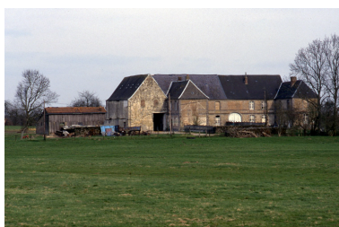
Vue générale, depuis l'ouest. IVR22_19960200473ZA