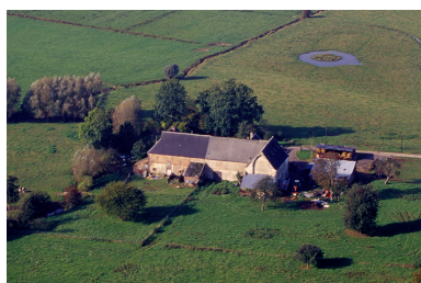
Vue aérienne nord-est des bâtiments subsistants de l'abbaye et du site.