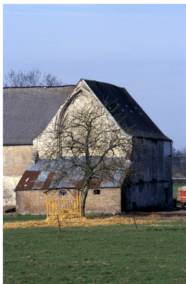
Eglise abbatiale, depuis l'est.