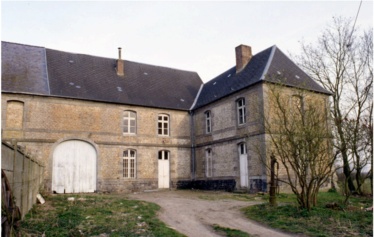
Vue partielle de l'élévation ouest des bâtiments subsistants.