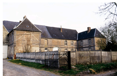
Vue de l'élévation ouest des bâtiments subsistants.