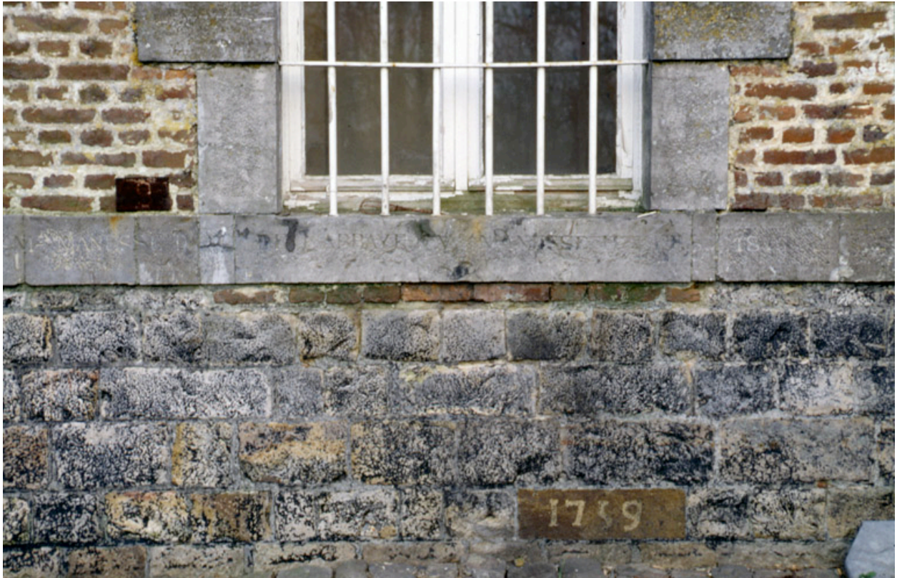
Détail de l'élévation ouest de la partie subsistante des bâtiments abbaciaux, montrant une pierre datée de 1759.