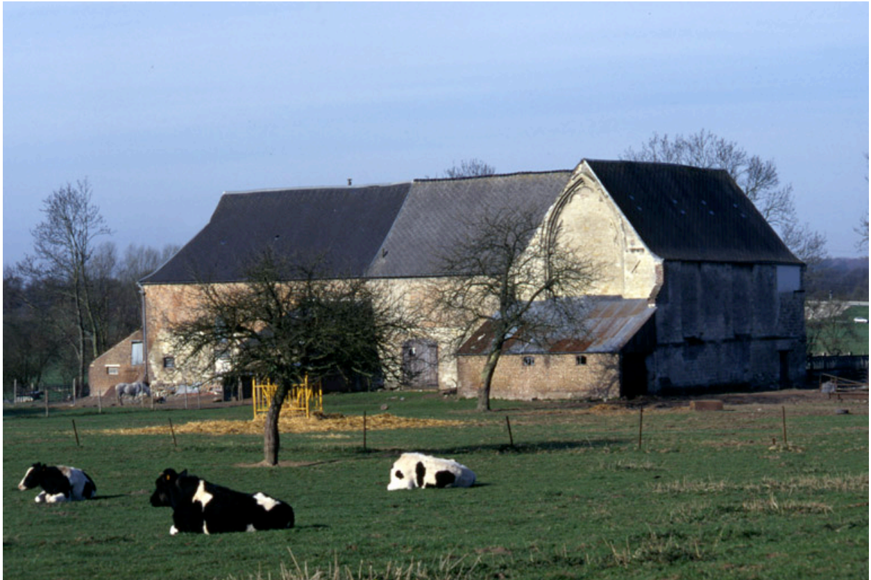
Vue générale, depuis le nord-est.