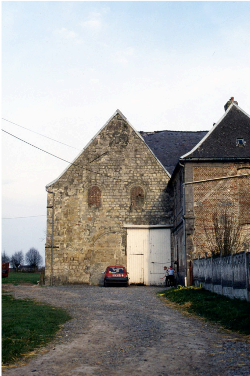
Vue de la façade de l'église abbatiale.