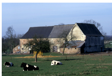
Vue générale, depuis le nord-est.