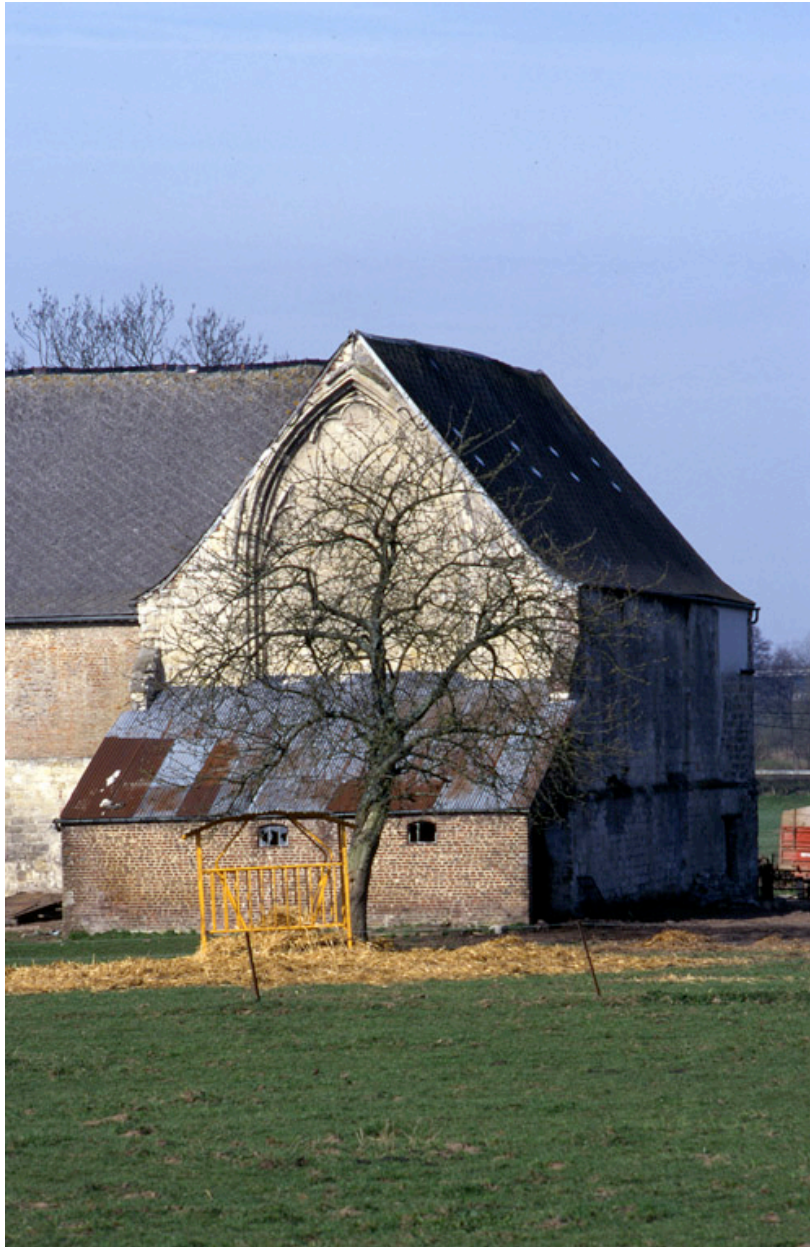
Eglise abbatiale, depuis l'est.