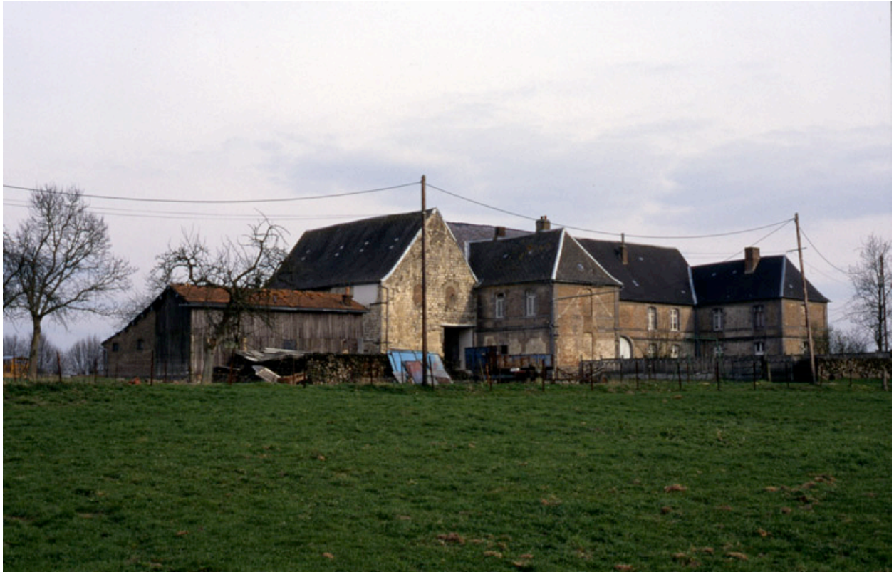
Vue générale, depuis le nord-ouest.