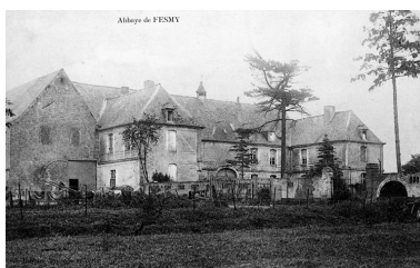
Vue générale depuis le nord-ouest, sur carte postale ancienne (coll. part.). IVR22_19930200370XB