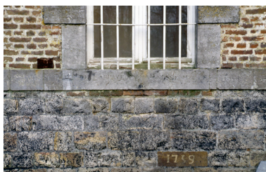
Détail de l'élévation ouest de la partie subsistante des bâtiments abbaciaux, montrant une pierre datée de 1759. IVR22_19930201336ZA