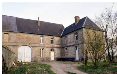
Vue partielle de l'élévation ouest des bâtiments subsistants.