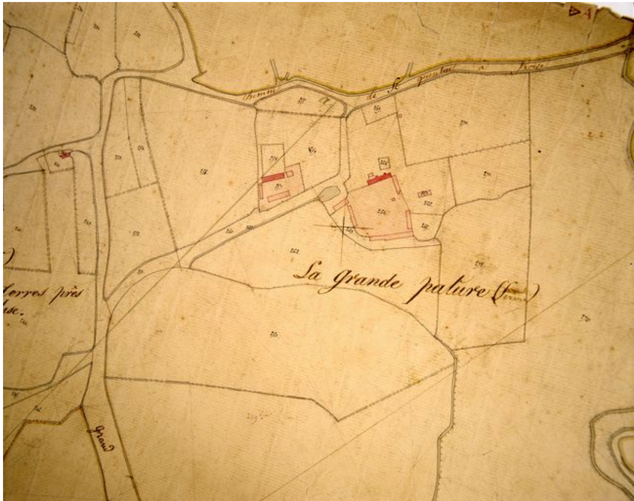
Extrait du cadastre napoléonien présentant le plan de la ferme en 1826.