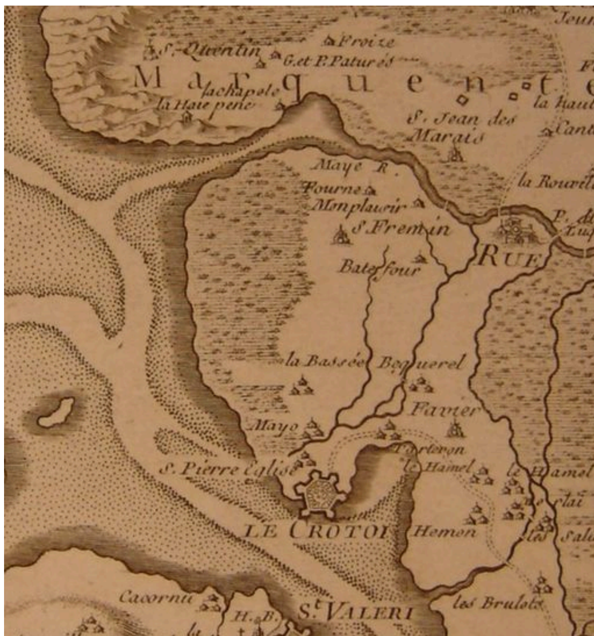
Carte de la baie de Somme en 1744 présentant le territoire.