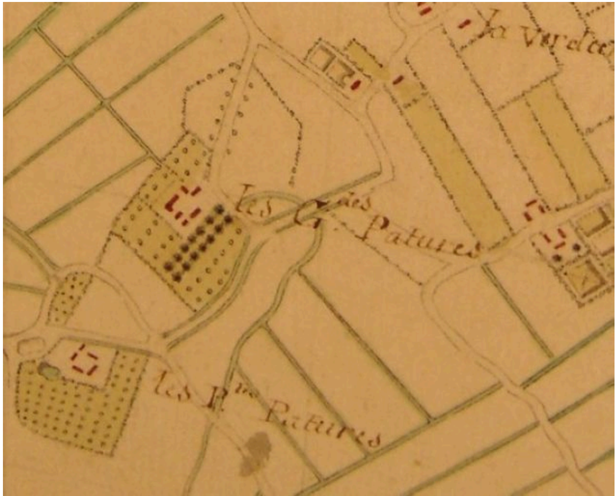
Plan de la ferme extrait d'une carte du 18e siècle.