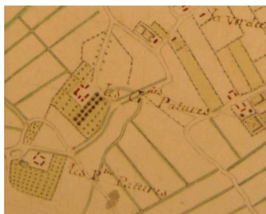
Plan de la ferme extrait d'une carte du 18e siècle.