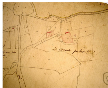
Extrait du cadastre napoléonien présentant le plan de la ferme en 1826.