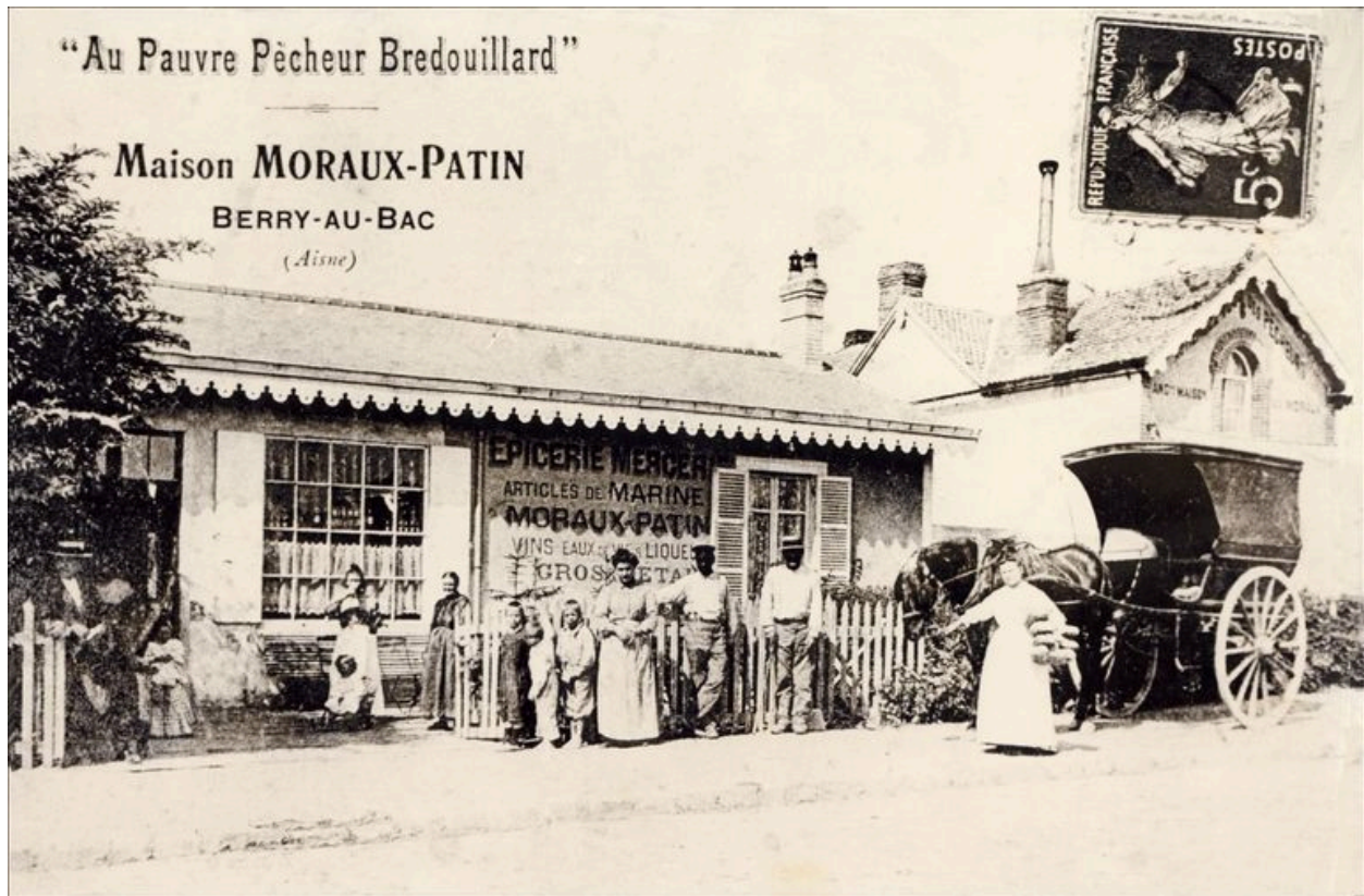
Maison Moreaux-Patin. Carte postale, début 20e siècle (coll. part.).