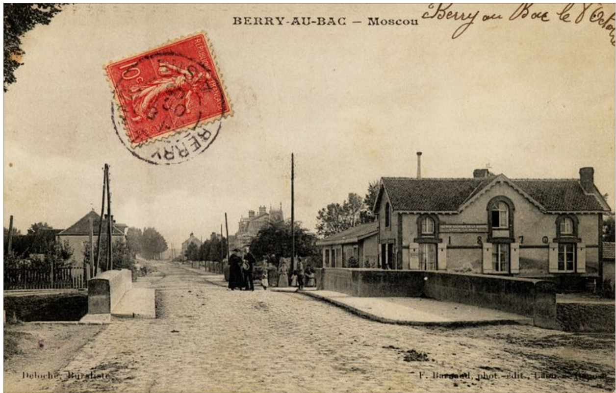
Berry-au-Bac. Moscou. Carte postale, début 20e siècle (coll. part.).