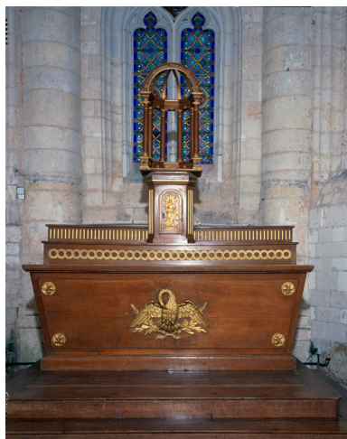
Vue générale du maître-autel et son tabernacle.