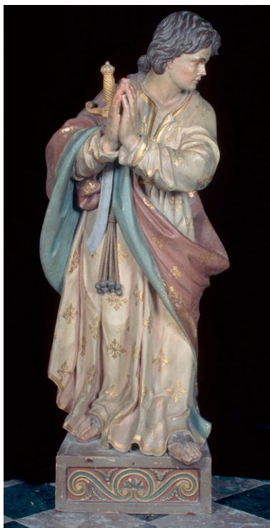
Vue antérieure de l'une des deux statues.