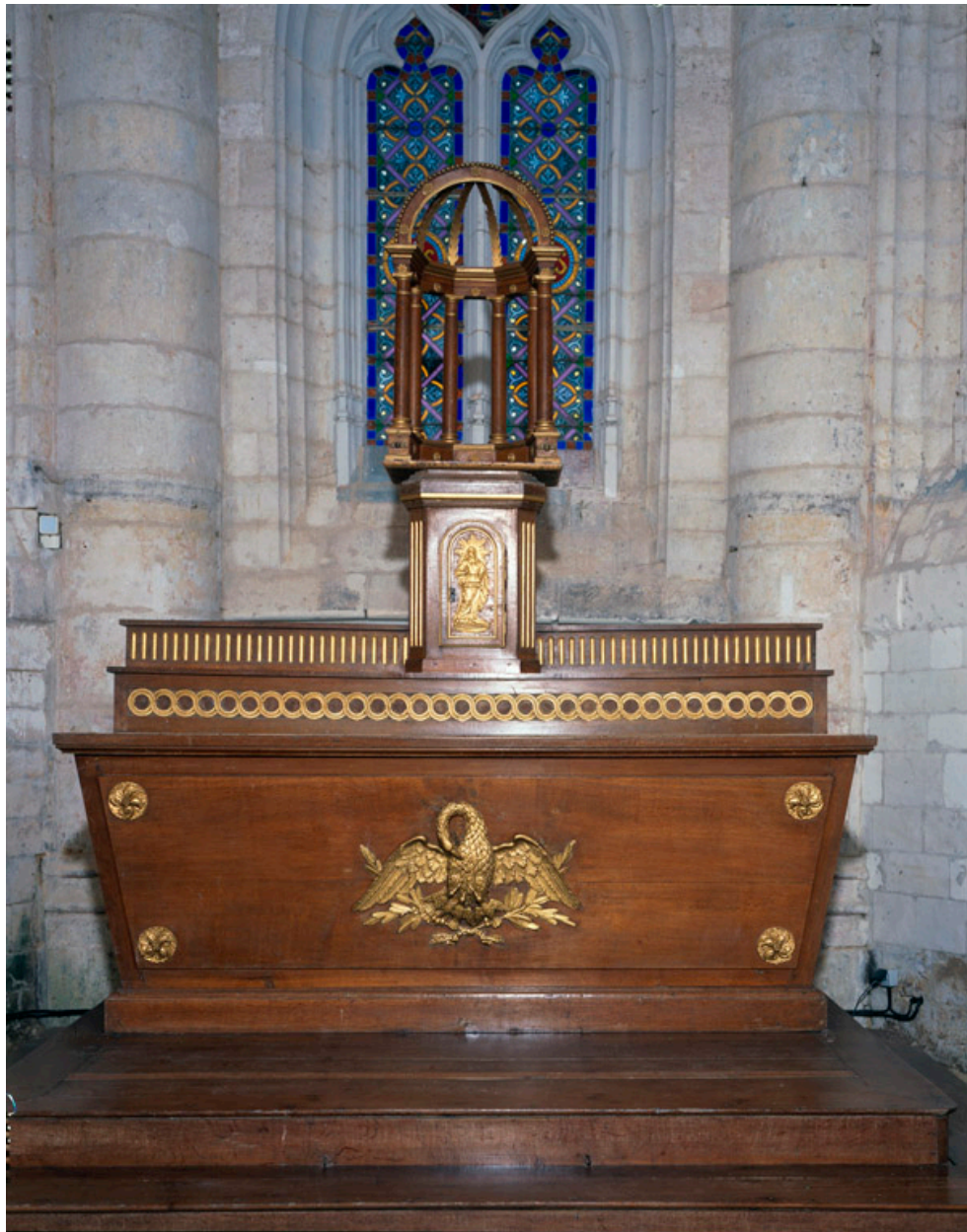
Vue générale du maître-autel et son tabernacle.