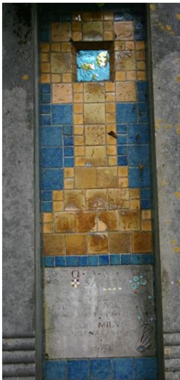
Détail du décor en mosaïques.