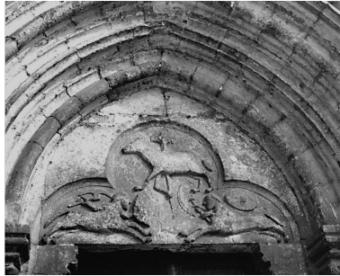
Vue du tympan.