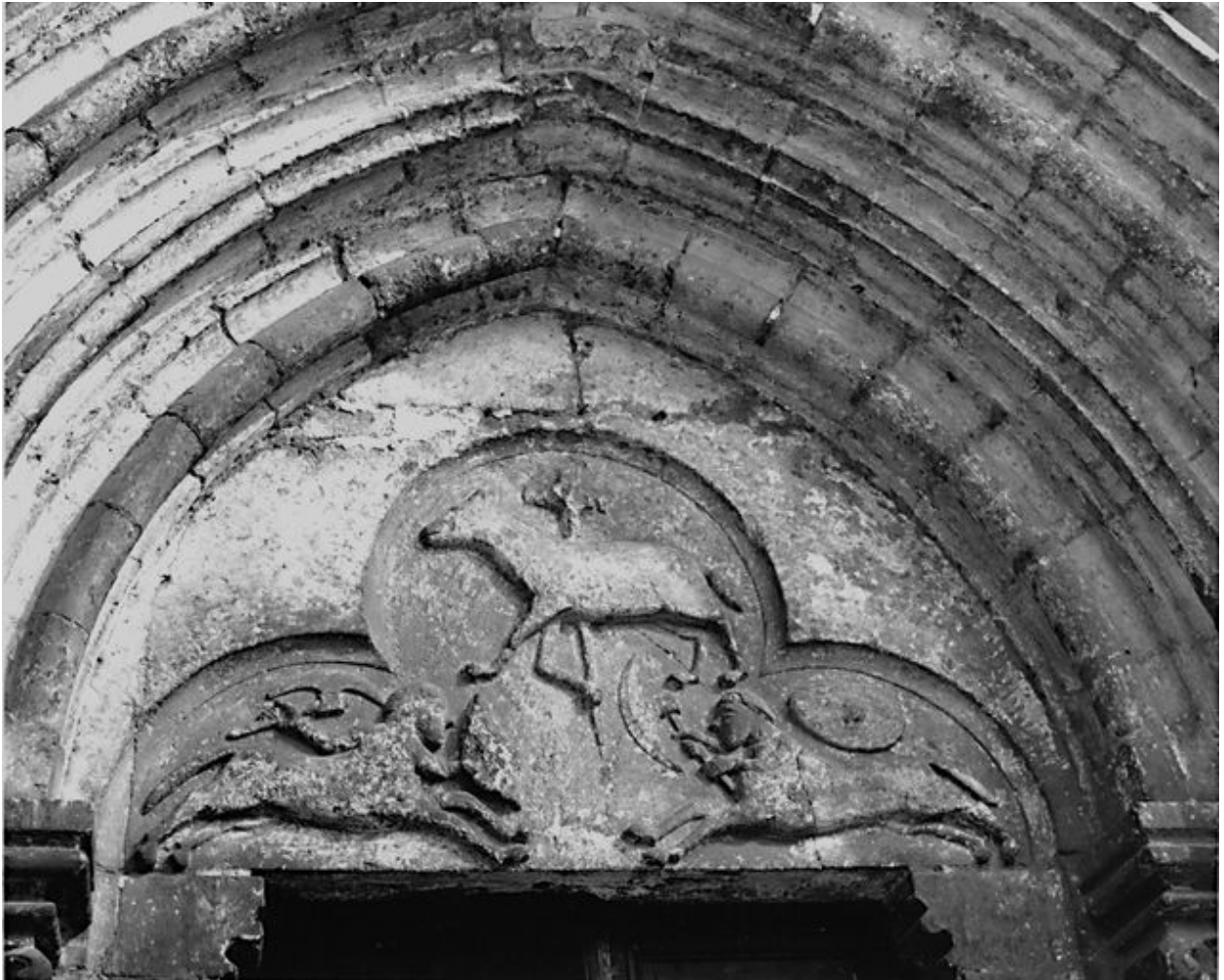
Vue du tympan.