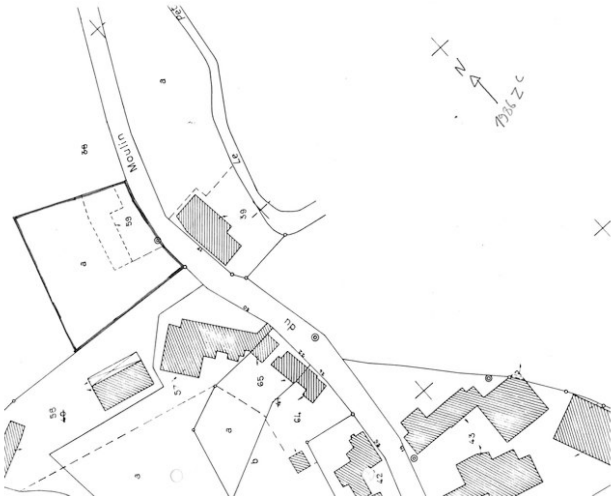
Plan de situation. Extrait du plan cadastral de 1986, section ZC.