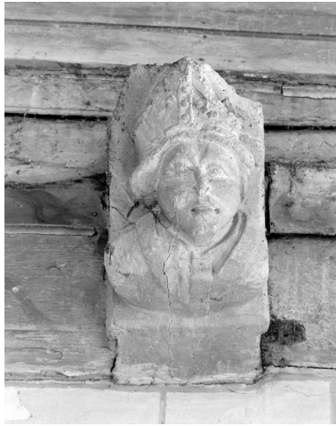
Blochetsculpté, 2e travée sud : buste d'évêque.