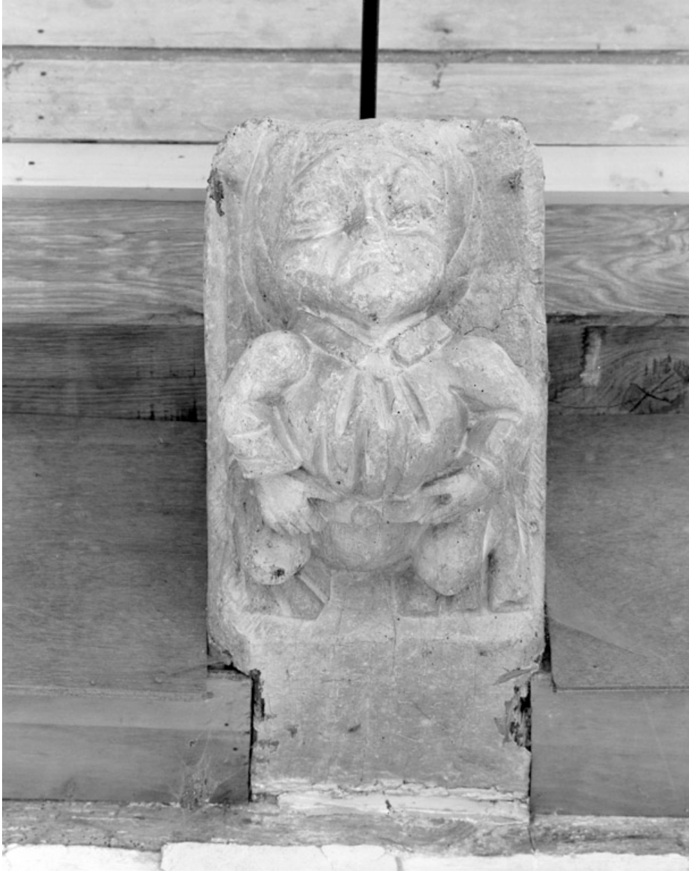
Blochets sculptés, 1ère travée sud : homme se tenant la ceinture.