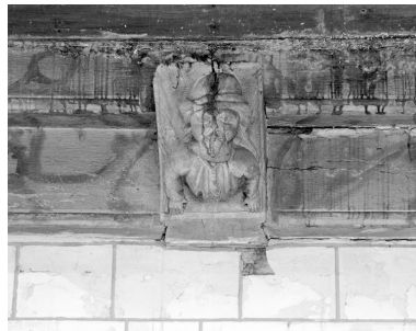
Blochets sculptés, 3e travée nord : buste d'homme. IVR22_20008000566X