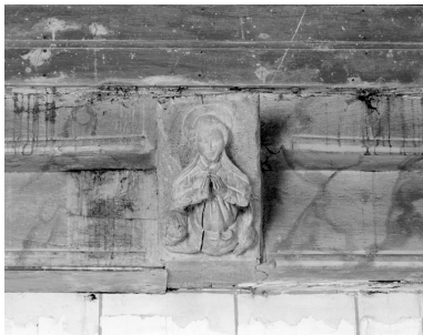
Blochets sculptés, 2e travée nord : sainte Marguerite. IVR22_20008000565X