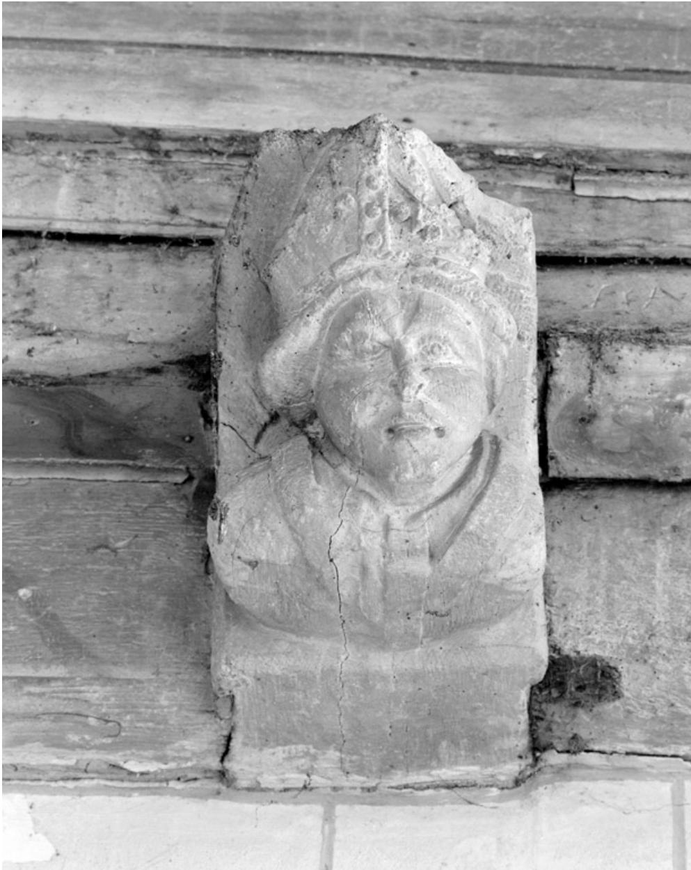
Blochets sculptés, 2e travée sud : buste d'évêque.