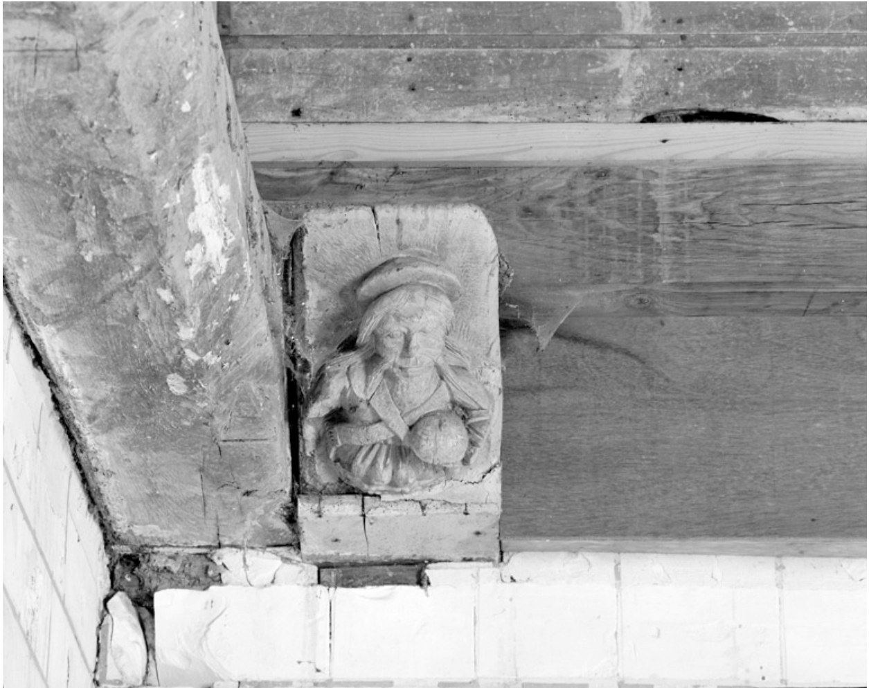
Blochets sculptés, 1ère travée nord : Dieu le Père tenant le globe.