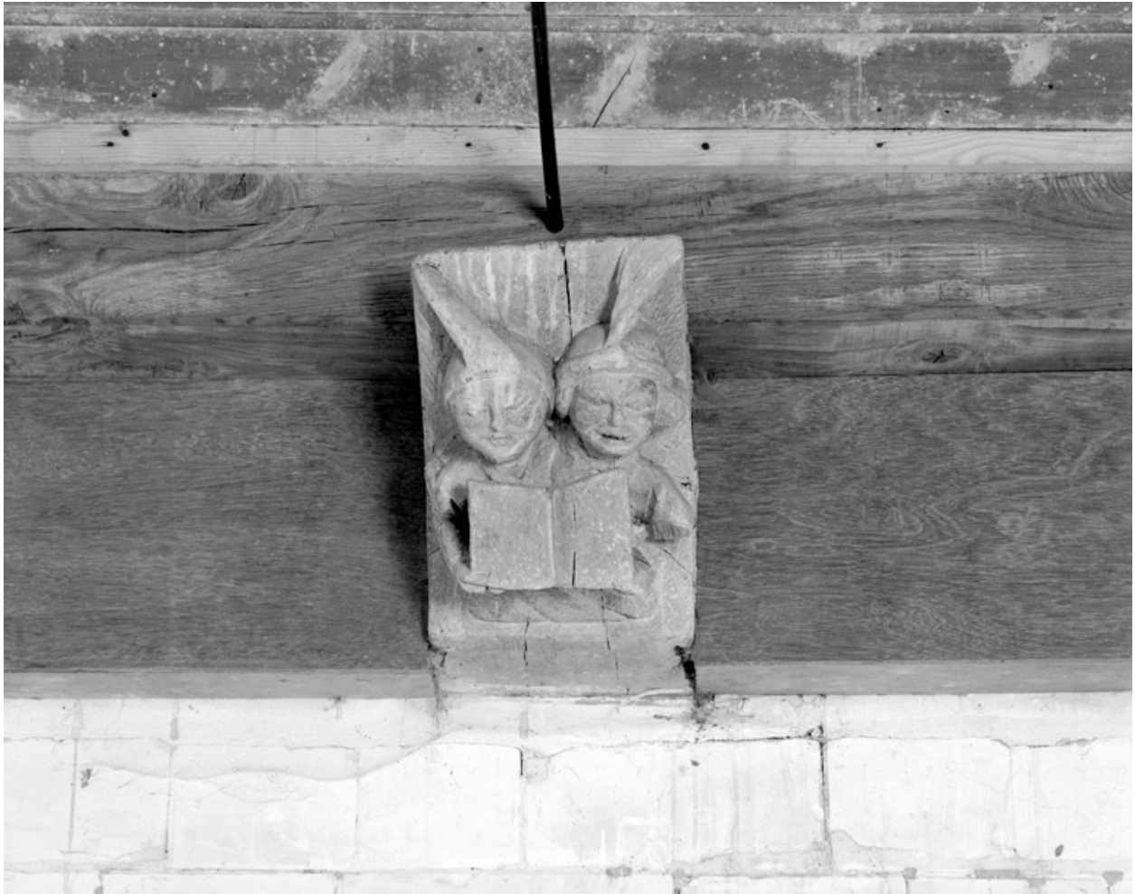
Blochets sculptés, 1ère travée nord : deux personnages tenant un livre.