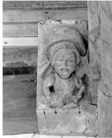
Blochetsculpté, 1ère travée sud : personnage avec chapeau. IVR22_20008000569X