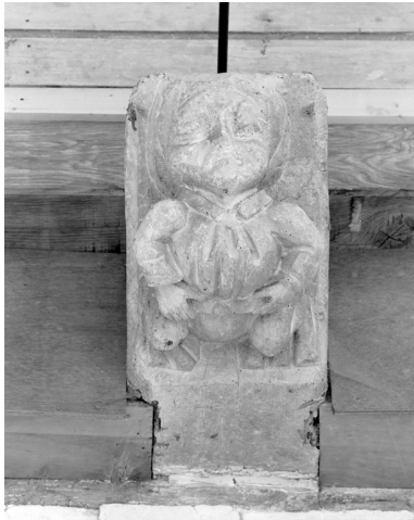
Blochetsculpté, 1ère travée sud : homme se tenant la ceinture.