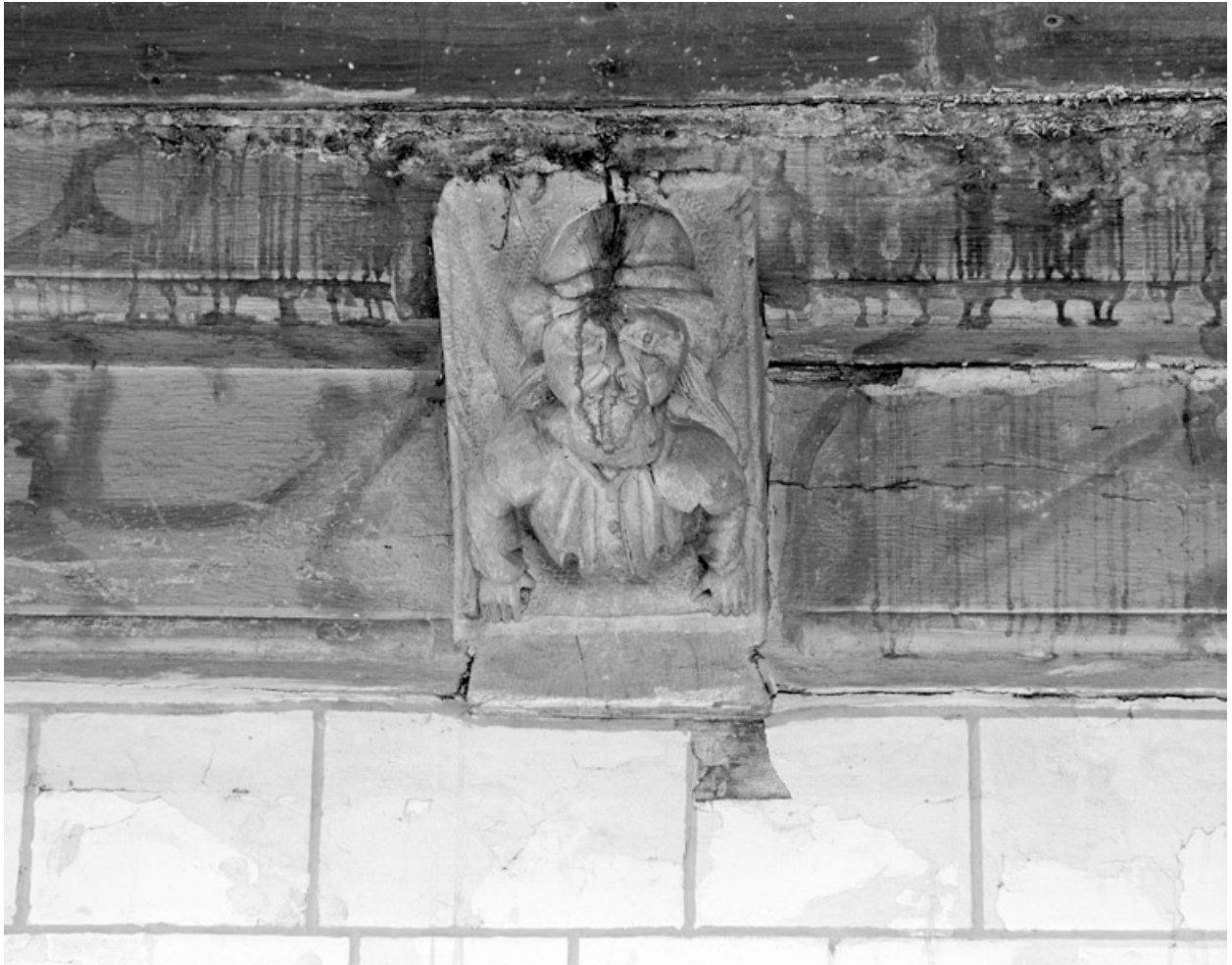
Blochets sculptés, 3e travée nord : buste d'homme.