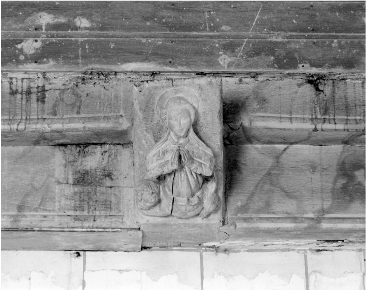
Blochets sculptés, 2e travée nord : sainte Marguerite.