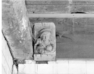
Blochets sculptés, 1ère travée nord : Dieu le Père tenant le globe.