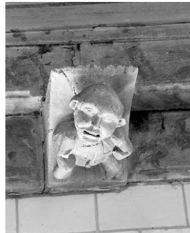
Blochets sculptés, 3e travée sud : buste grimaçant.