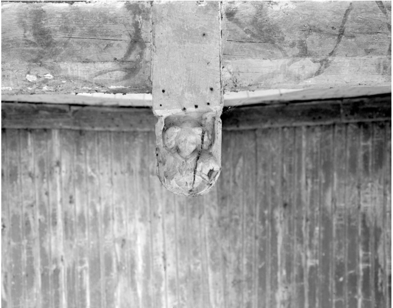
Poinçon sculpté au centre de la première ferme : ange tenant un objet rond (couronne d'épines ?).