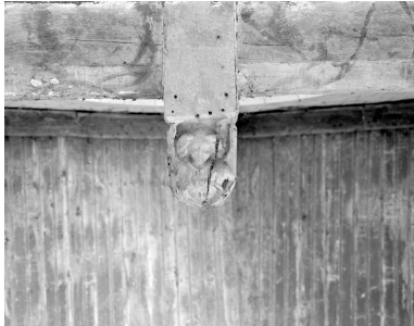
Poinçon sculpté au centre de la première ferme : ange tenant un objet rond (couronne d'épines ?). IVR22_20008000568X