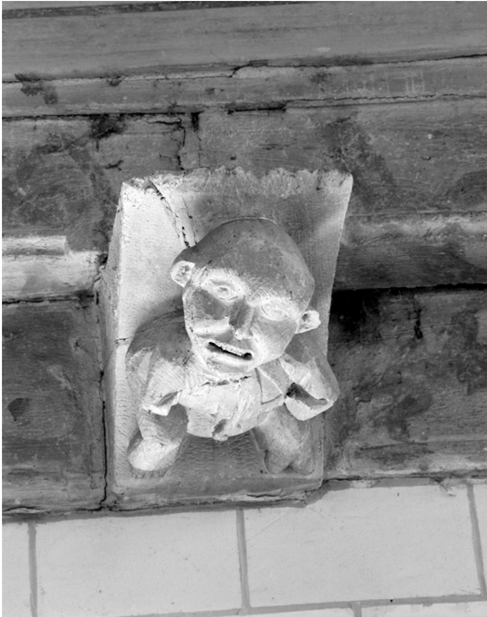
Blochets sculptés, 3e travée sud : buste grimaçant.