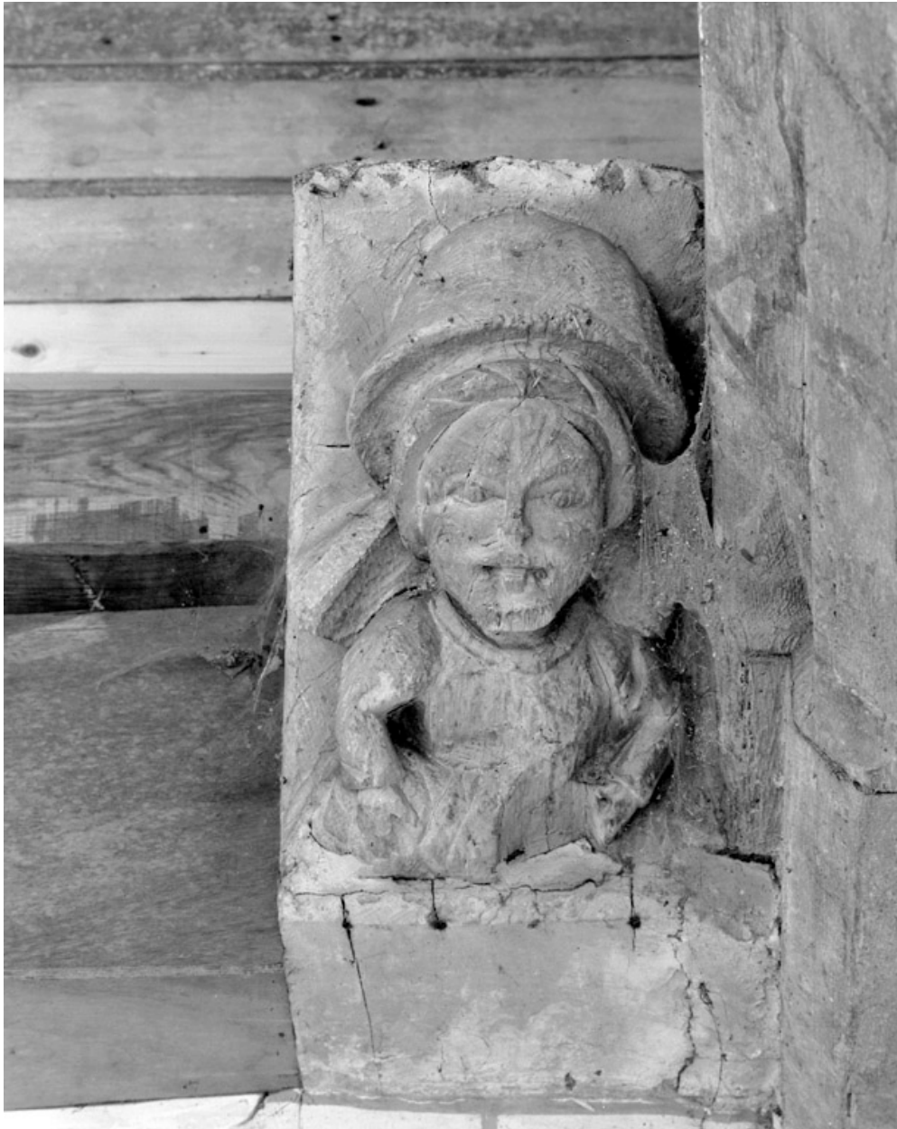
Blochets sculptés, 1ère travée sud : personnage avec chapeau.