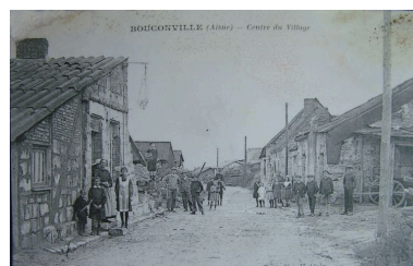
Vue du village en reconstruction.