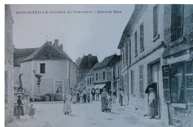
Vue ancienne de la Grande Rue (coll. part). IVR22_20050200694NUCAB