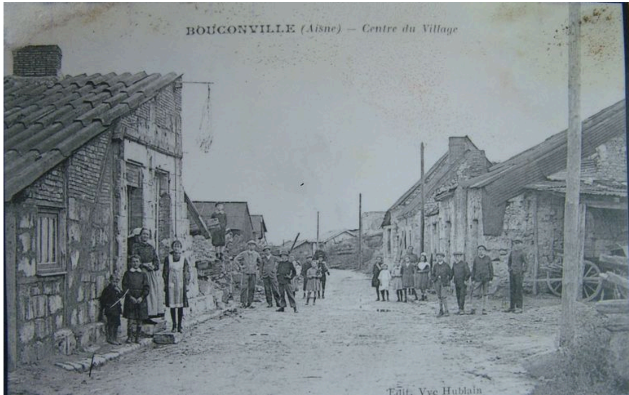
Vue du village en reconstruction (coll. part).