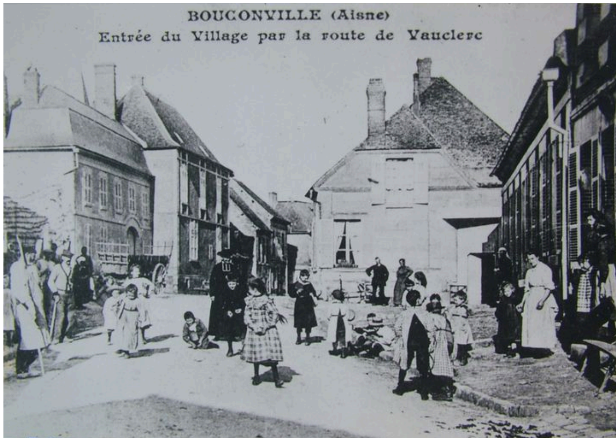
Vue ancienne d'une rue du village (coll. part).