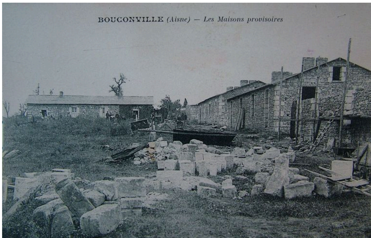
Vue de maisons semi-provisoires.