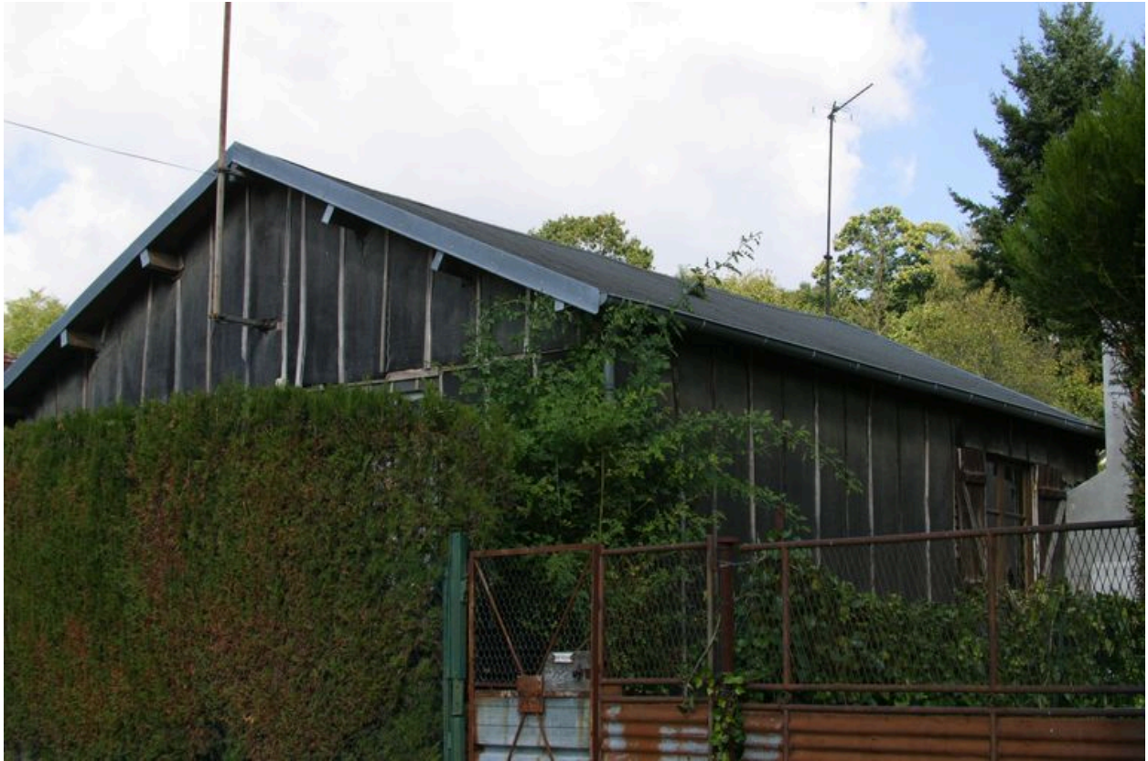
Vue d'une maison provisoire encore in situ.