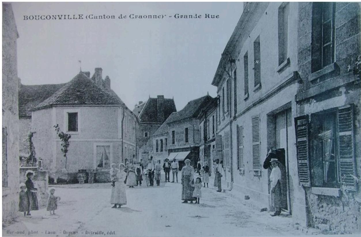
Vue ancienne de la Grande Rue.