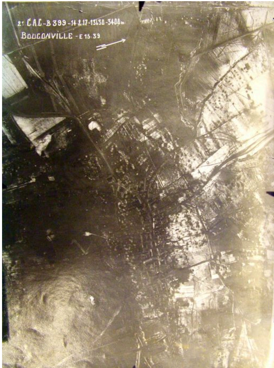
Vue aérienne du village pendant les conflits (AD Aisne : 24 Fi Bouconville Vauclair 1).