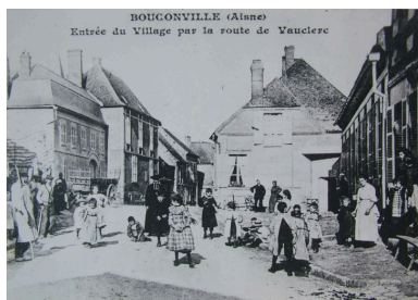
Vue ancienne d'une rue du village (coll. part). IVR22_20030203038NUCAB