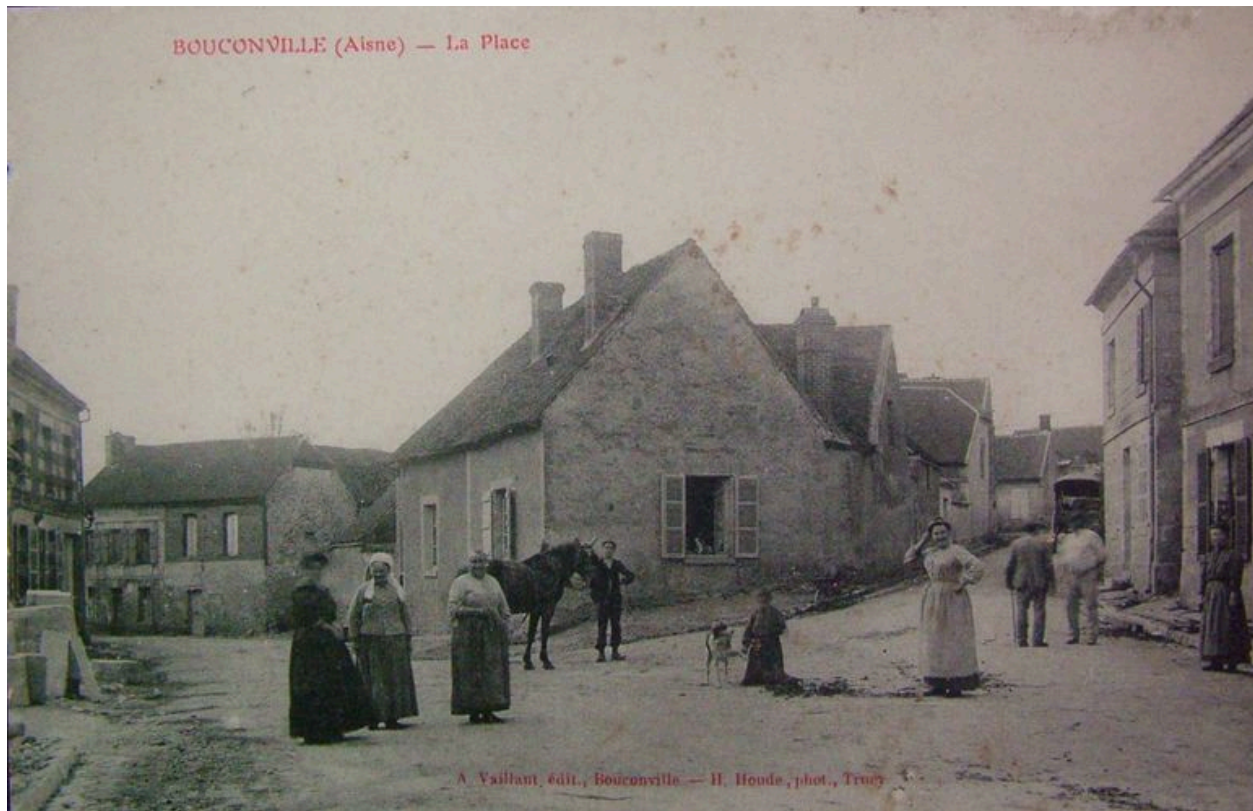
Vue ancienne de la place du village (coll. part).