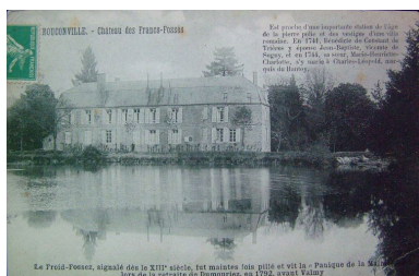
Vue du château des Francs- Fossés avant la guerre (coll. part). IVR22_20050200438NUCAB