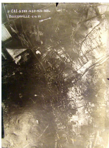
Vue aérienne du village pendant les conflits.