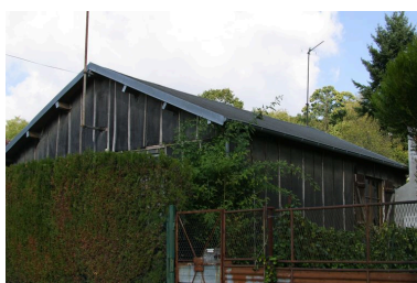
Vue d'une maison provisoire encore in situ.