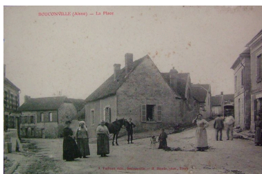
Vue ancienne de la place du village (coll. part). IVR22_20050200447NUCAB