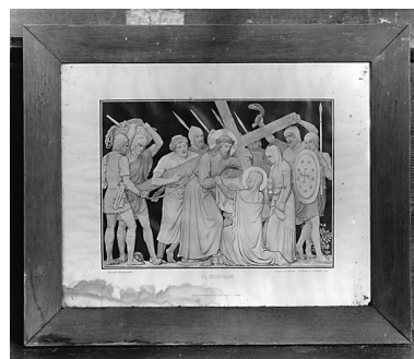
Station 6. IVR22_19990201919X