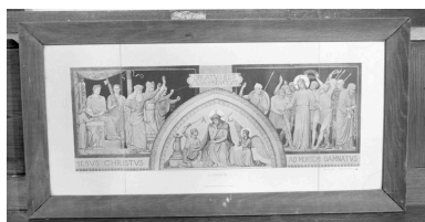
Station 1.