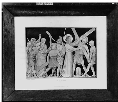
Station 2. IVR22_19990201739X