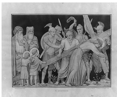
Station 5. IVR22_19990201741X