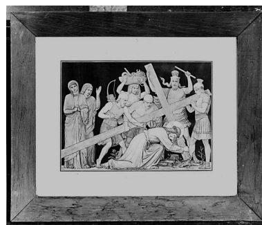
Station 3. IVR22_19990201742X