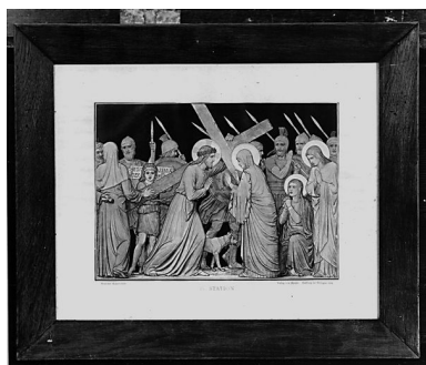
Station 4. IVR22_19990201740X