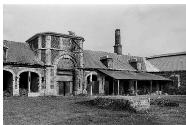
Brasserie, flanc sud. IVR22_19918000150X