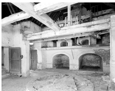
Ecuries et brasserie, vue intérieure.