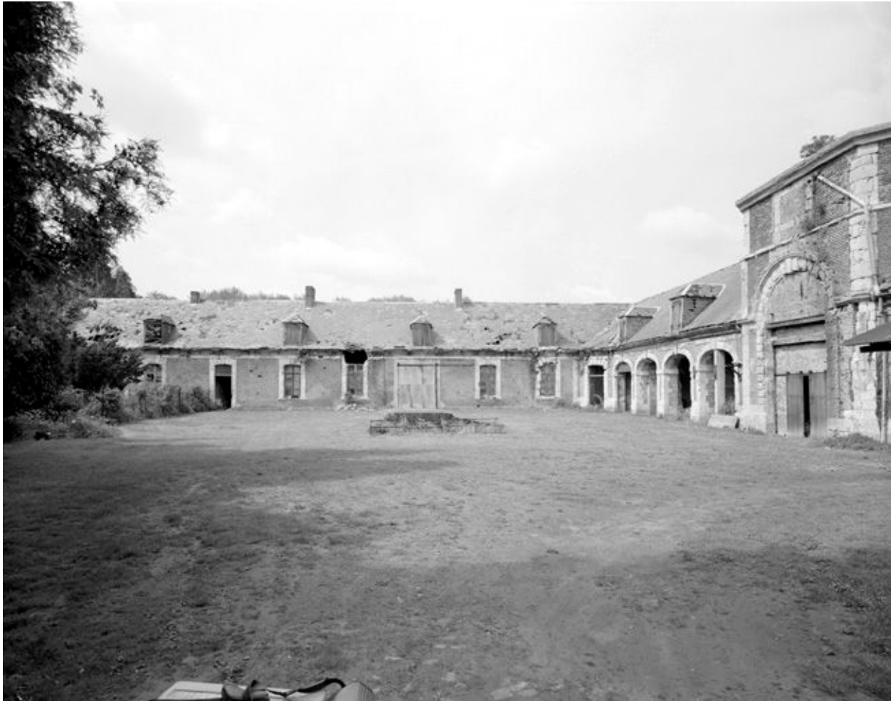
Ecuries et cour intérieure, vue générale.