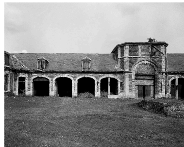
Ecuries, flanc sud. IVR22_19918000157V