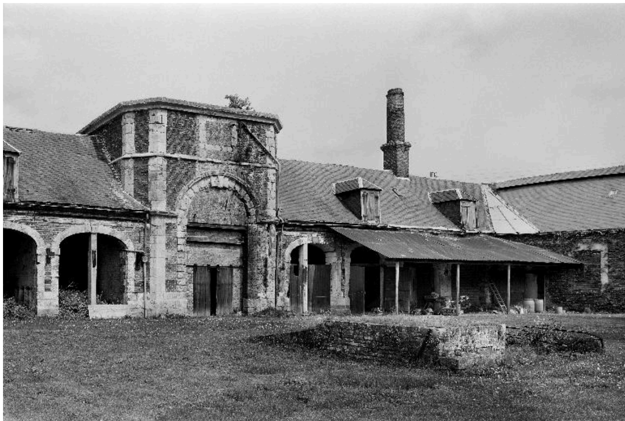
Brasserie, flanc sud.