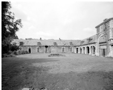
Ecuries et cour intérieure, vue générale. IVR22_19918000158V