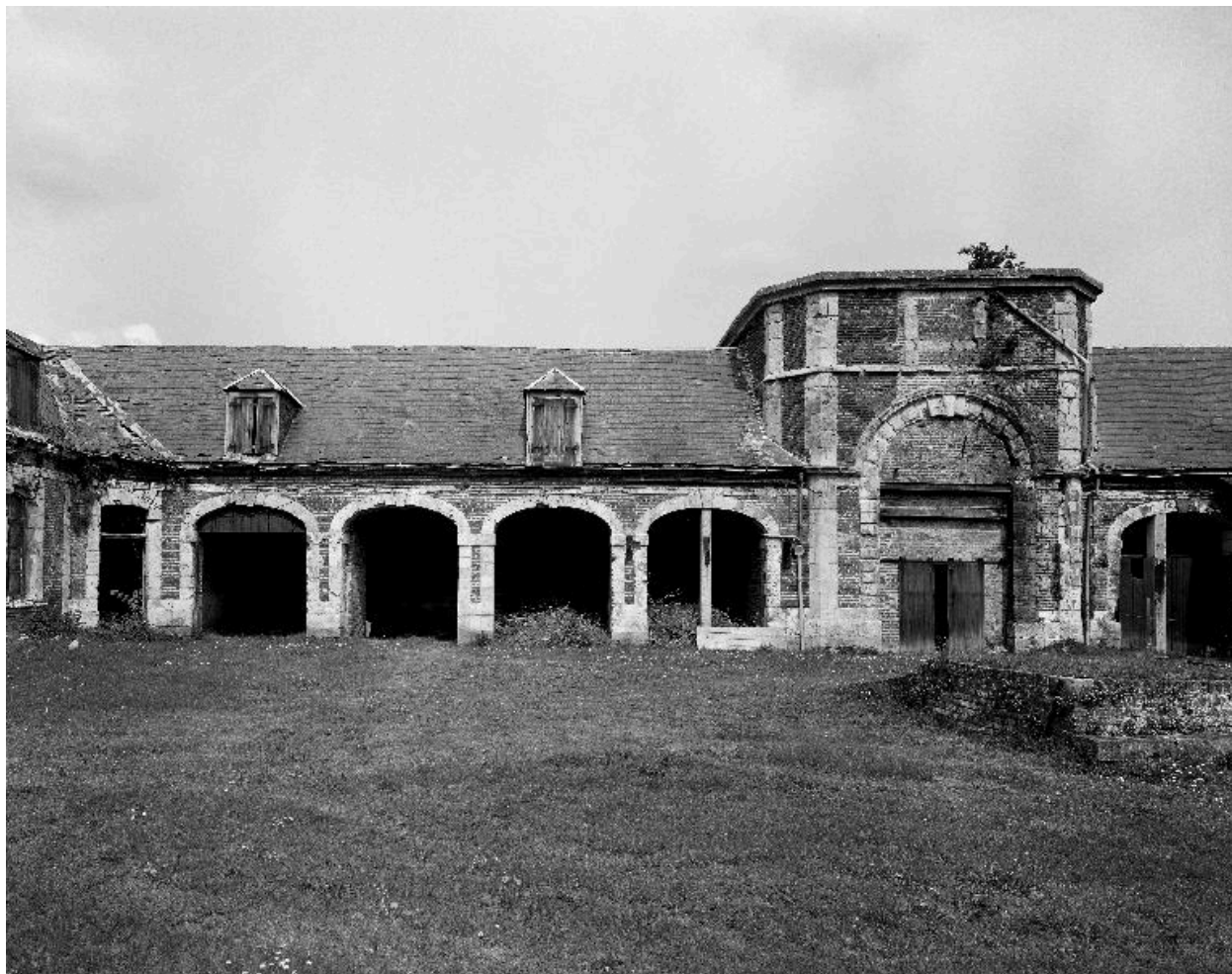
Ecuries, flanc sud.