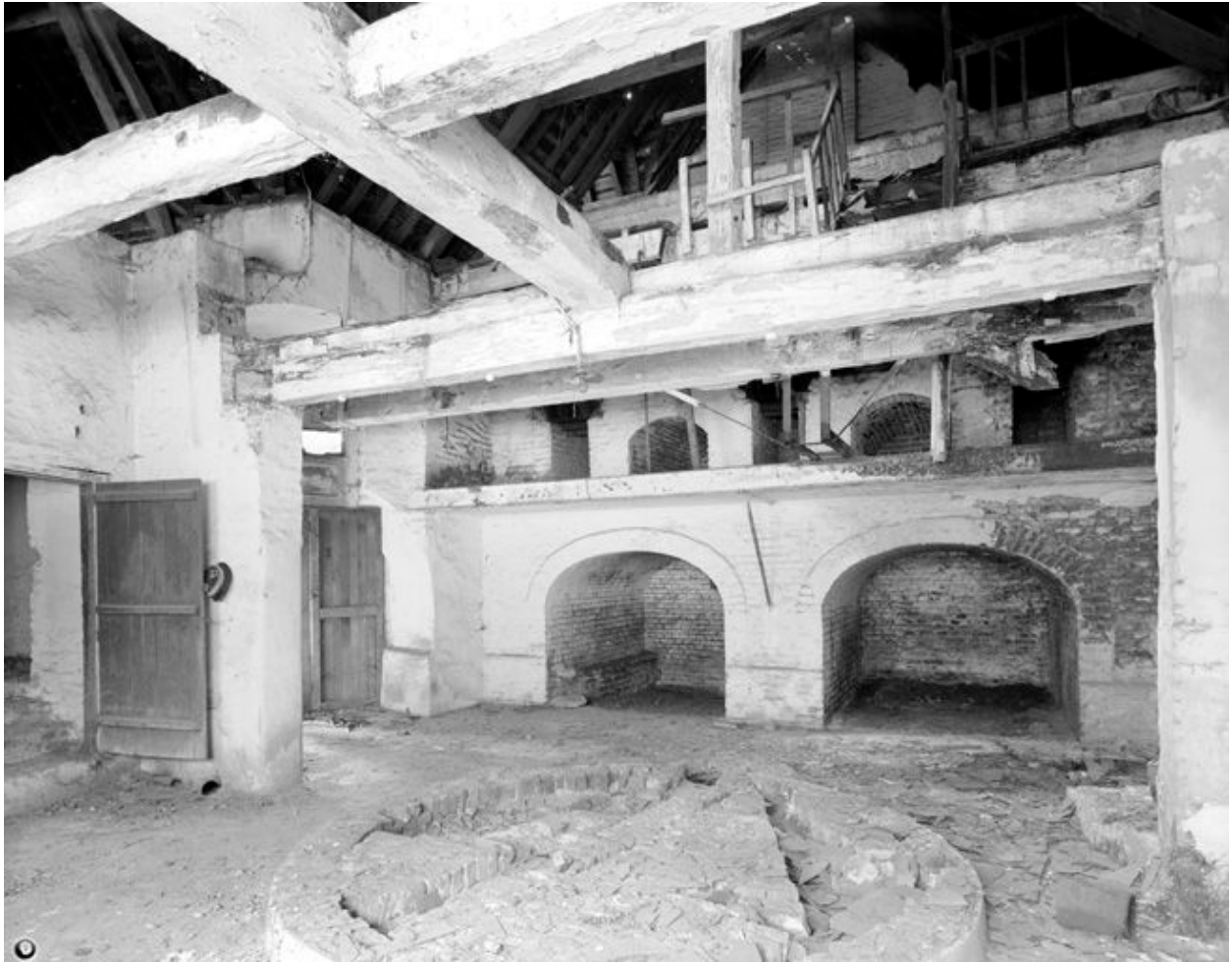
Ecuries et brasserie, vue intérieure.