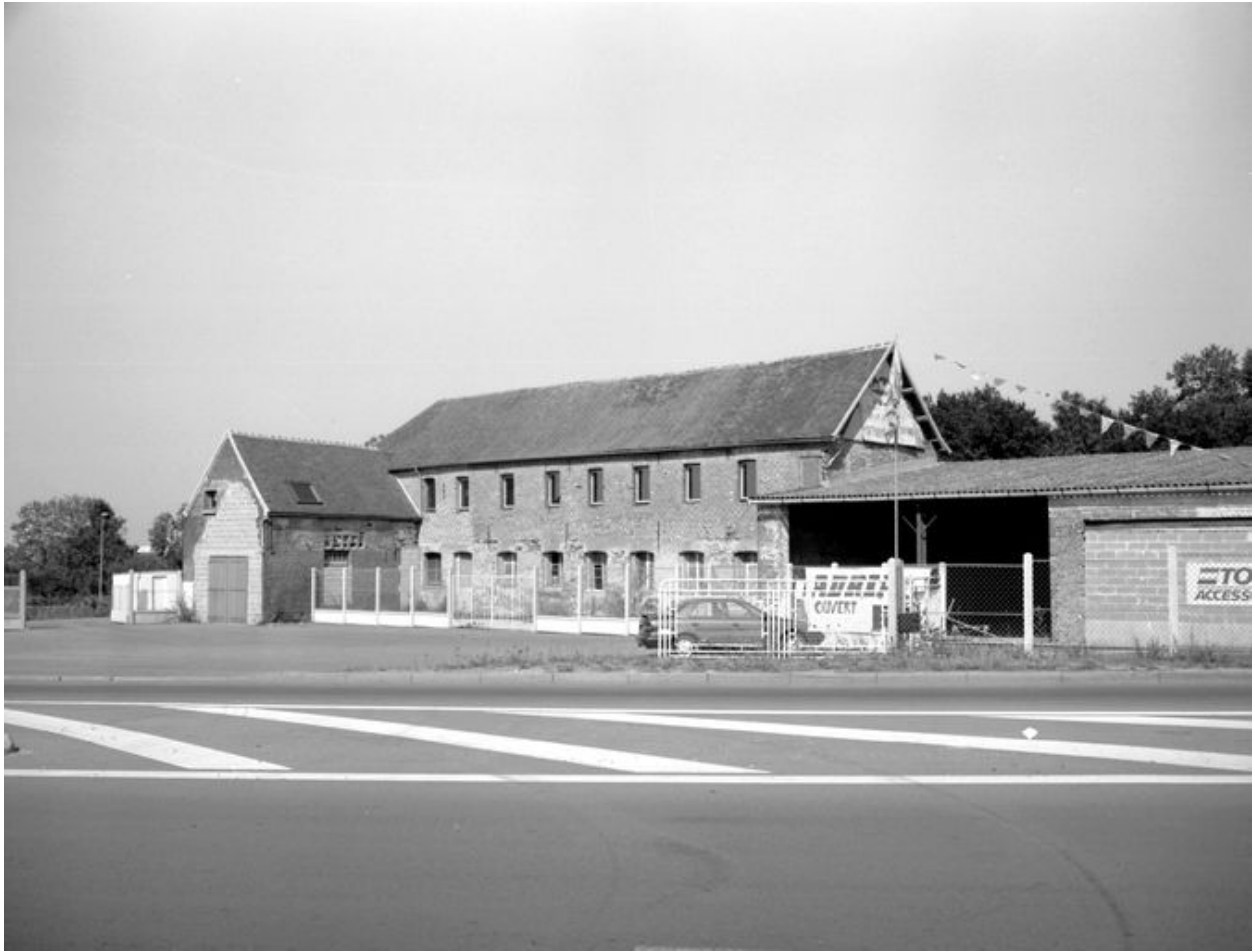
Vue générale de l'usine, côté Route de Paris.