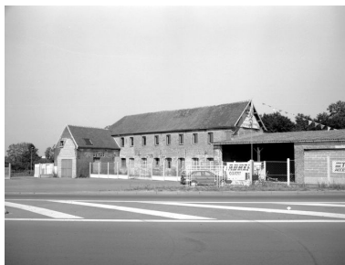
Vue générale de l'usine, côté Route de Paris.

IVR22_19976000365XB