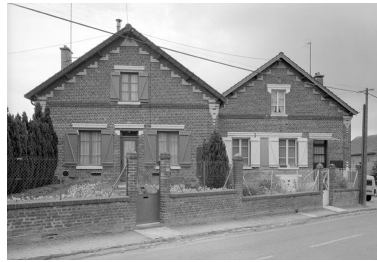
Élévation antérieure. IVR22_19856000970X

Plan de situation. Extrait du plan cadastral de 1982, section AC 56 et 288.