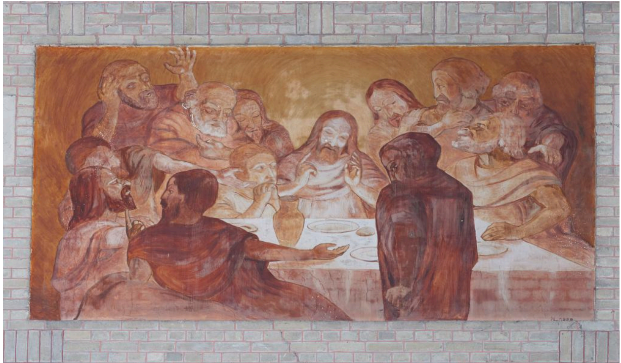
Vue de la deuxième peinture du côté est : la Cène.