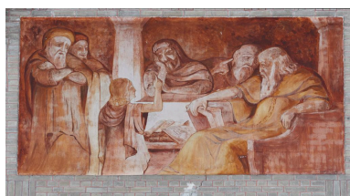
Vue de la première peinture du côté ouest : Jésus et les Docteurs.