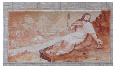
Vue de la cinquième peinture du côté est : la tentation du Christ.