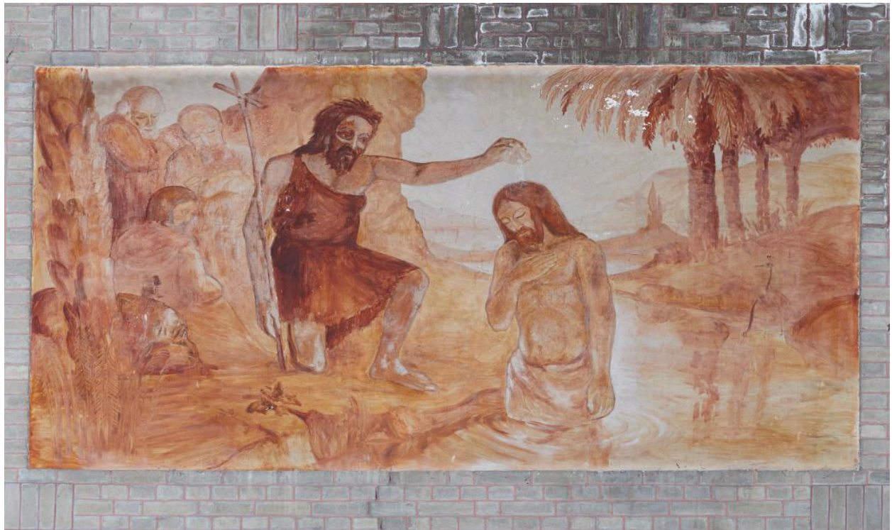
Vue de la cinquième peinture du côté ouest : le baptême du Christ.