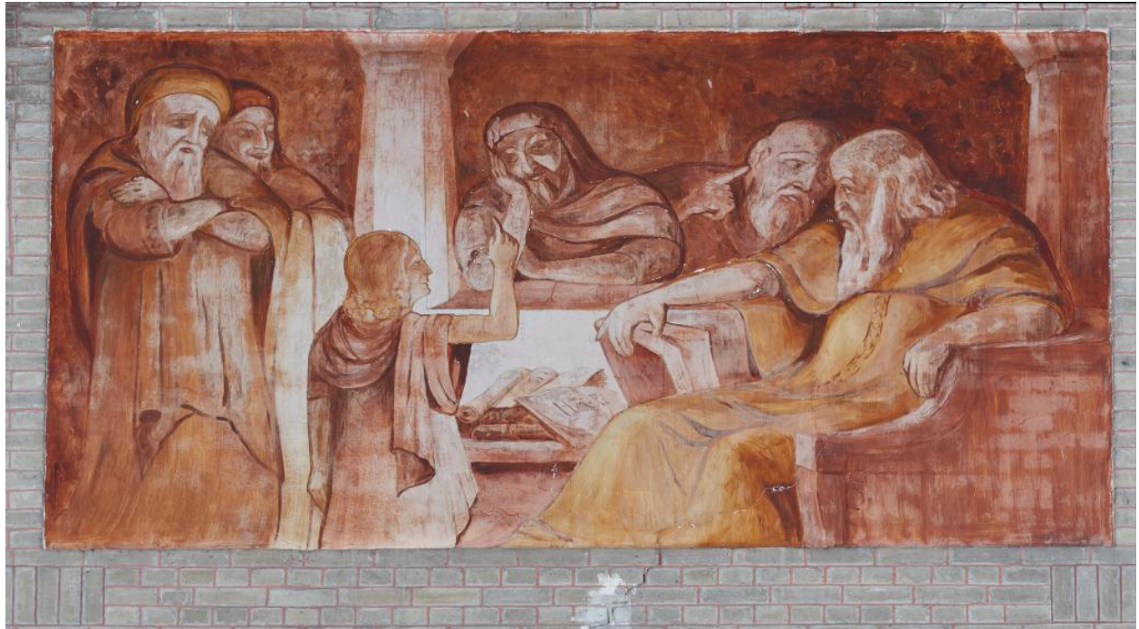
Vue de la première peinture du côté ouest : Jésus et les Docteurs.