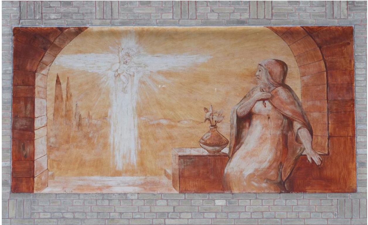
Vue de la troisième peinture du côté ouest : l'Annonciation.