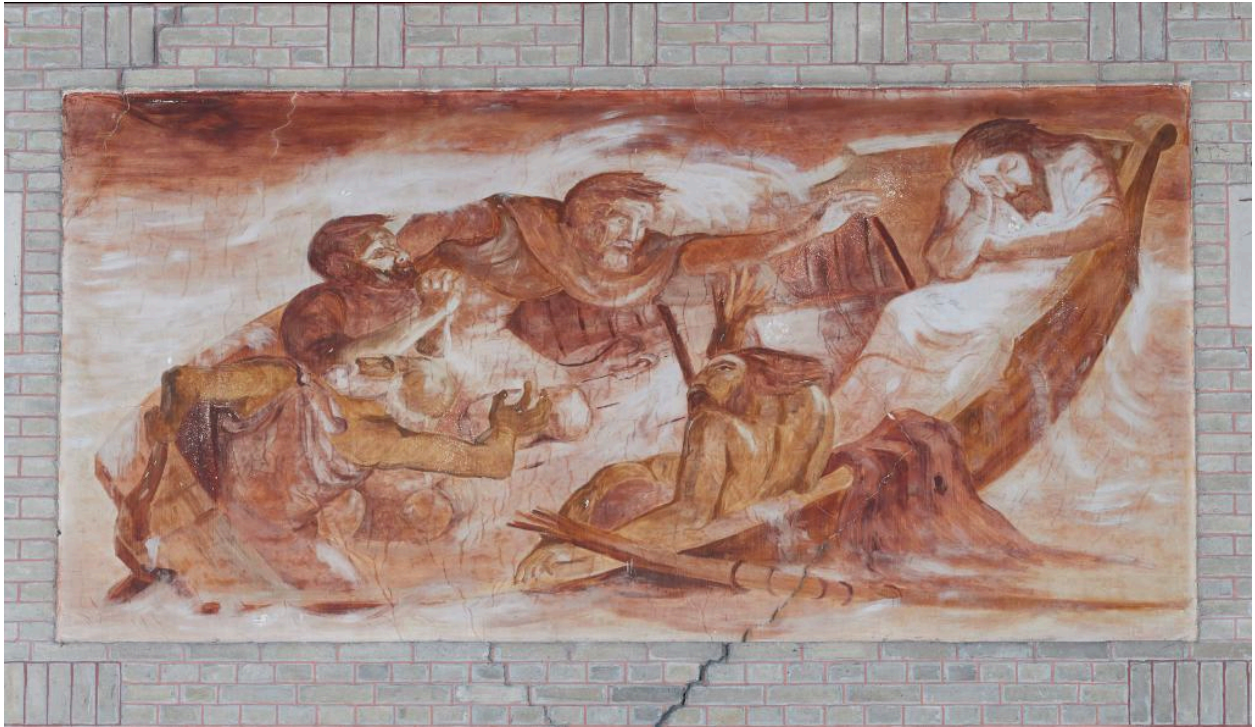
Vue de la première peinture du côté est : la tempête apaisée.