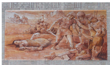
Vue de la quatrième peinture du côté ouest : le Massacre des Innocents. IVR32_20215900316NUCA