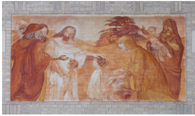
Vue de la quatrième peinture du côté est : Jésus bénissant les enfants.