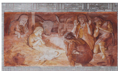
Vue de la deuxième peinture du côté ouest : l'Adoration des bergers. IVR32_20215900314NUCA