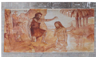
Vue de la cinquième peinture du côté ouest : le baptême du Christ.