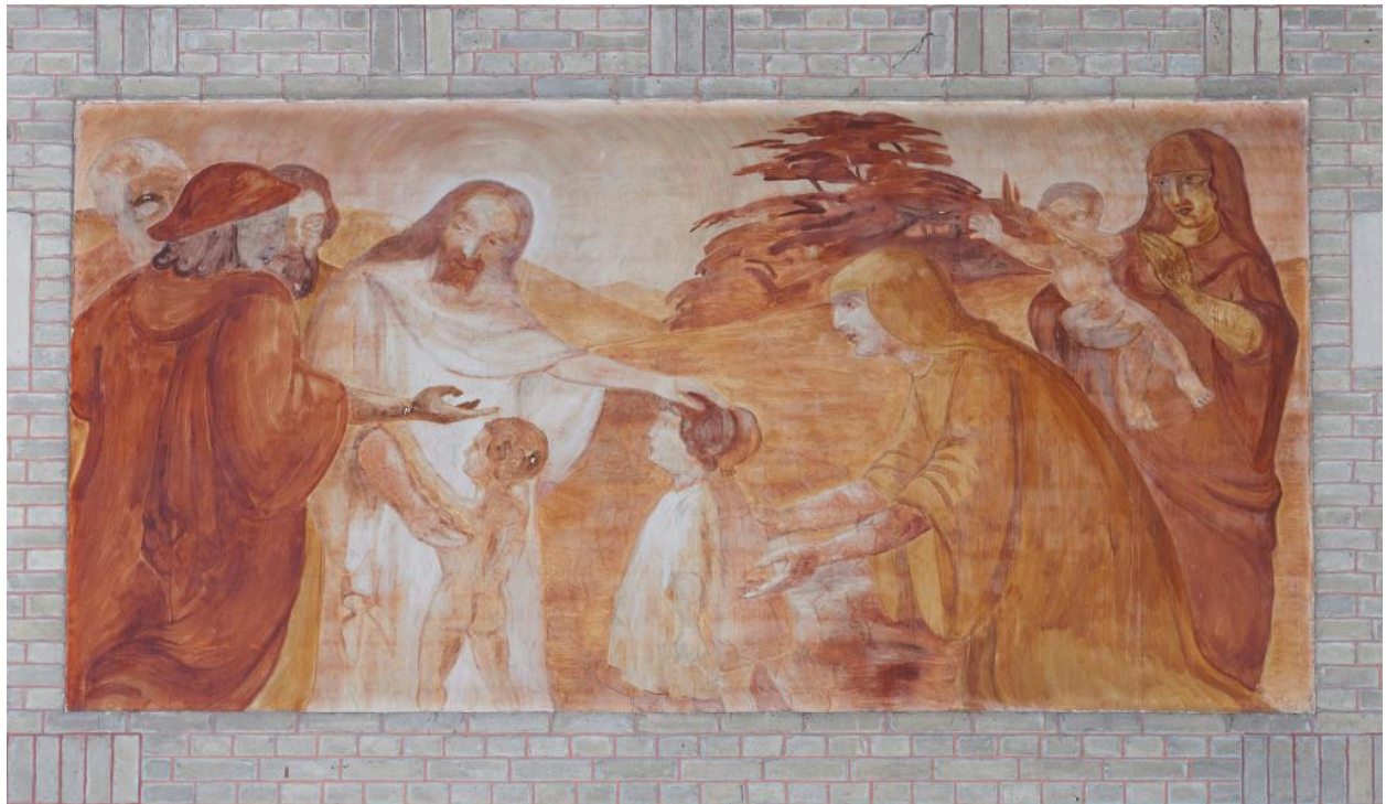
Vue de la quatrième peinture du côté est : Jésus bénissant les enfants.