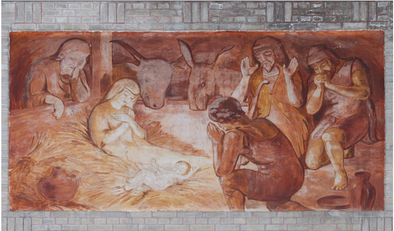
Vue de la deuxième peinture du côté ouest : l'Adoration des bergers.