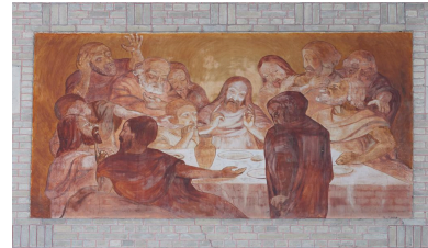
Vue de la deuxième peinture du côté est : la Cène.