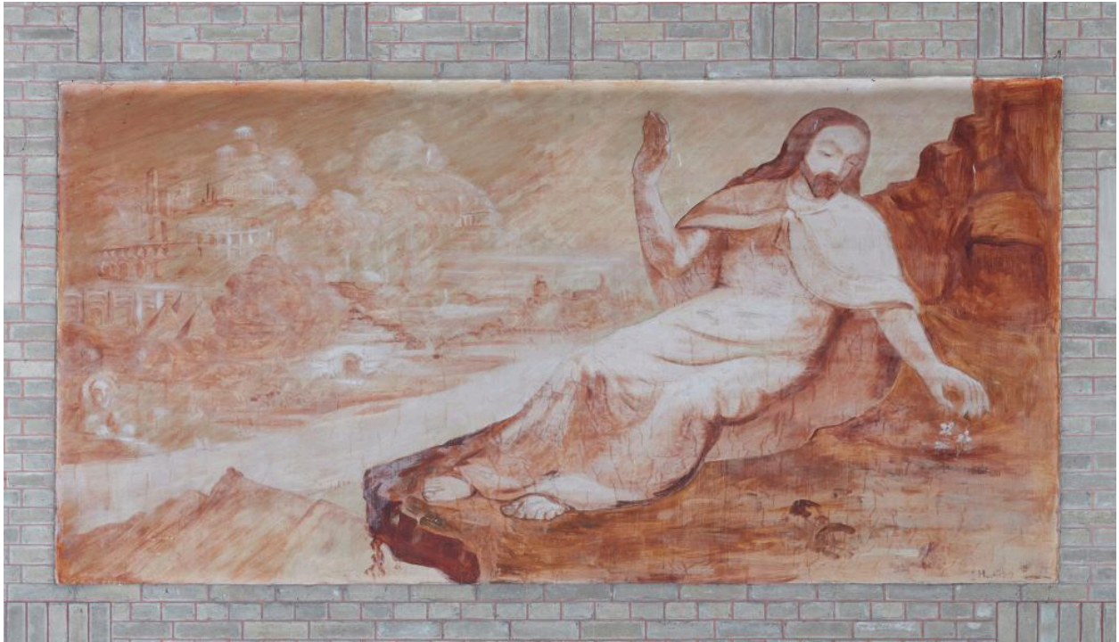
Vue de la cinquième peinture du côté est : la tentation du Christ.