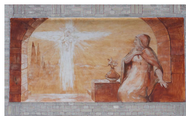
Vue de la troisième peinture du côté ouest : l'Annonciation.