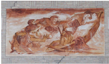
Vue de la première peinture du côté est : la tempête apaisée.