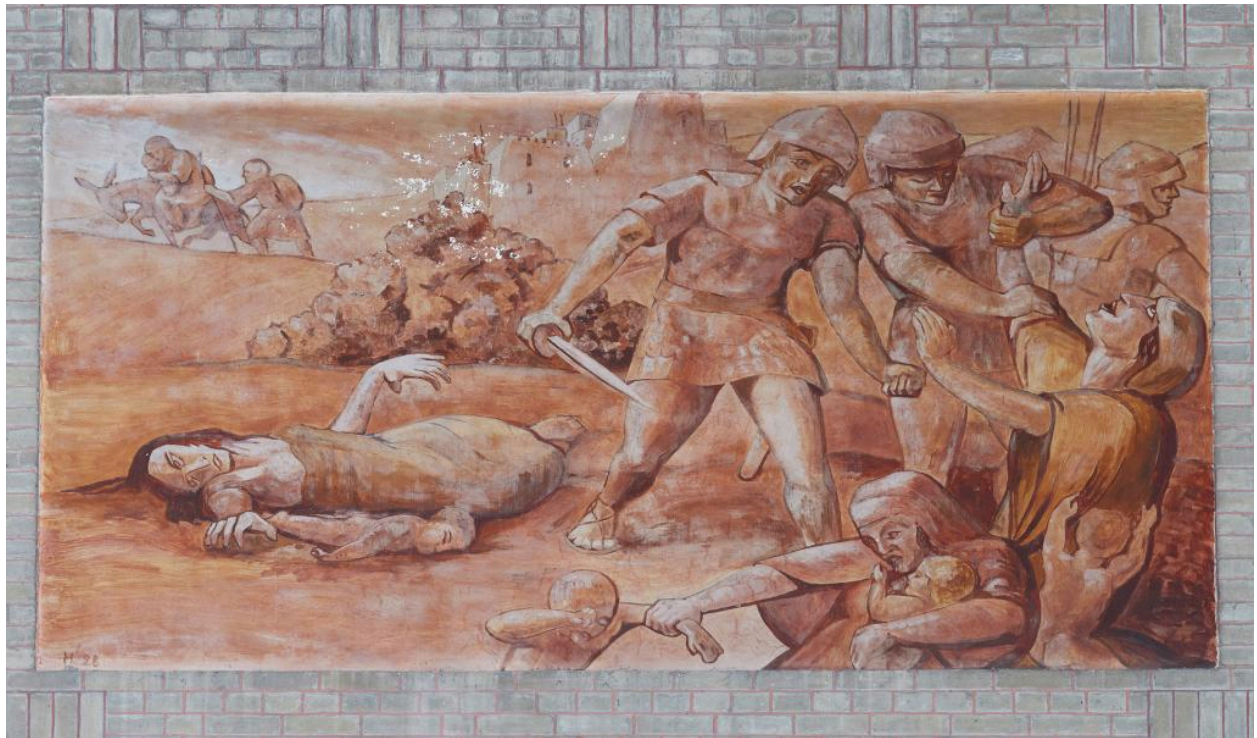
Vue de la quatrième peinture du côté ouest : le Massacre des Innocents.