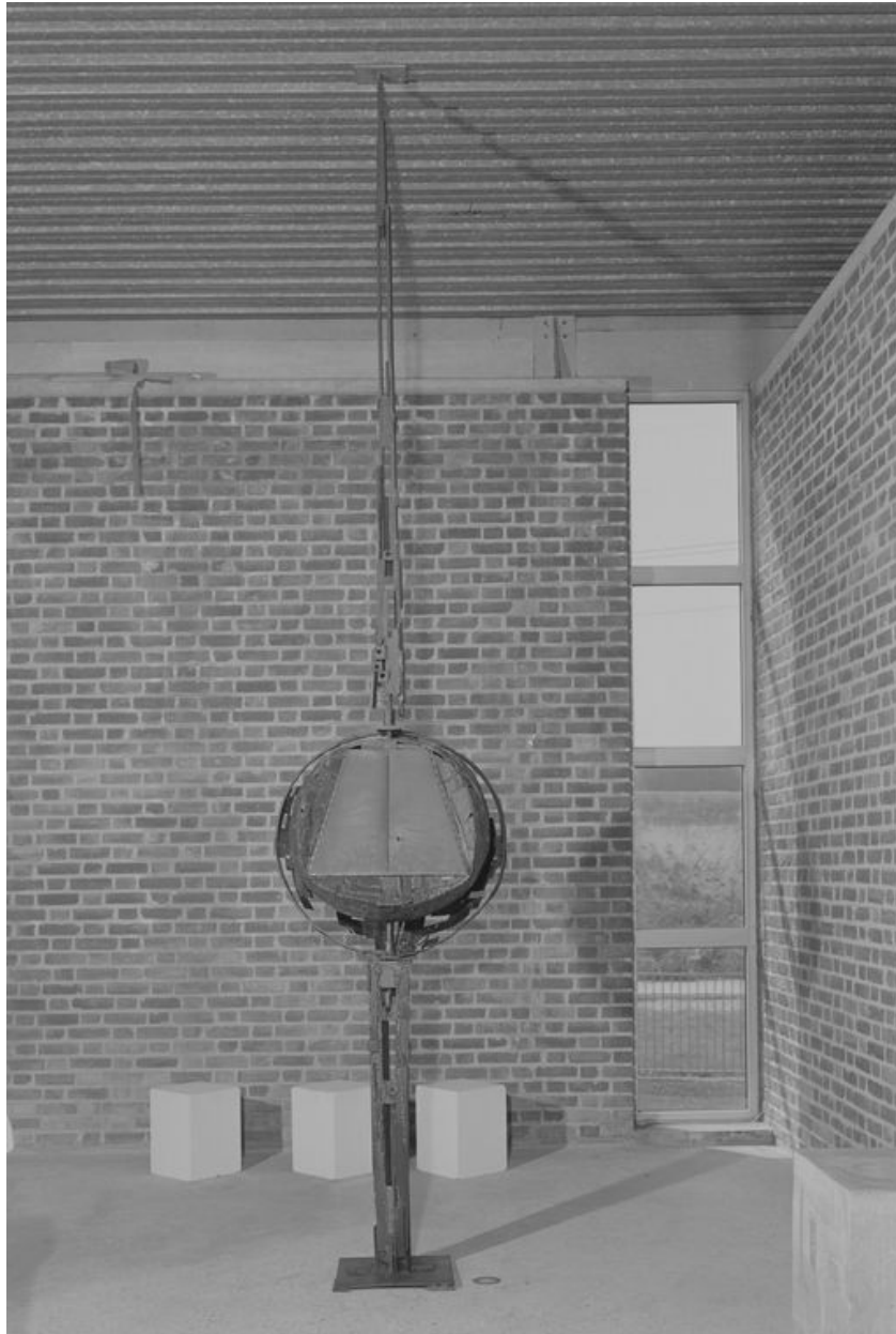
Vue du tabernacle (ouvert), Jean-Pierre Pernot sculpteur.