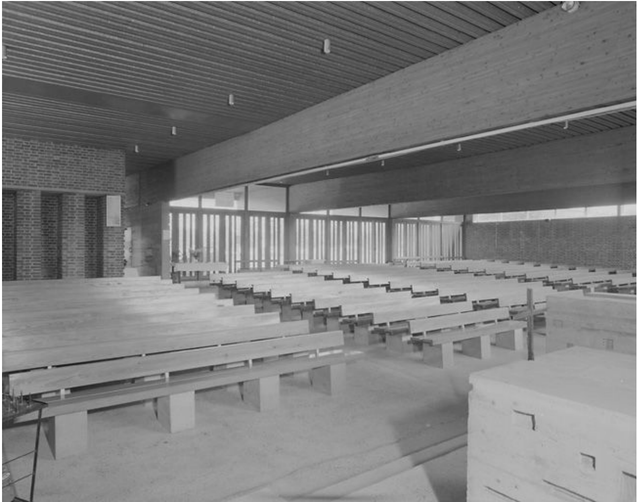
Vue intérieure vers l'est.