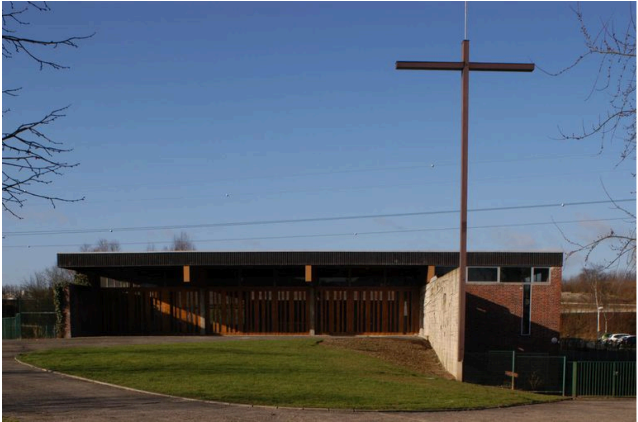
Vue de la façade est.