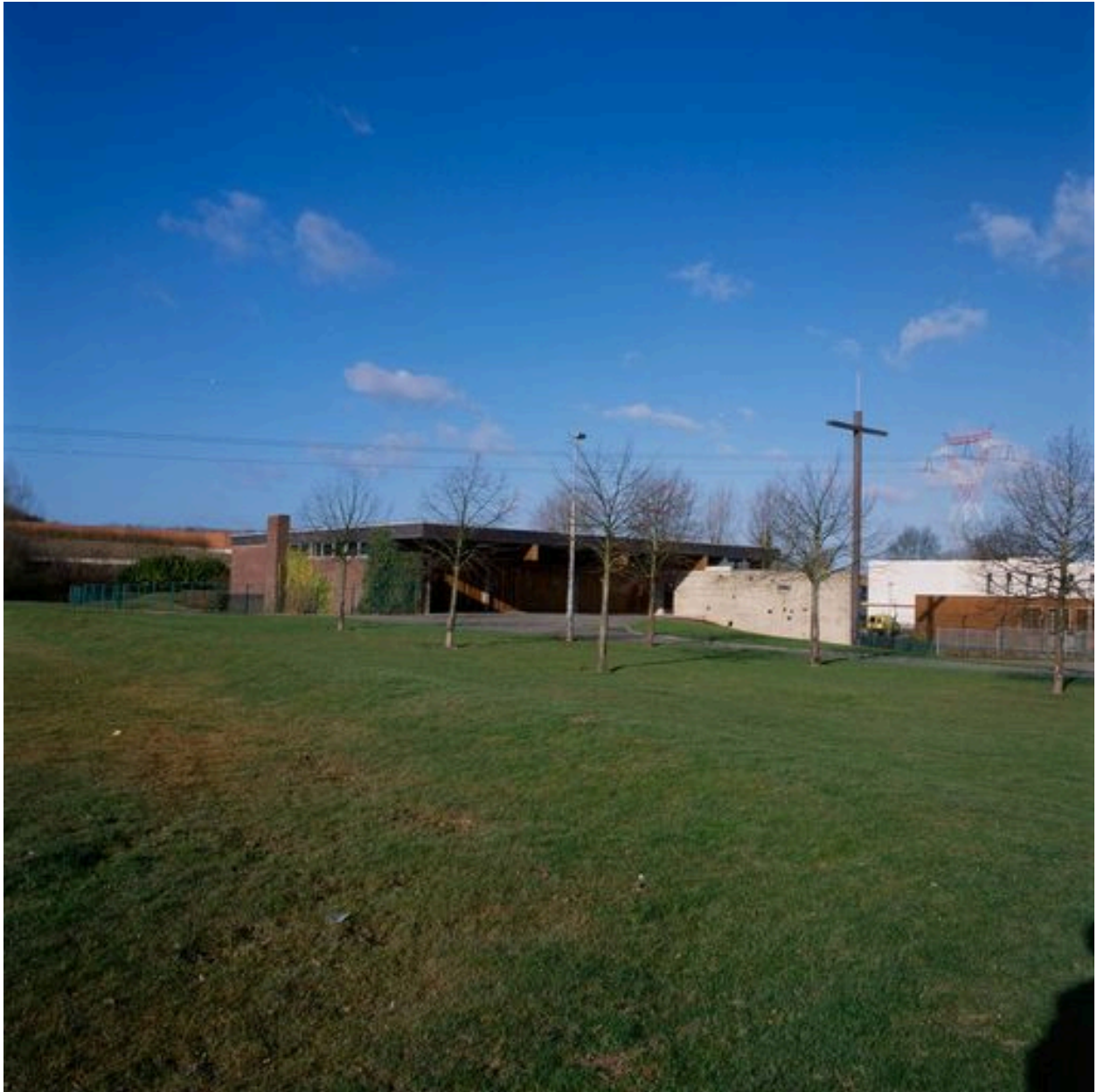
Vue de situation depuis le sud-est.