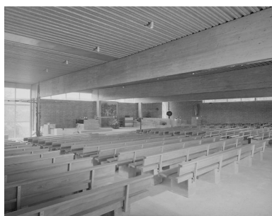
Vue intérieure vers le chœur. IVR22_19968000268V