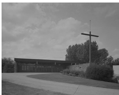
Vue de la façade est.