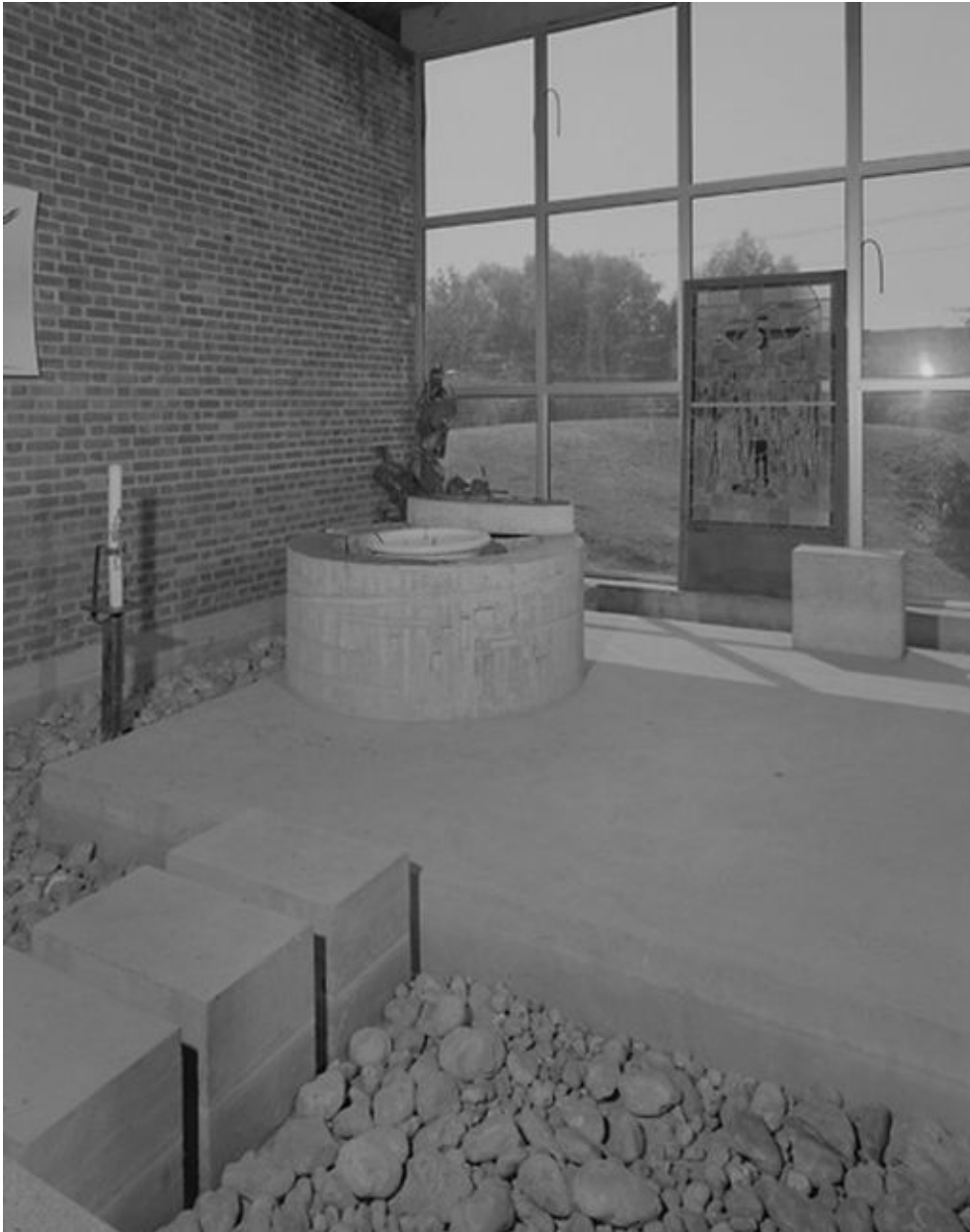
Vue des fonts baptismaux, Jean-Pierre Pernot sculpteur.