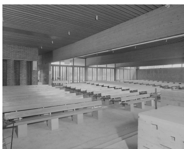
Vue intérieure vers l'est. IVR22_19968000269V