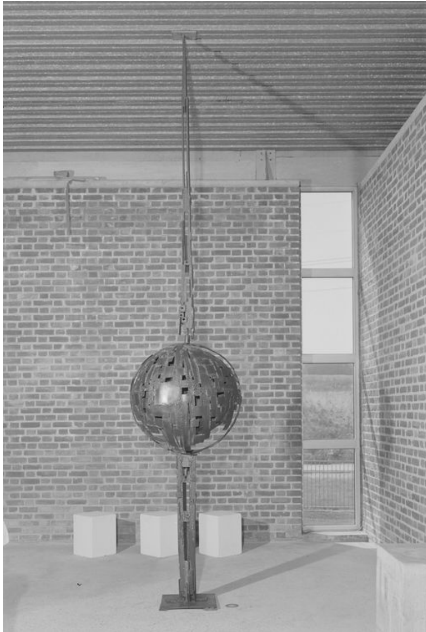
Vue du tabernacle (fermé), Jean-Pierre Pernot sculpteur.