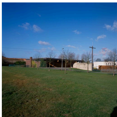
Vue de situation depuis le sud-est. IVR22_20038000030XA