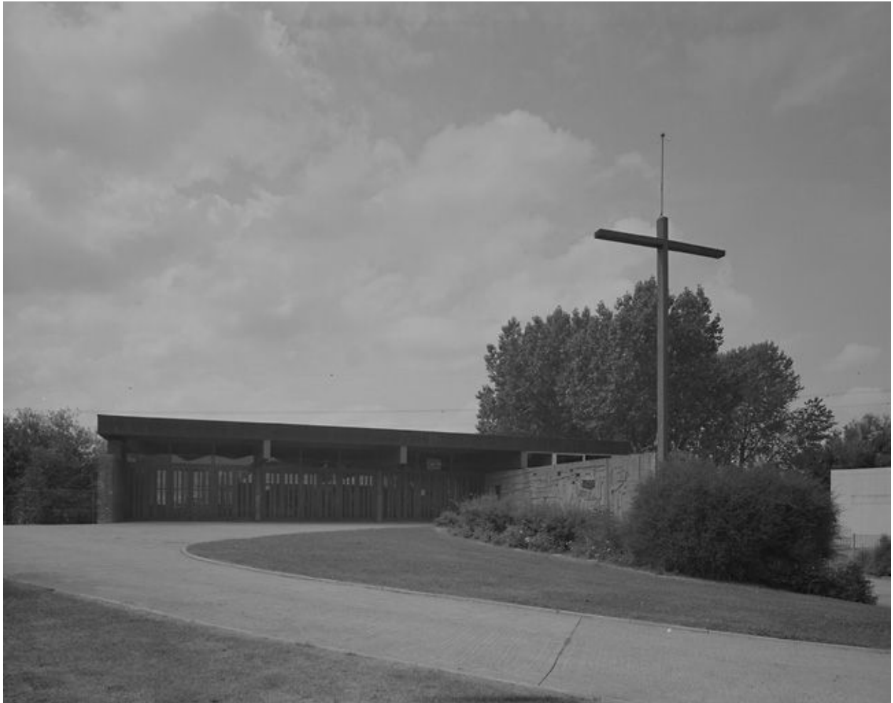
Vue de la façade est.