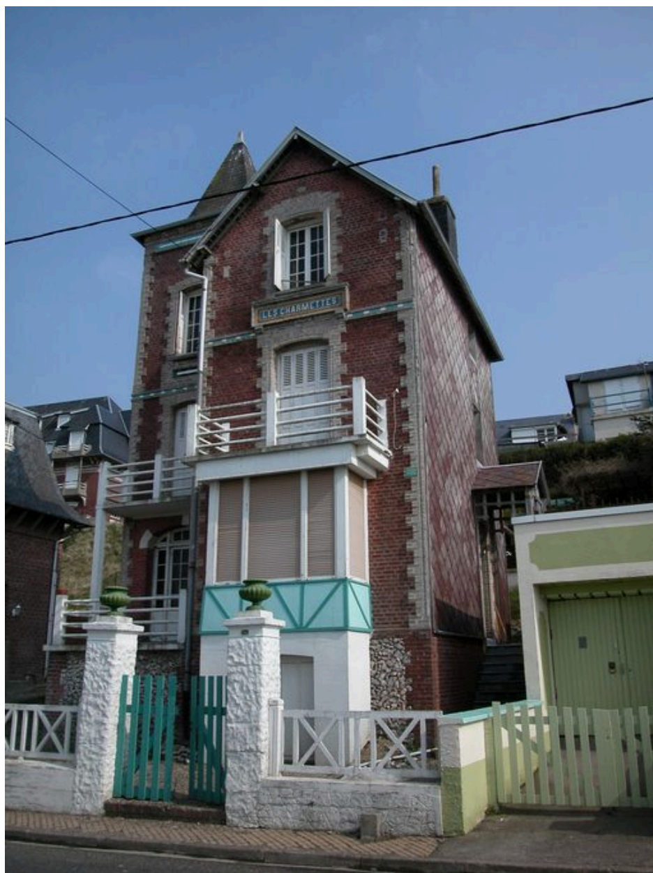
Vue de trois-quarts sur élévations antérieure et latérale droite.