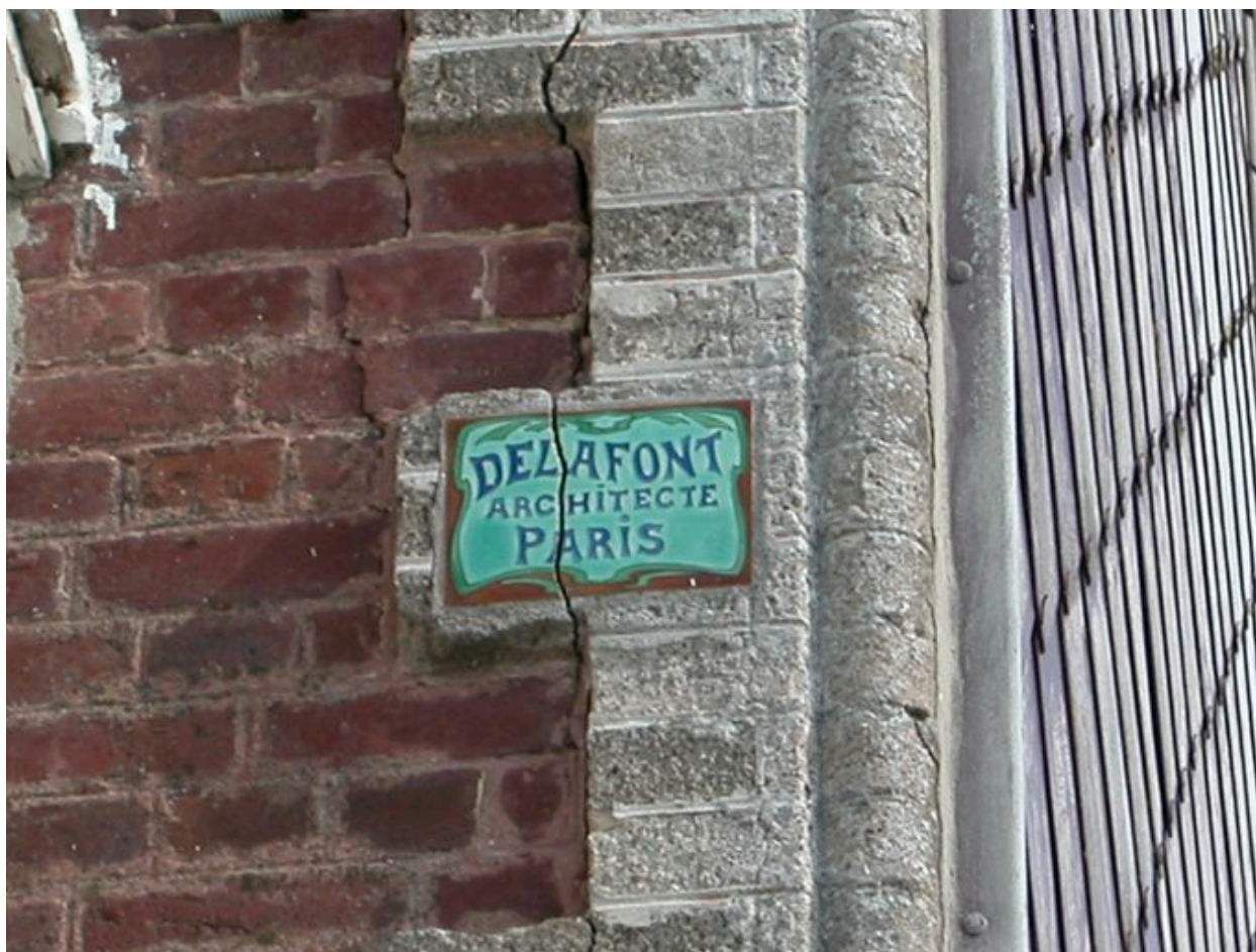
Détail du carreau de céramique portant signature de l'architecte.