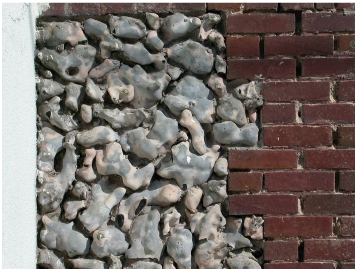
Détail du parement de silex du soubassement.