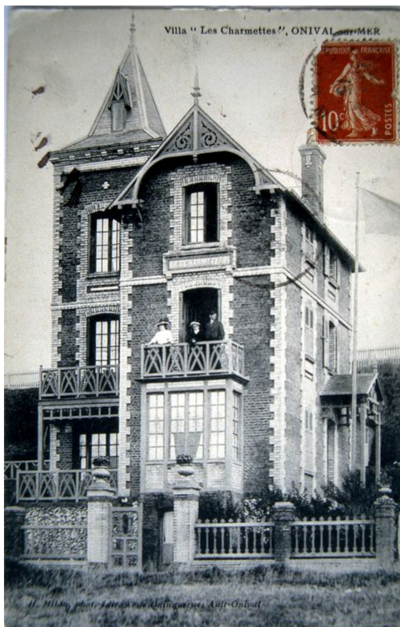
Carte postale, 1er quart 20e siècle (coll. part).