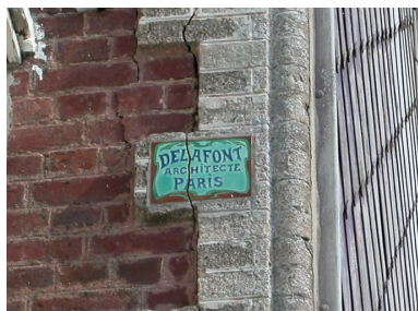
Détail du carreau de céramique portant signature de l'architecte.

Phot. Elisabeth Justome IVR22_20058002916NUCA