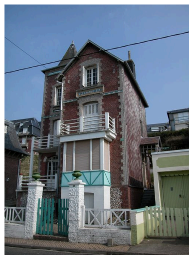
Vue de trois-quarts sur élévations antérieure et latérale droite.

IVR22_20058002915NUCA