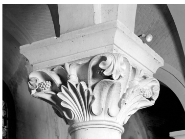
Chapiteau néoroman de la nef.