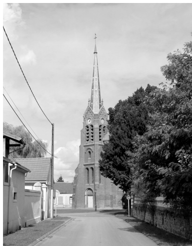
Vue générale. IVR22_20008000685X