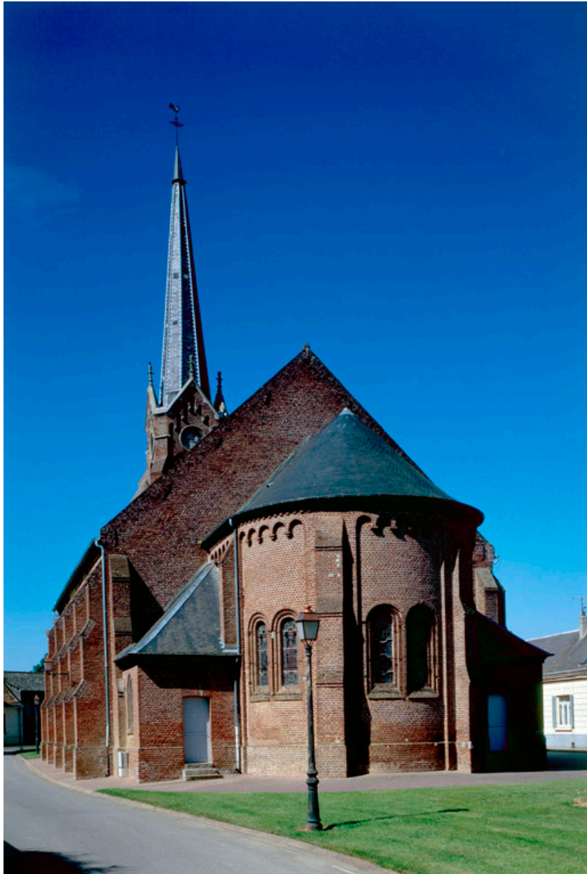
Vue générale du chevet, depuis l'est.