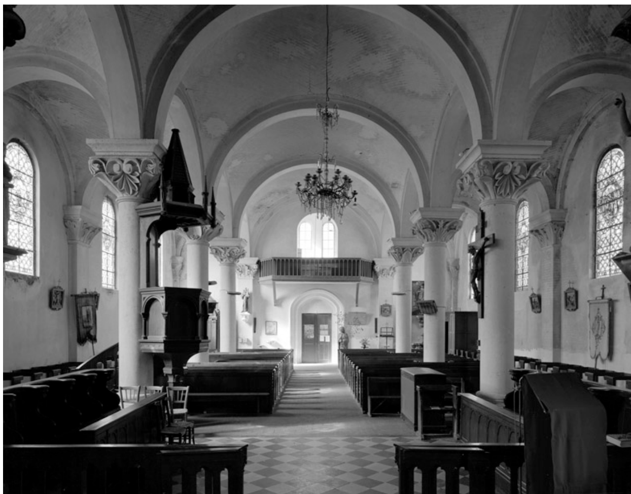
Vue intérieure, depuis le chœur.