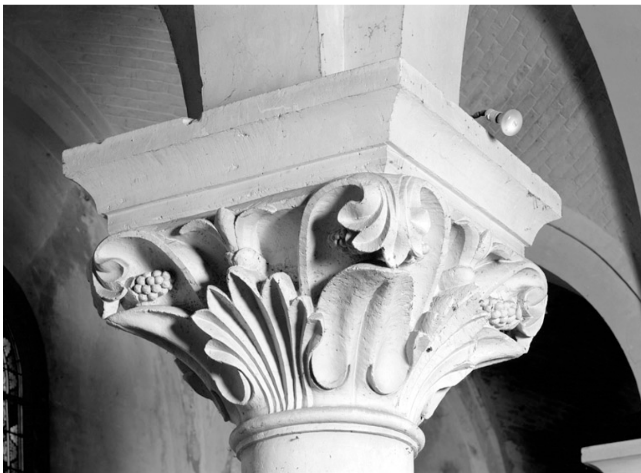
Chapiteau néoroman de la nef.