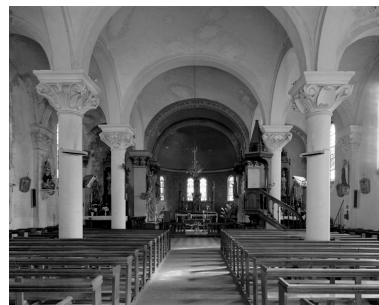
Vue intérieure, vers le chœur. IVR22_19998000711V