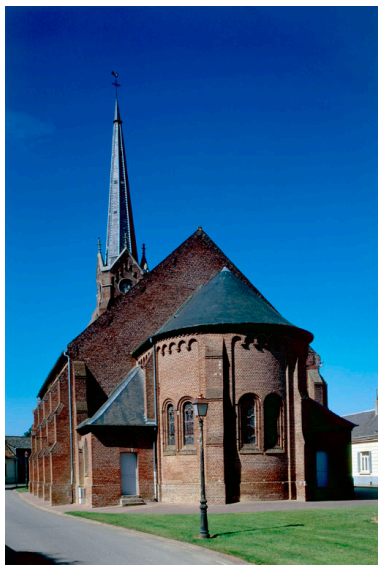
Vue générale du chevet, depuis l'est. IVR22_19988000854XA