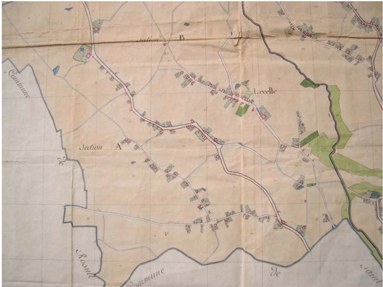
Cadastre de 1805, la partie méridionale (AD Nord P30/192).