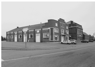
Vue générale de la salle des fêtes, de la mairie et de l'école. IVR31_20045900053X