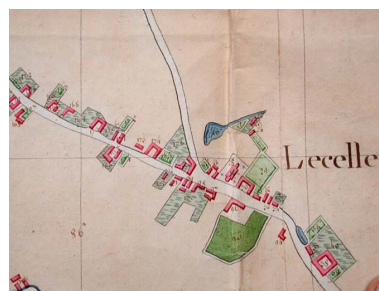
Cadastré de 1805, le centre autour de l'église et le presbytère (AD Nord P30/192).

IVR31_20045905452NUCA