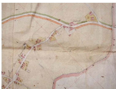
Cadastré du Consulat, 1805, la rue du Grand-Sart (AD Nord P30/192). IVR31_20045905456NUCA