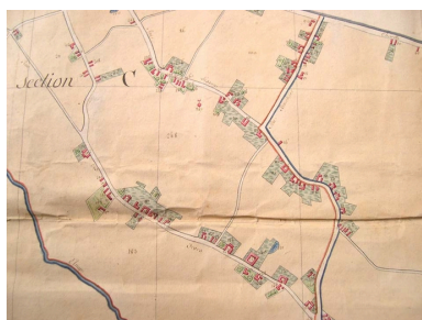
Cadastré de 1805, la rue de Lasso (AD Nord P30/192). IVR31_20045905454NUCA