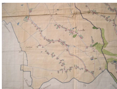
Cadastré de 1805, la partie méridionale (AD Nord P30/192).

IVR31_20045905453NUCA