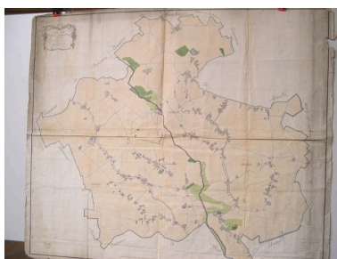
Cadastré de 1805 (AD Nord P30/192).

Phot. Sophie Luchier (reproduction) IVR31_20045905453NUCA