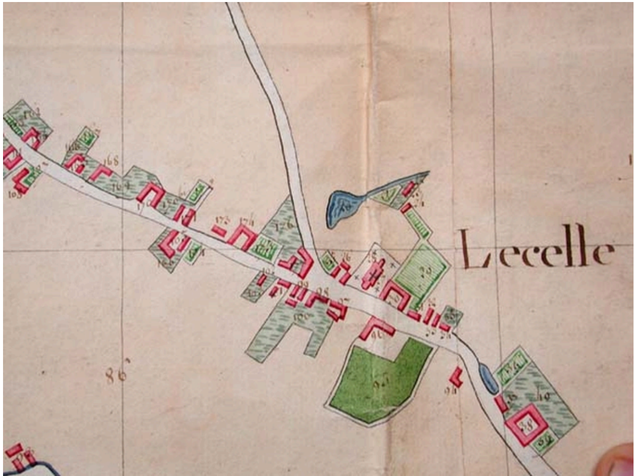
Cadastre de 1805, le centre autour de l'église et le presbytère (AD Nord P30/192).