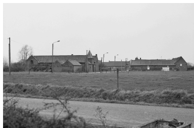
Alignement de fermes rue des Fèves.