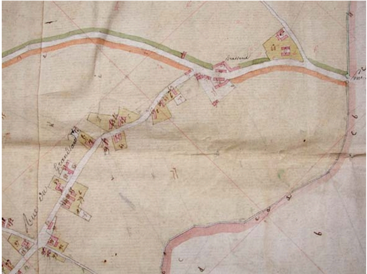
Cadastre du Consulat, 1805, la rue du Grand-Sart (AD Nord P30/192).