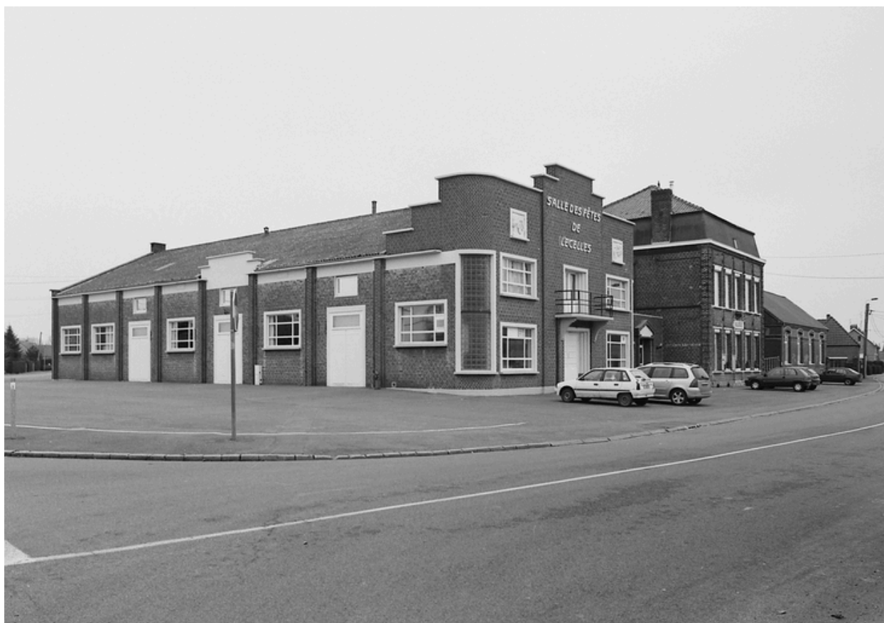
Vue générale de la salle des fêtes, de la mairie et de l'école.