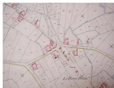
Le cadastre de 1885, le quartier de la gare (AD Nord P31/598). IVR31_20045905455NUCA