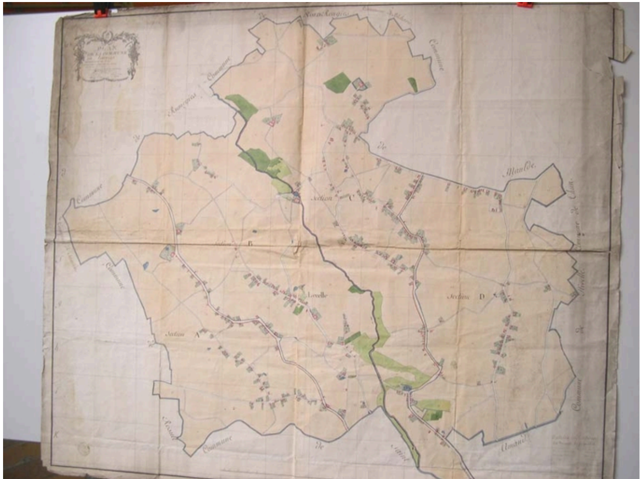
Cadastre de 1805 (AD Nord P30/192).