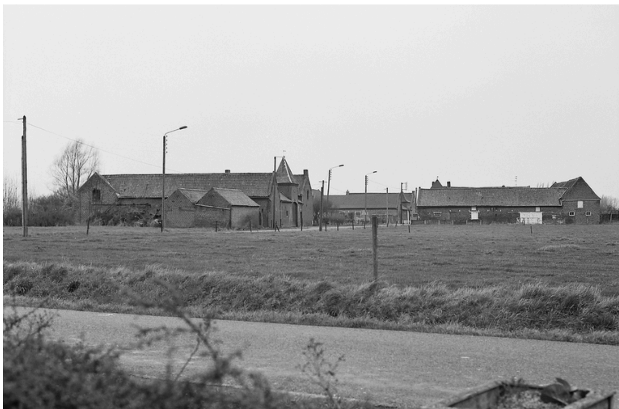
Alignement de fermes rue des Fèves.