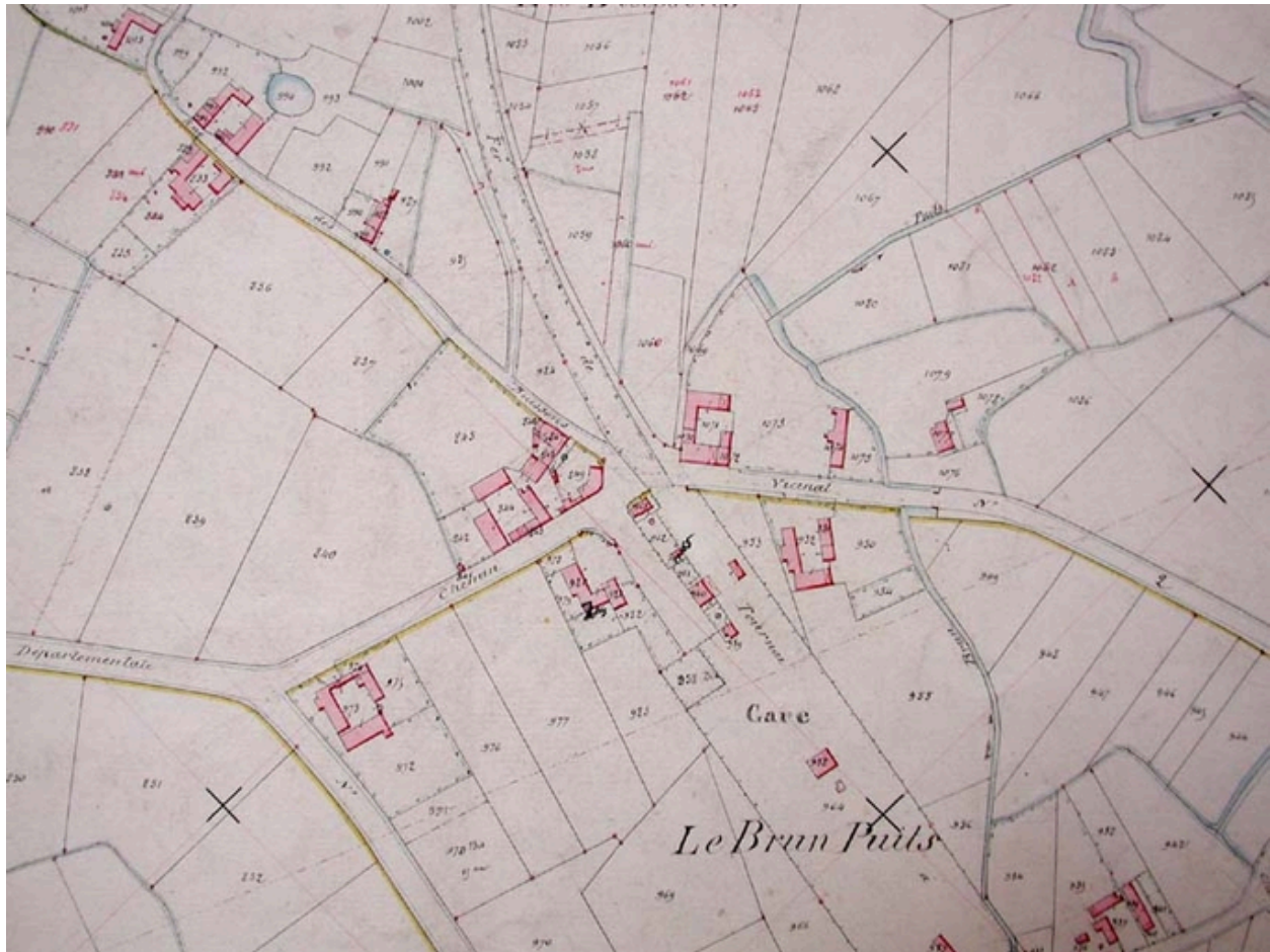
Le cadastre de 1885, le quartier de la gare (AD Nord P31/598).