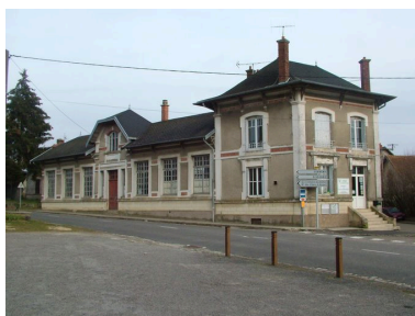
Vue générale. IVR22_20050200608NUCA