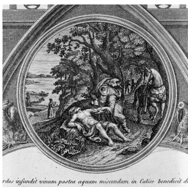
Détail de l'estampe du canon du Lavabo : Le Bon Samaritain.