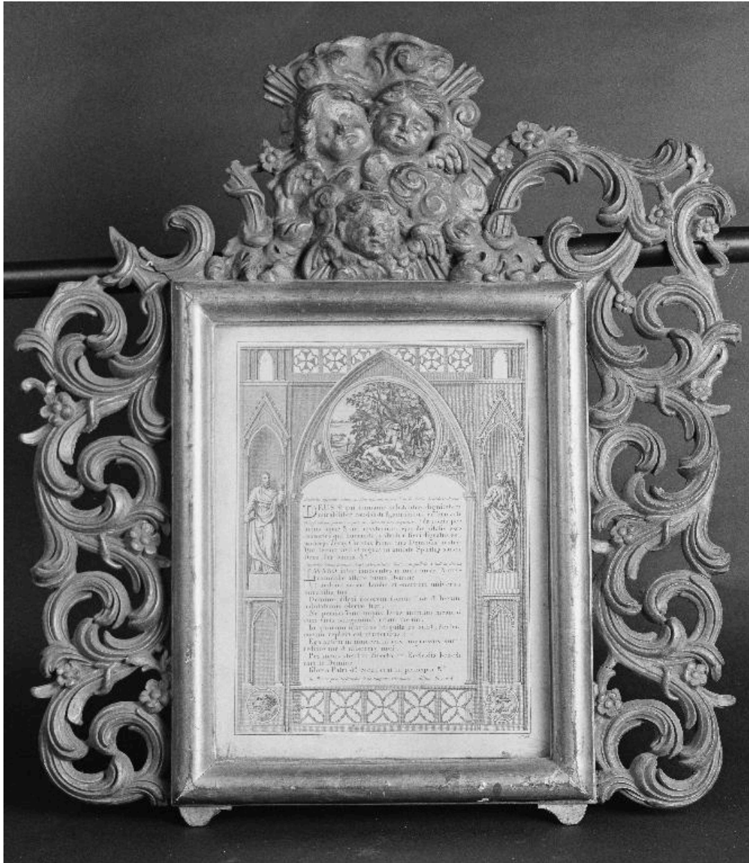
Vue d'ensemble du canon du Lavabo.