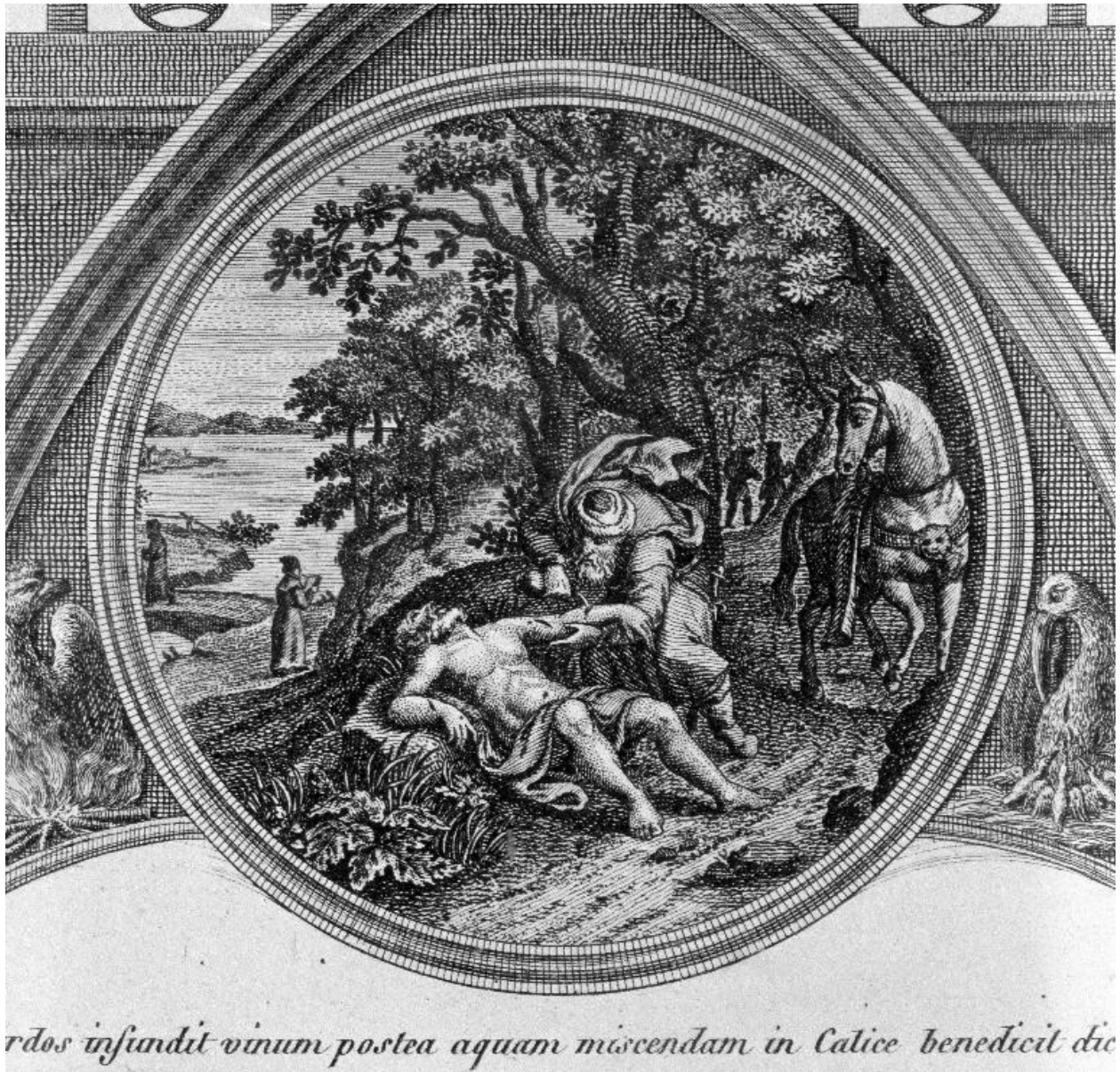
Détail de l'estampe du canon du Lavabo : Le Bon Samaritain.