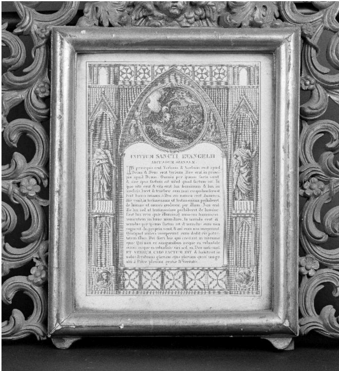
Vue de l'estampe du canon du Dernier évangile.