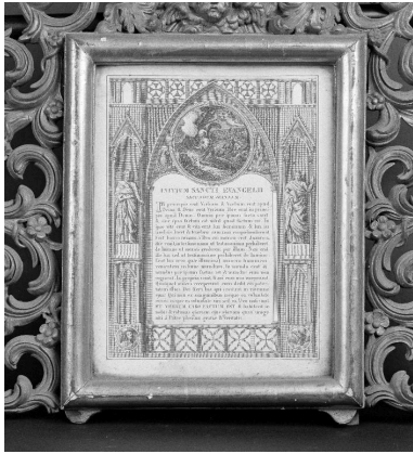
Vue de l'estampe du canon du Dernier évangile. IVR22_19956000127X