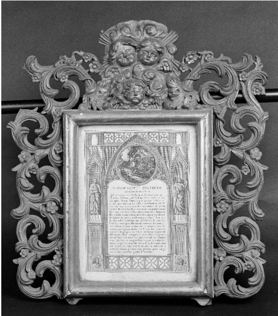
Vue d'ensemble du canon du Dernier Évangile.