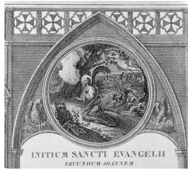
Détail de l'estampe du canon du Dernier évangile : le Christ au Mont des Oliviers.