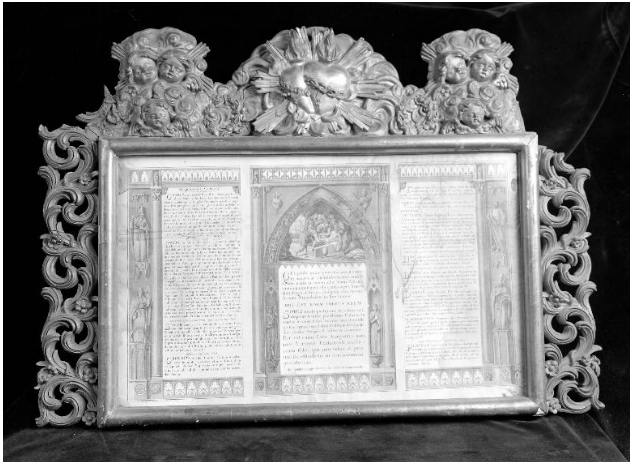
Vue d'ensemble du canon principal.