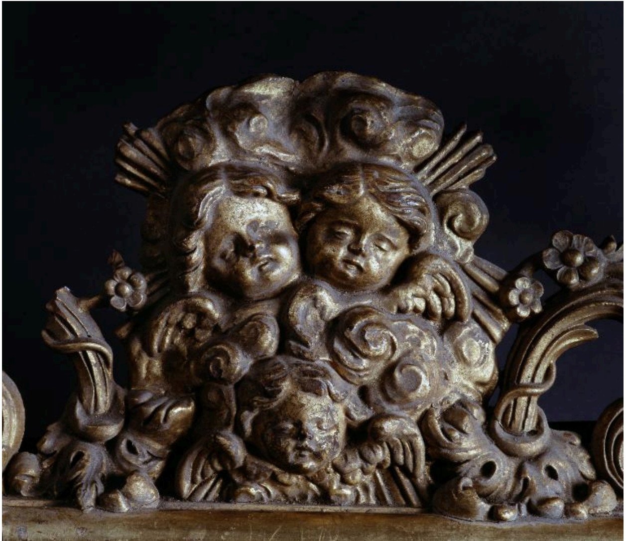
Détail des angelots du cadre.