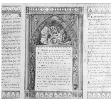
Vue de l'estampe du canon central : La Mise au tombeau.