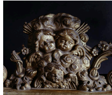
Détail des angelots du cadre.