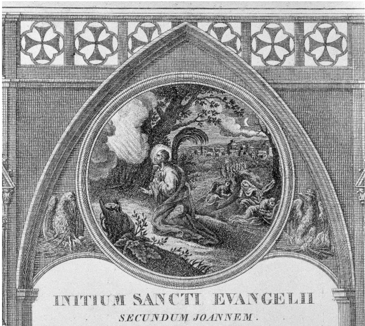
Détail de l'estampe du canon du Dernier évangile : le Christ au Mont des oliviers.