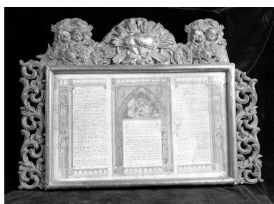
Vue d'ensemble du canon principal. IVR22_19956000188X