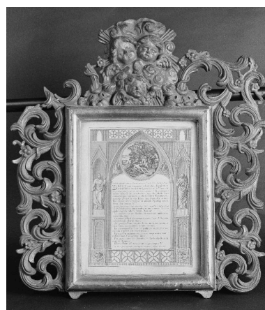
Vue d'ensemble du canon du Lavabo. IVR22_19956000121X