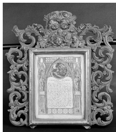
Vue d'ensemble du canon du Dernier Évangile. IVR22_19956000124X