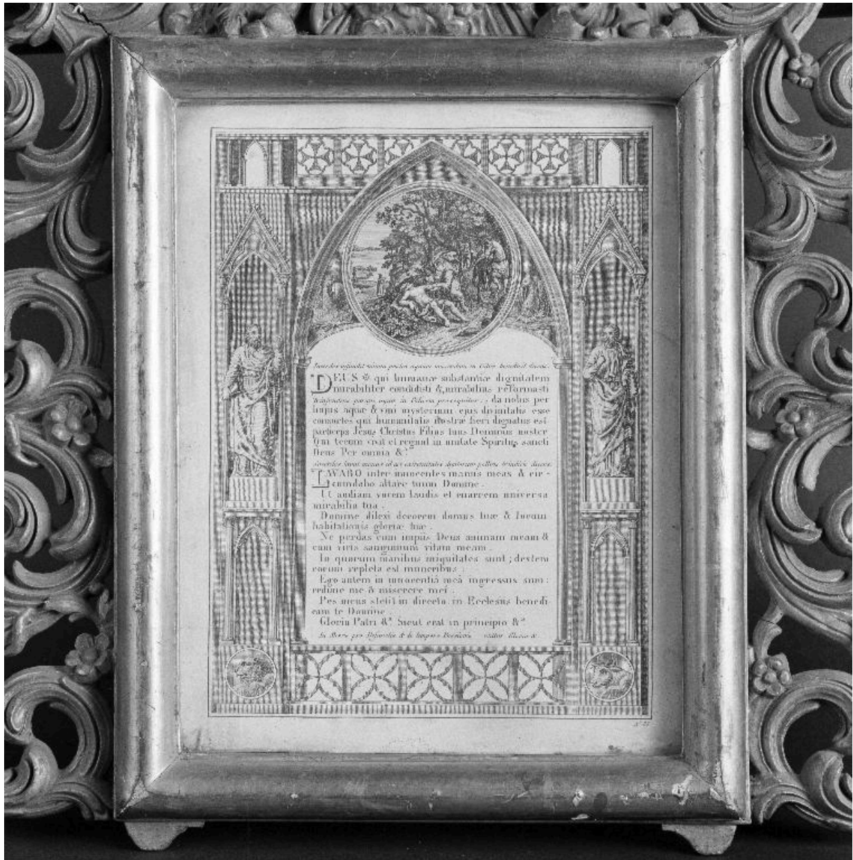
Vue de l'estampe du canon du Lavabo.