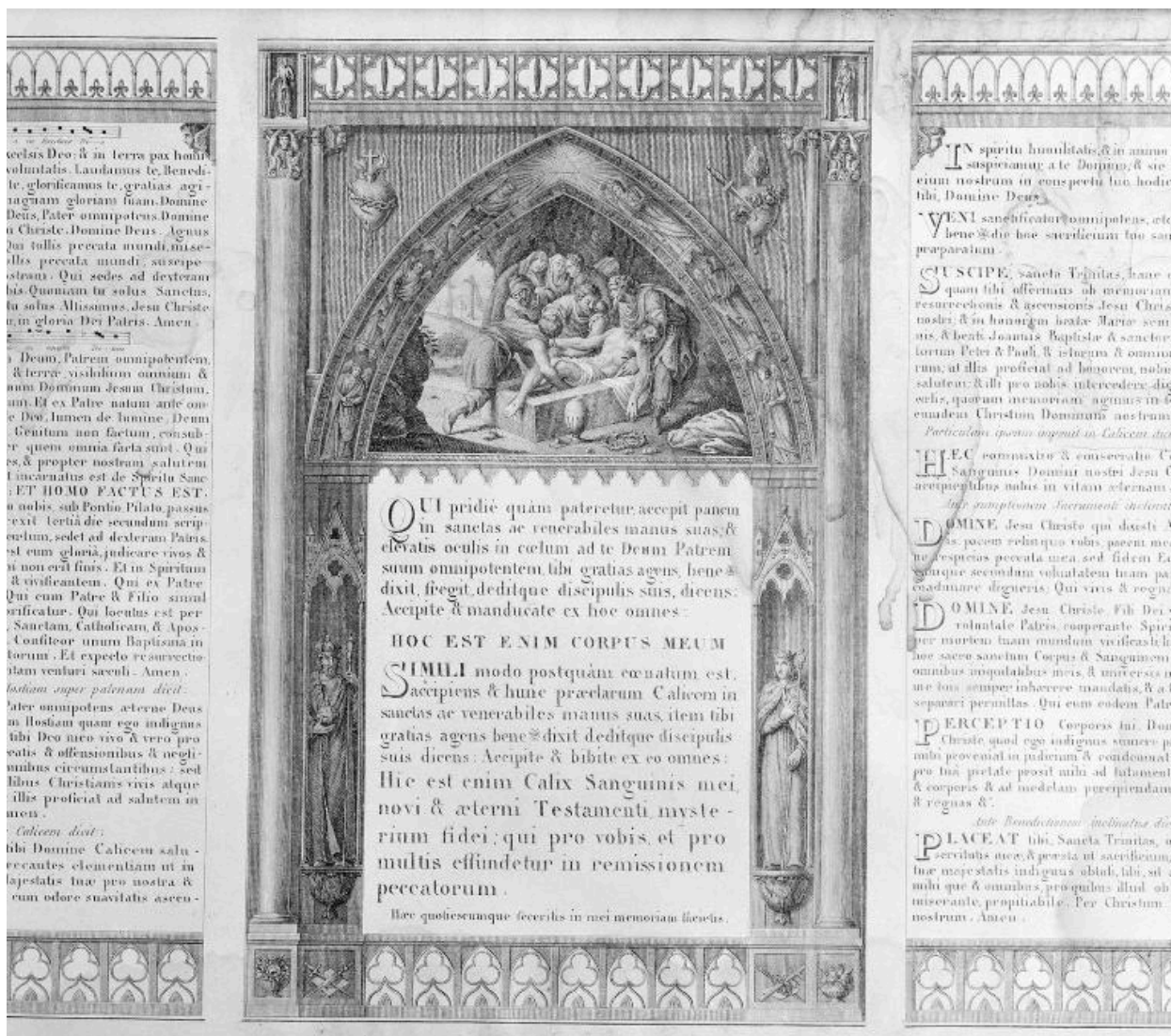
Vue de l'estampe du canon central : La Mise au tombeau.