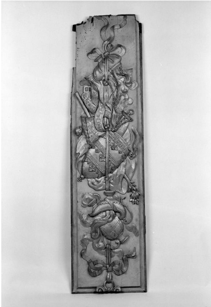
Détail d'un panneau.