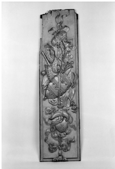
Détail d'un panneau. IVR22_19846000418X