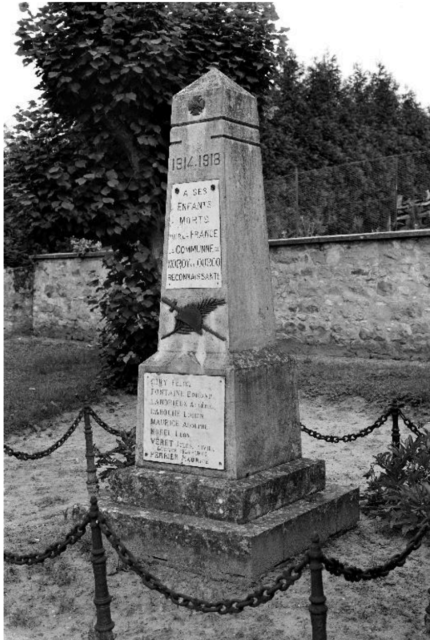
Vue du monument aux morts, réalisé en 1925 par A. Lointier, entrepreneur à Oulchy-le-Château.