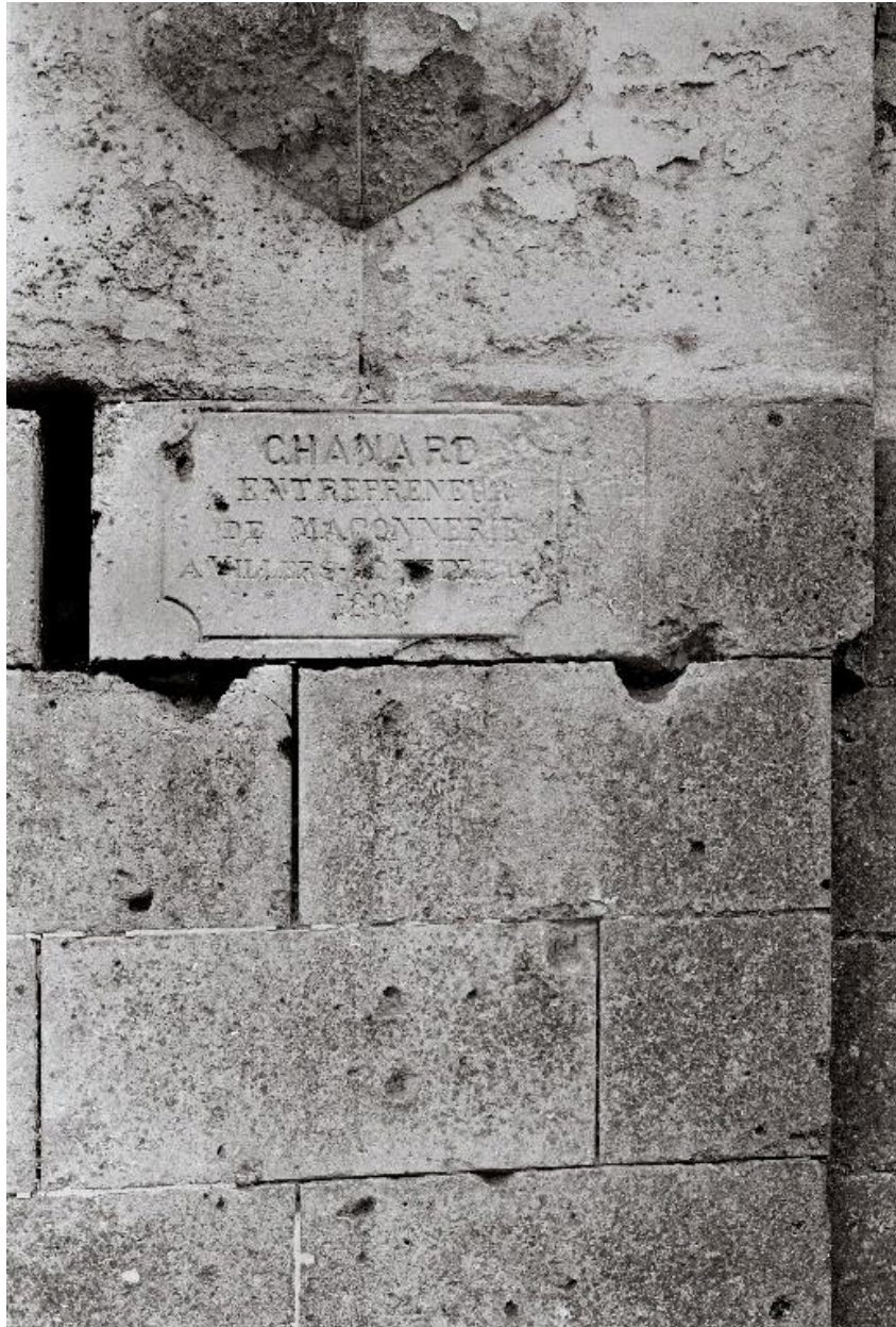
Vue de la signature de l'entrepreneur coterzézien Chanard et de la date de 1895 ou 1899, gravées sur le portail de la ferme, 17 rue Principale.