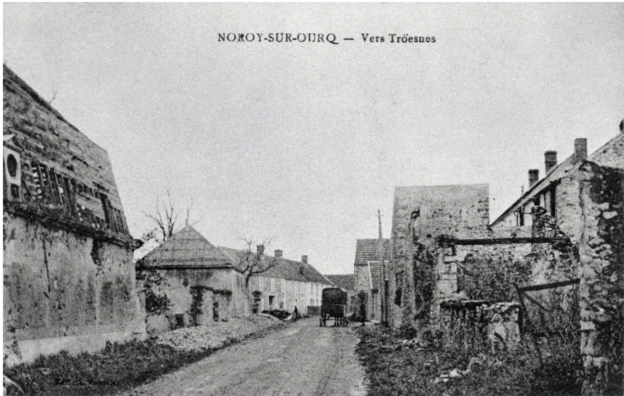
Carte postale montrant une vue est-ouest de la rue principale, vers 1918 (coll. part.).