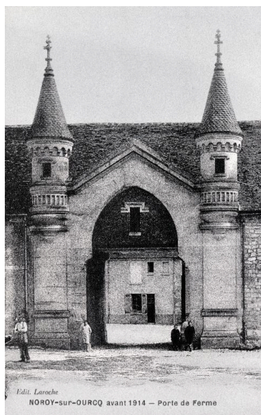
Carte postale représentant l'entrée de la ferme située 17 rue Principale, avant la Première Guerre mondiale.