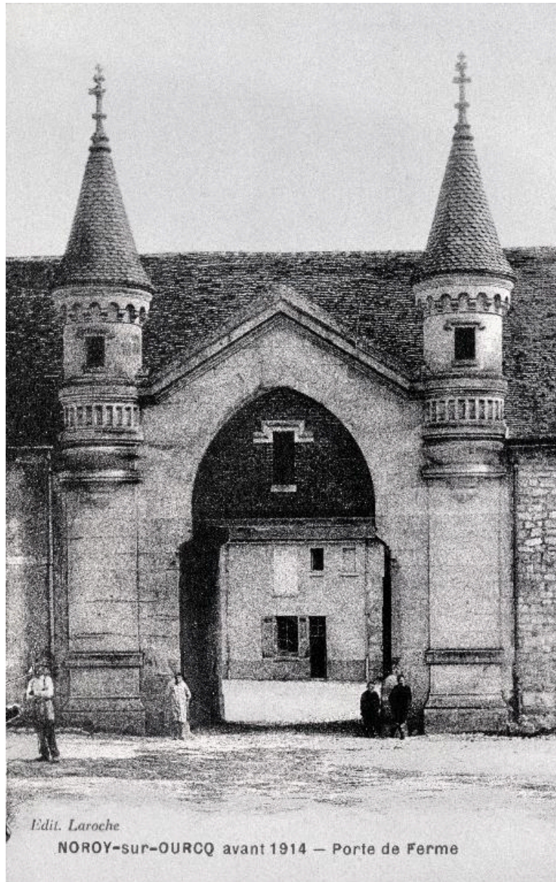
Carte postale représentant l'entrée de la ferme située 17 rue Principale, avant la Première Guerre mondiale.