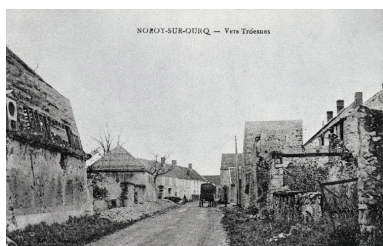
Carte postale montrant une vue est-ouest de la rue principale, vers 1918.