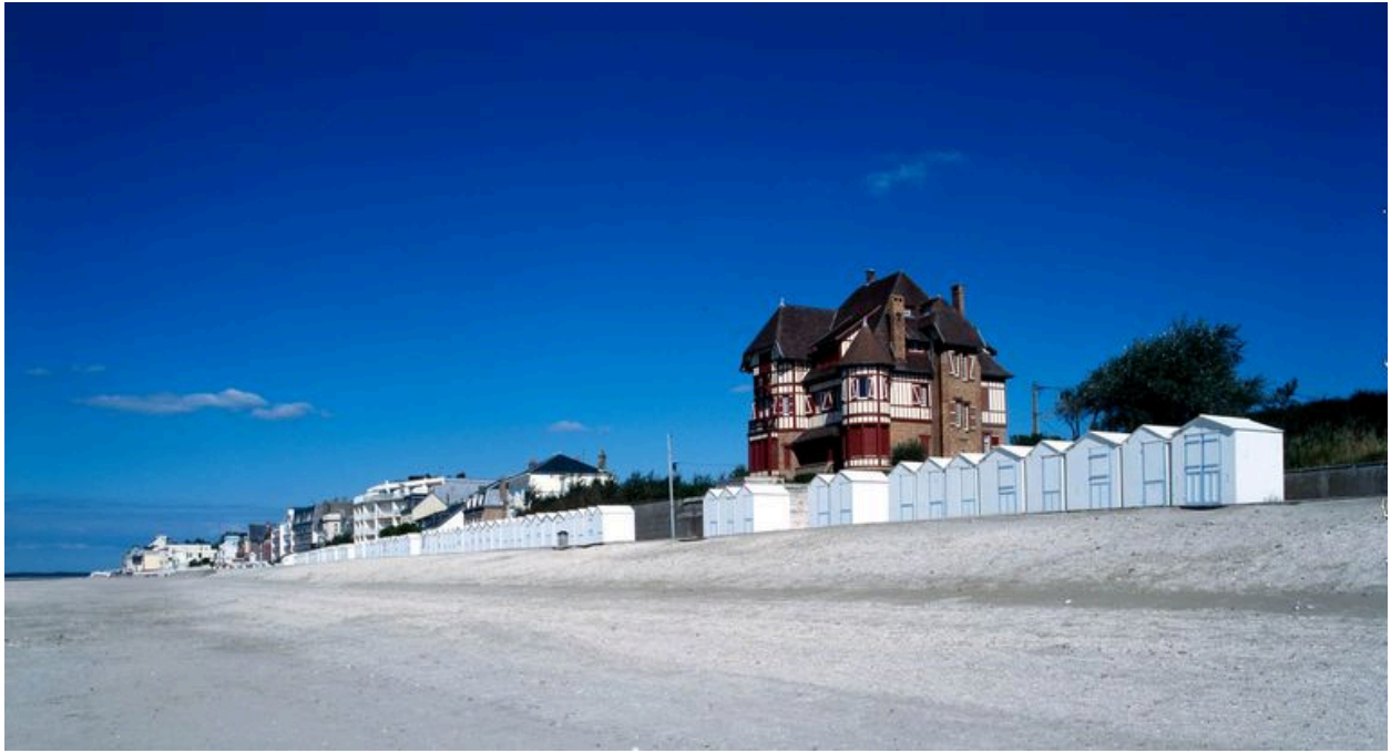
La plage du Crotoy.