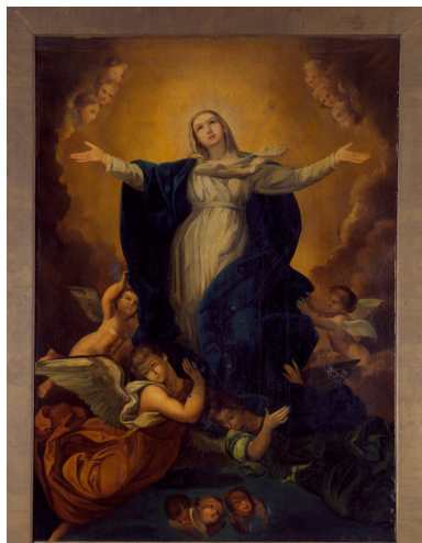
Vue générale. IVR22_19950202831XA