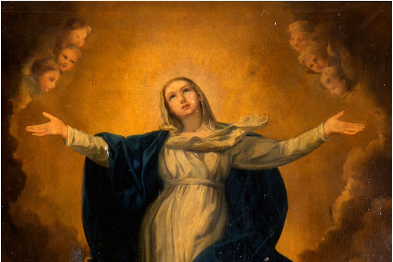
Détail : la Vierge.