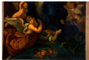
Détail : les anges soutenant la Vierge. IVR22_19950203073ZA