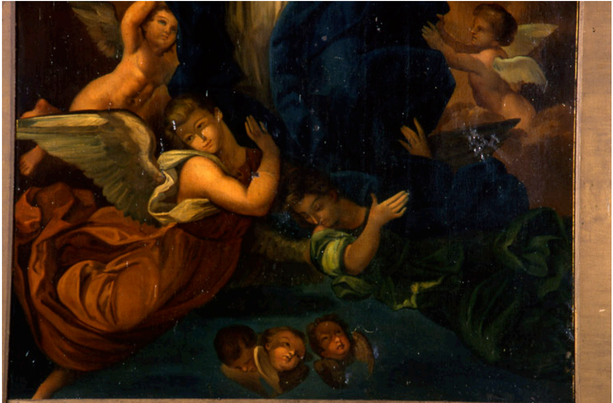
Détail : les anges soutenant la Vierge.