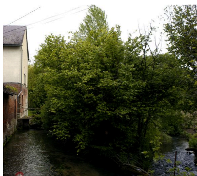
Le canal d'aménée, le déversoir et le pignon du moulin à blé.

Phot. Thierry Lefébure IVR22_20056000059NUCA