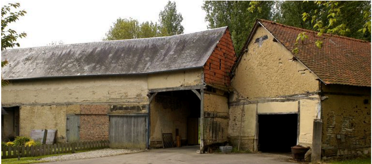
L'entrée charretière et les dépendances agricoles, façade sur cour.