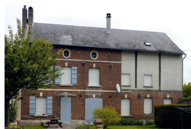
Vue d'ensemble du moulin à blé, façade sur cour.