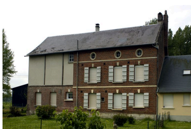
Vue générale du moulin à blé, façade sur jardin. IVR22_20056000061NUCA