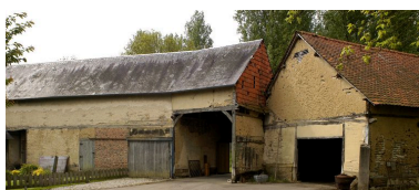
L'entrée charretière et les dépendances agricoles, façade sur cour. IVR22_20056000062NUCA

IVR22_20056000059NUCA