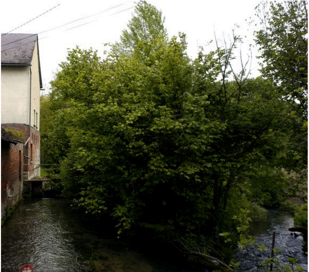
Le canal d'aménée, le déversoir et le pignon du moulin à blé.