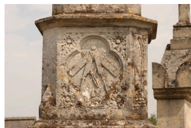
Détail sur le médaillon (emblème du tailleur de pierre).

Phot. Thierry Lefébure IVR22_20038000802NUCA